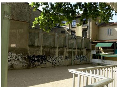
Vue d'ensemble depuis le nord-ouest IVR82_20106903676NUCA