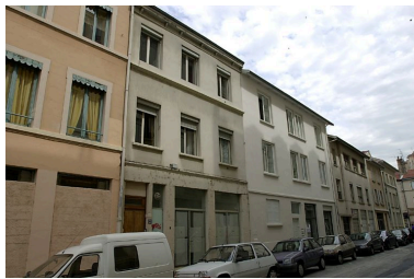
Façade sur rue IVR82_20036900500NUCA