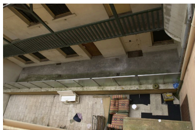
Vue de la cour