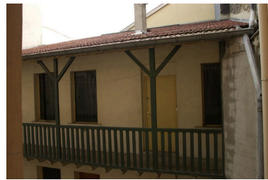
Vue de la coursière desservant le corps de bâtiment sur cour IVR82_20046904612NUCA