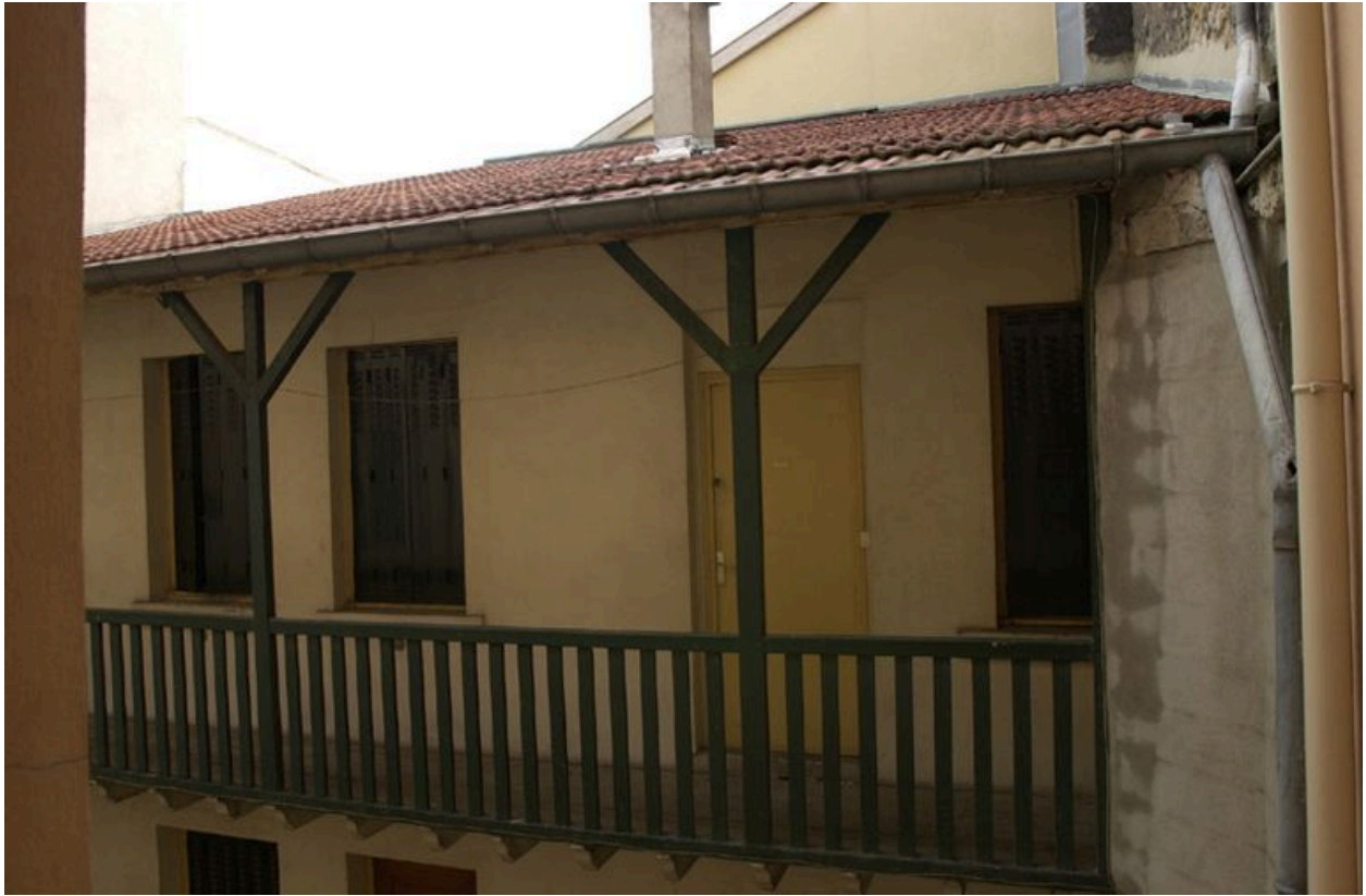
Vue de la coursière desservant le corps de bâtiment sur cour