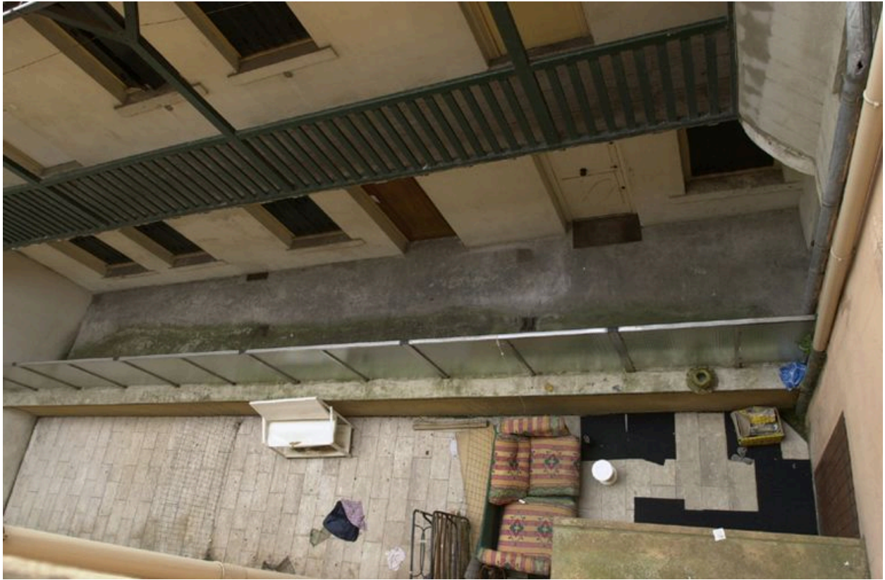
Vue de la cour