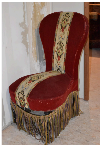
Vue générale IVR84_20216301530NUCA