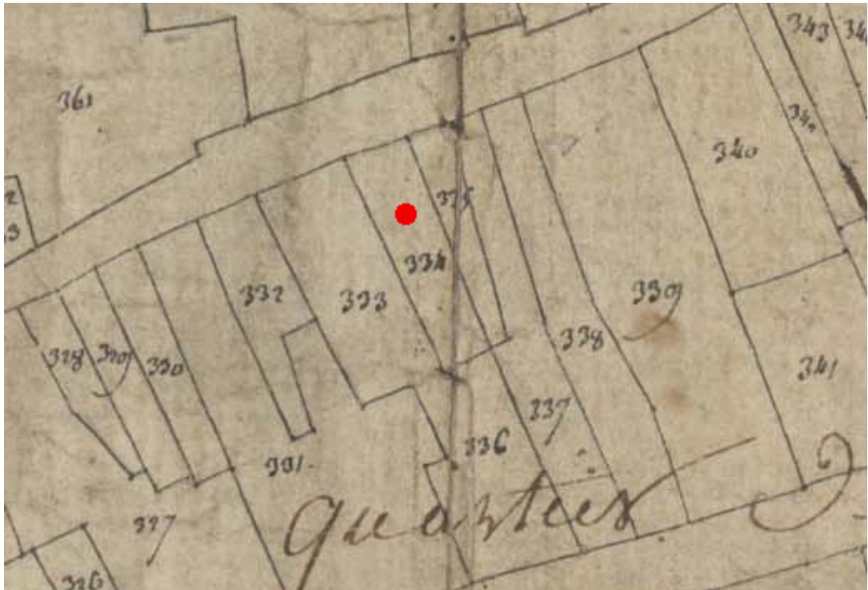
Extrait du cadastre de 1809, parcelle E 334.