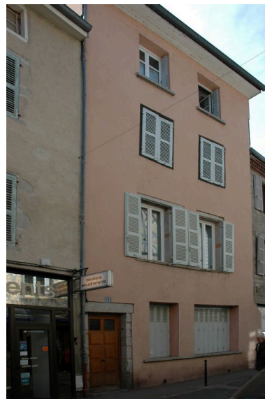
Vue générale. IVR82_20124202658NUCA