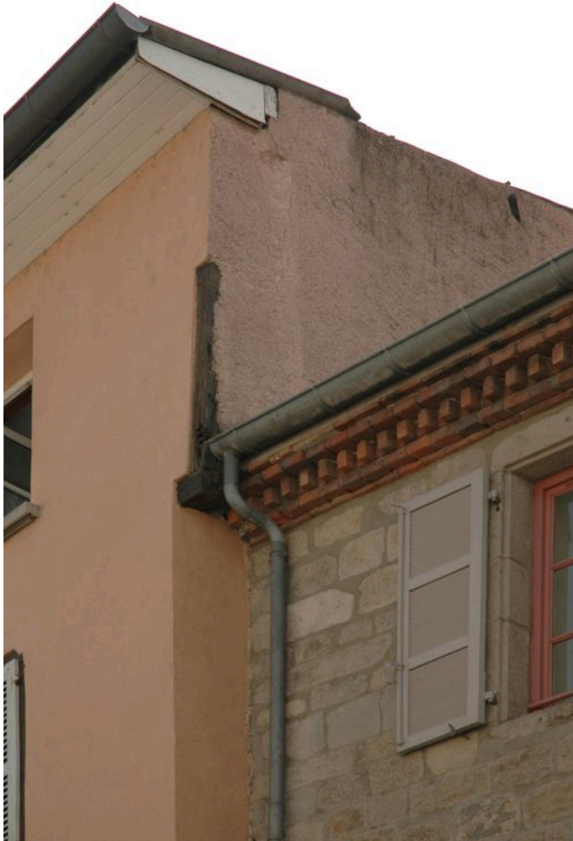
Détail, vestige de charpente dans l'angle nord-ouest de l'élévation sur rue.