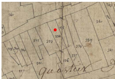
Extrait du cadastre de 1809, parcelle E 334. IVR82_20124202660NUD