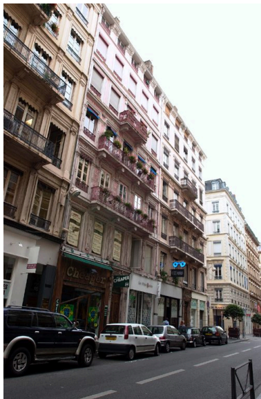
Vue de situation sur la rue de Brest