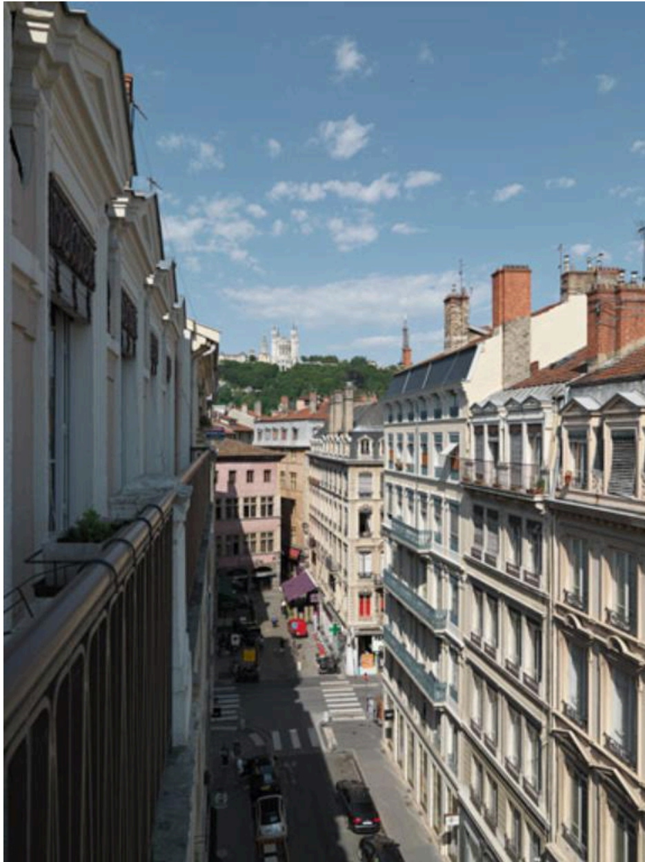
Vue de situation depuis le 5e étage de l'immeuble sis 70 rue du Président-Edouard-Herriot / rue Ferrandière