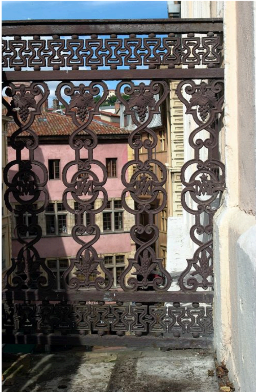
Détail du garde-corps du balcon de l'appartement du 4e étage carré construit pour un ecclésiastique