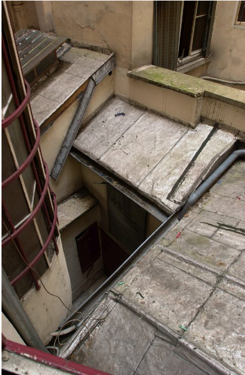
La cour depuis l'escalier