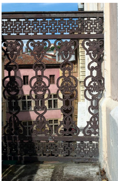
Détail du garde-corps du balcon de l'appartement du 4e étage carré construit pour un ecclésiastique IVR82_20046905225NUCA