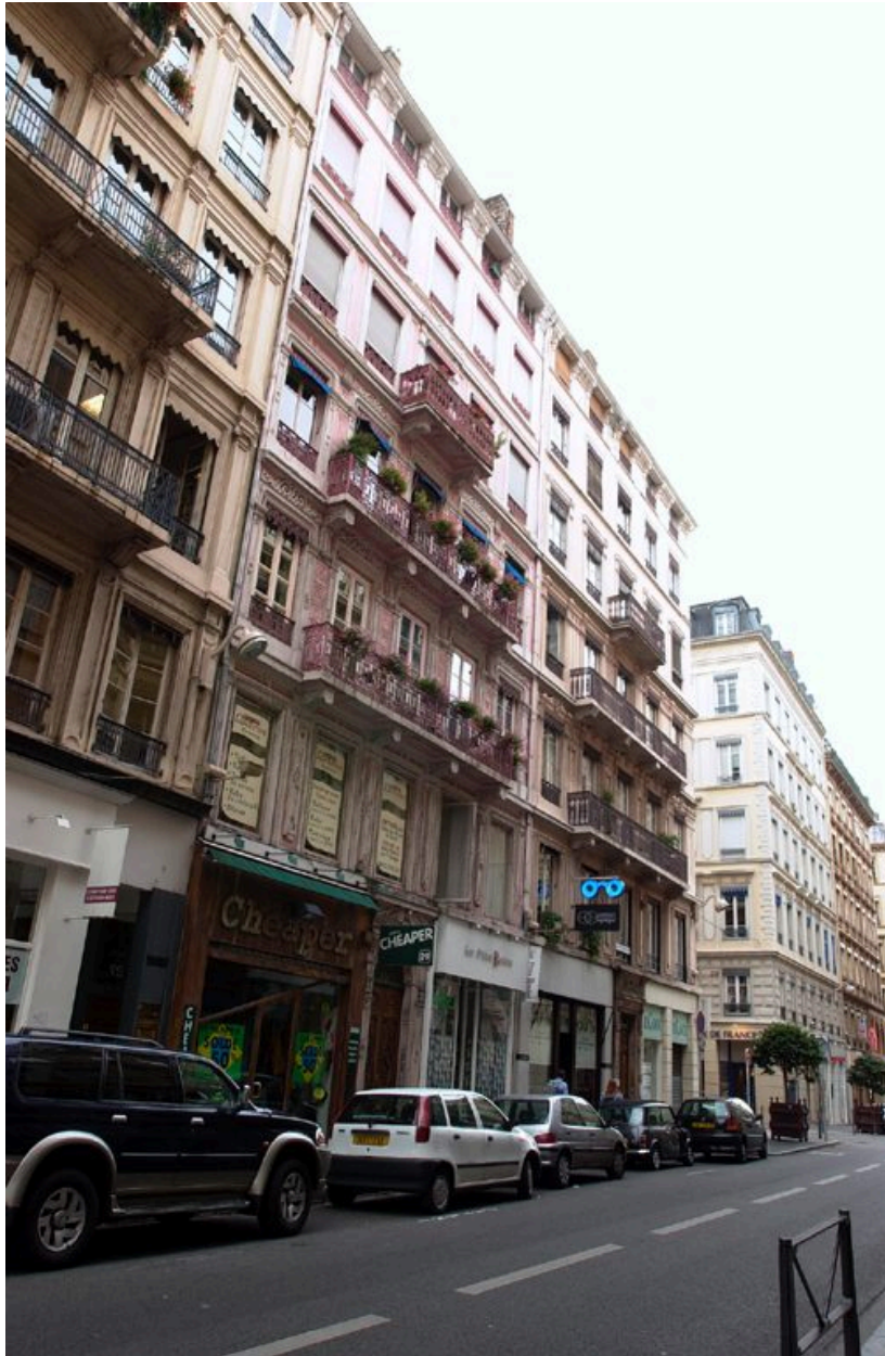
Vue de situation sur la rue de Brest