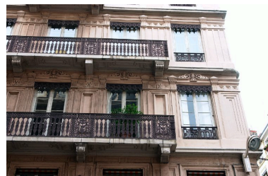
Vue partielle de l'élévation sur la rue de Brest IVR82_20046905223NUCA