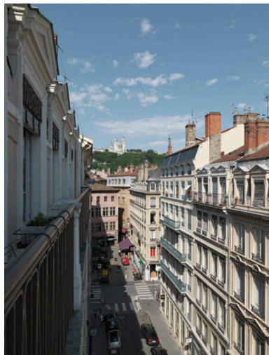
Vue de situation depuis le 5e étage de l'immeuble sis 70 rue du Président-Edouard-Herriot / rue Ferrandière IVR82_20126901516NUCA