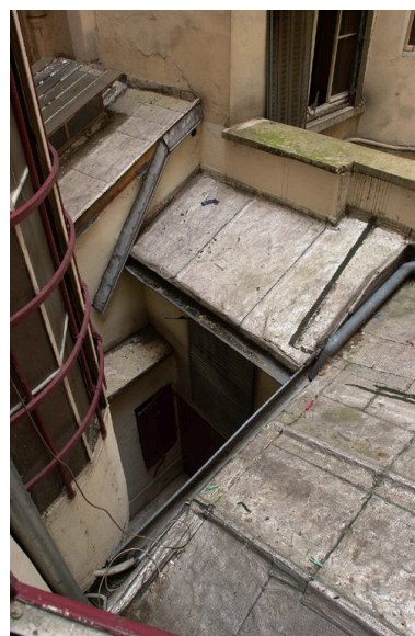
La cour depuis l'escalier IVR82_20046905229NUCA