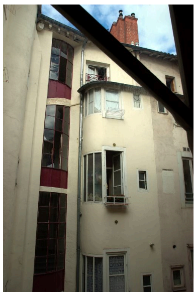
Elévations ouest sur cour depuis l'escalier de l'immeuble sis 5 rue Ferrandière IVR82_20046905355NUCA