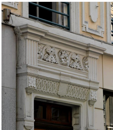
La porte, détail IVR82_20126901475NUCA