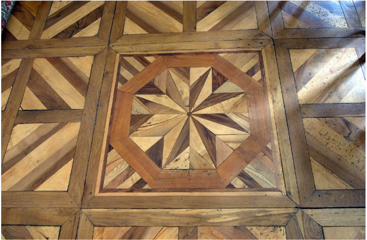
Appartement du quatrième étage carré : détail du parquet ornant la pièce située à l'angle des rues de Brest et Ferrandière