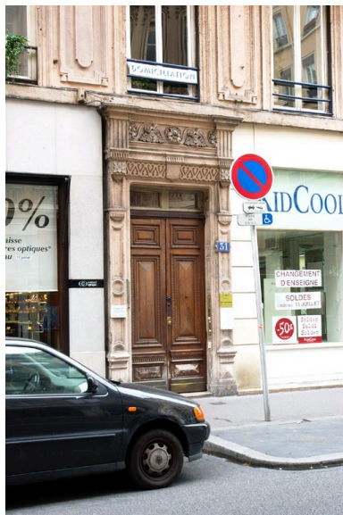
La porte IVR82_20046905221NUCA