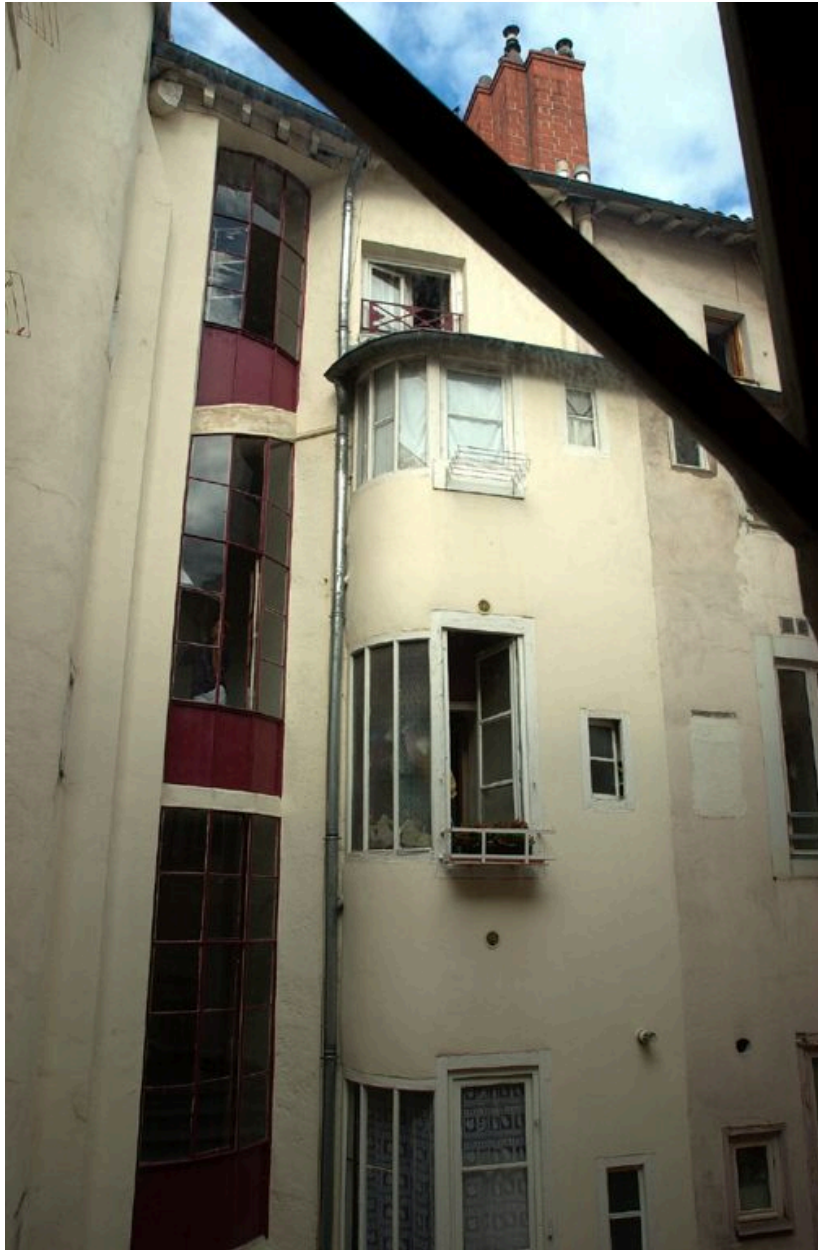
Elévations ouest sur cour depuis l'escalier de l'immeuble sis 5 rue Ferrandière