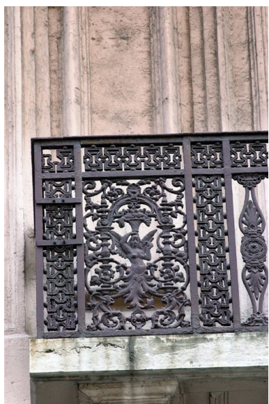
Détail d'un garde-corps, rue de Brest IVR82_20046905224NUCA