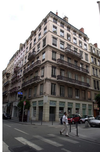
Vue générale IVR82_20046905220NUCA