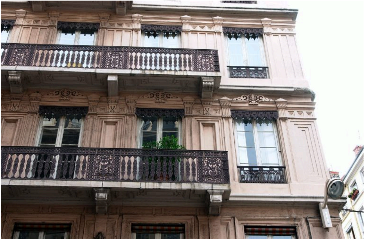
Vue partielle de l'élévation sur la rue de Brest