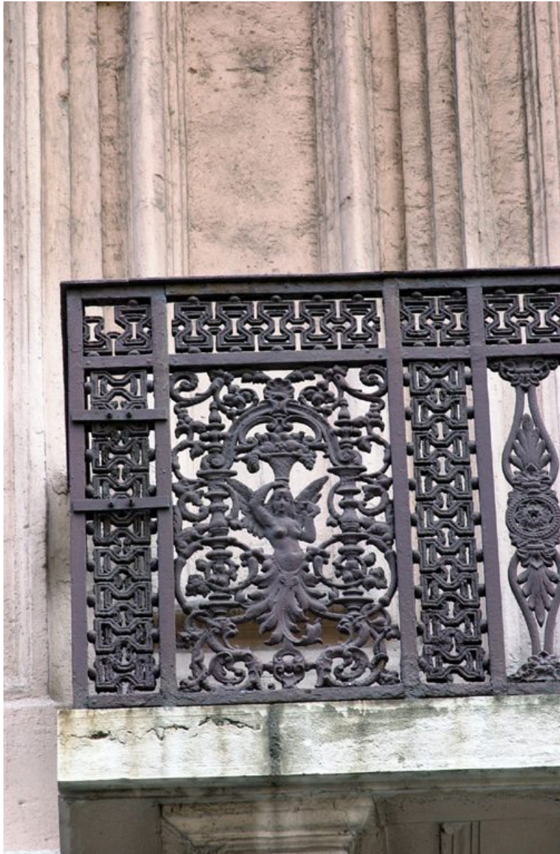
Détail d'un garde-corps, rue de Brest