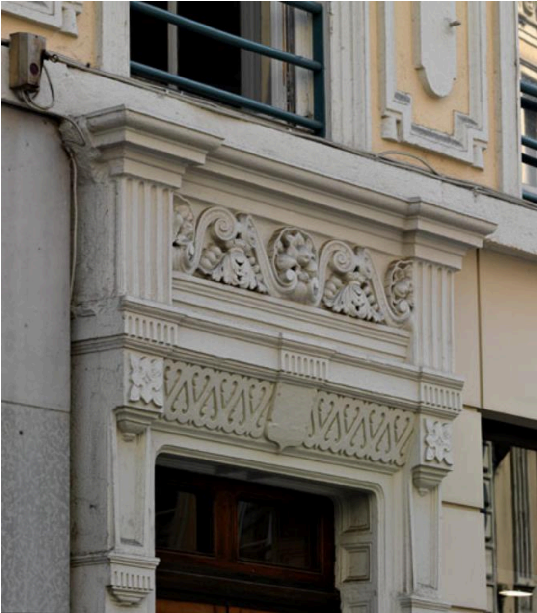
La porte, détail