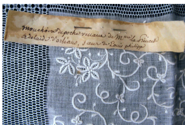
Détail de l'inscription épinglée sur le mouchoir IVR84_20216300465NUC4A