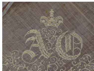
Monogramme d'Adélaïde d'Orléans. IVR84_20216300463NUC4A