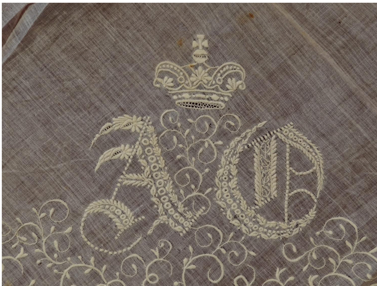
Monogramme d'Adélaïde d'Orléans.