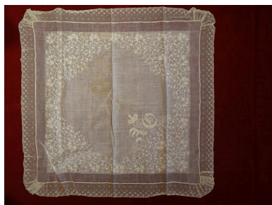
Vue générale IVR84_20216300461NUC4A