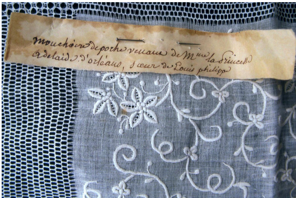
Détail de l'inscription épinglée sur le mouchoir