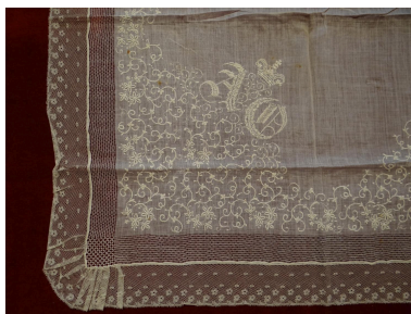
Détail IVR84_20216300462NUC4A