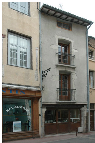
Vue générale. IVR82_20124202554NUCA