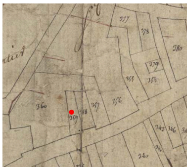
Extrait du plan cadastral de 1809, parcelle E 359.