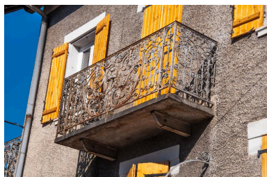
Balcon médian de la façade sud