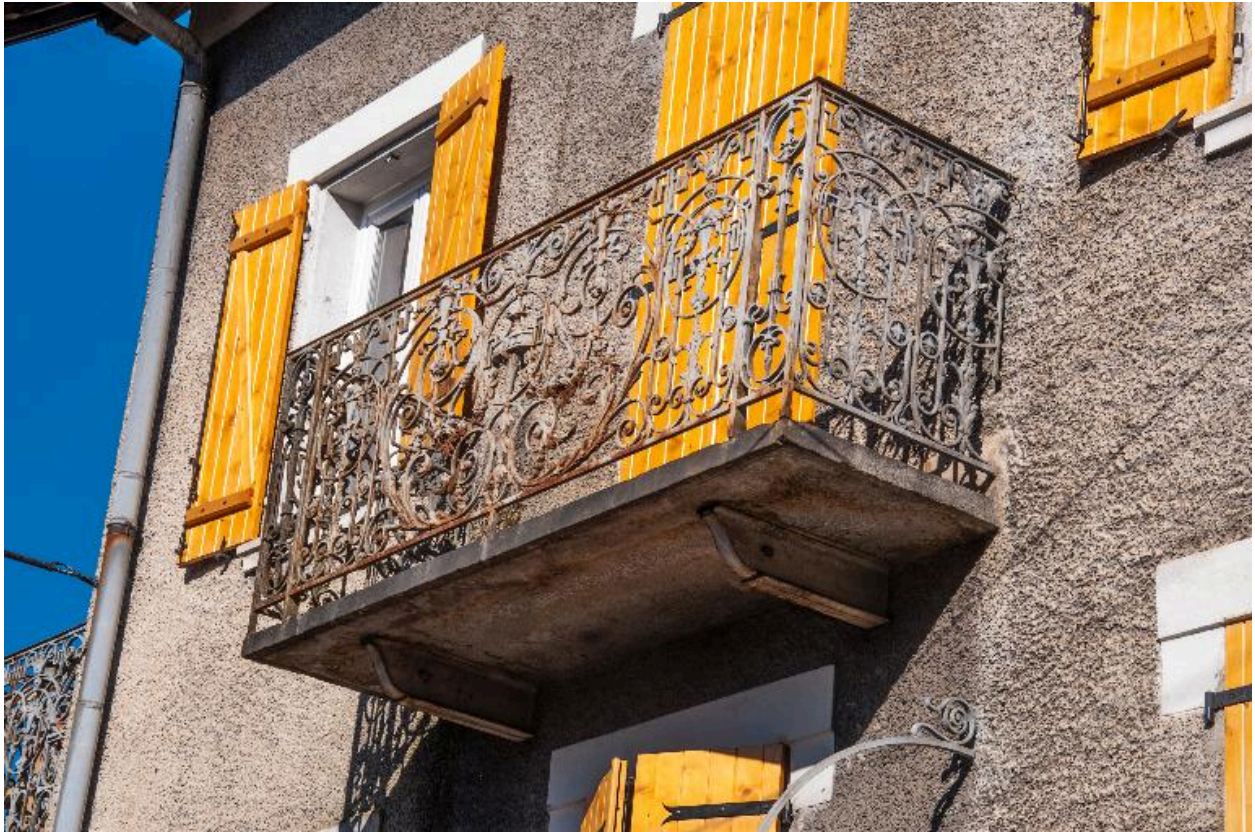
Balcon médian de la façade sud