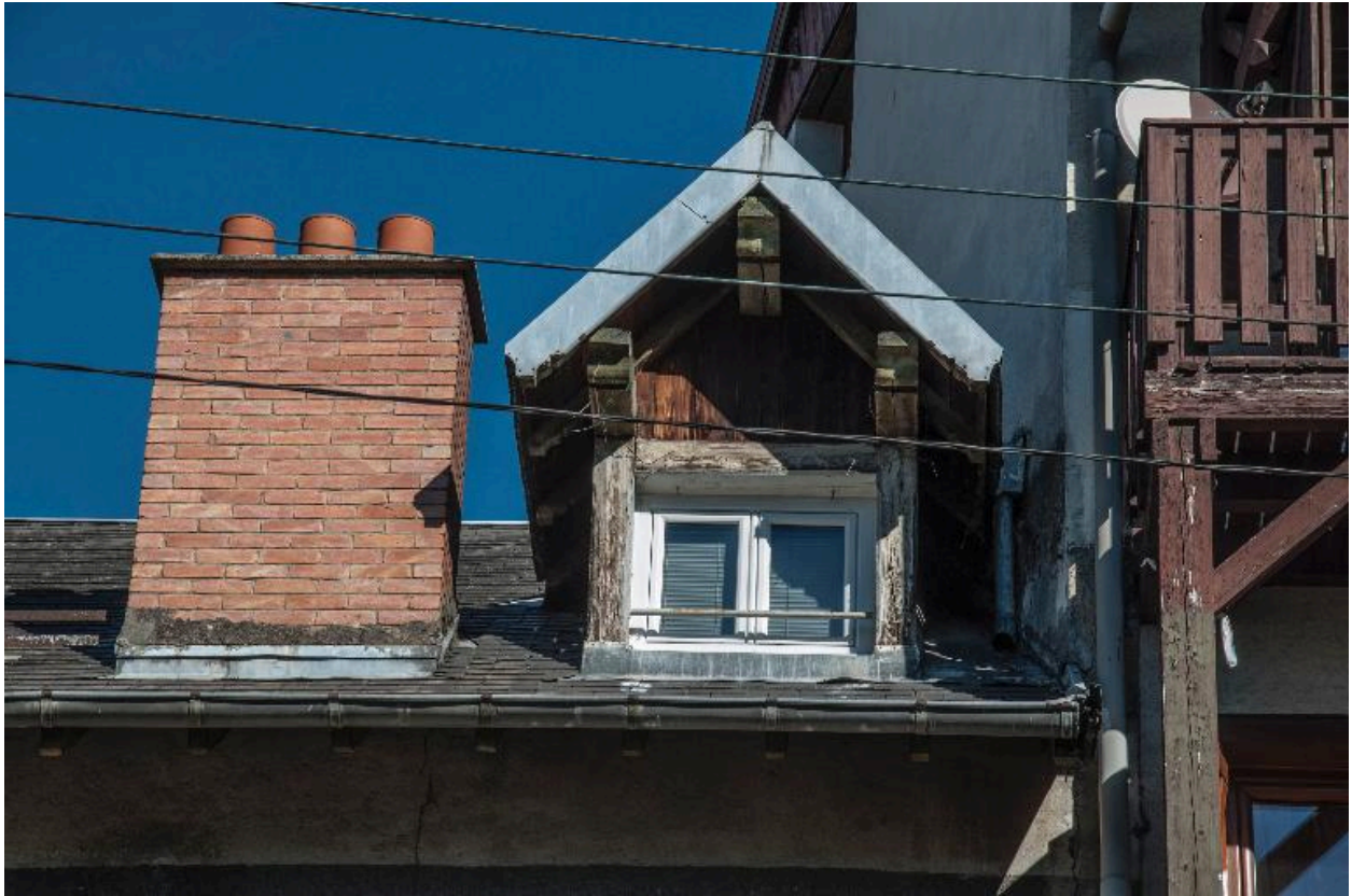
Lucarne à deux pans (jacobine) sur le versant sud