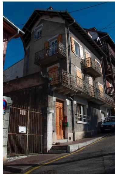
Pignon ouest, vue de trois- quart depuis le sud-ouest