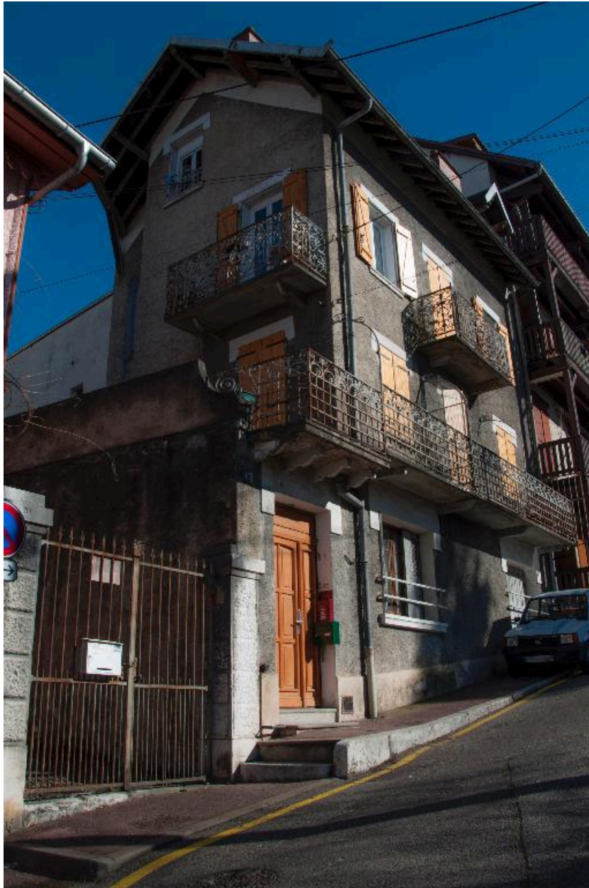
Pignon ouest, vue de trois-quart depuis le sud-ouest