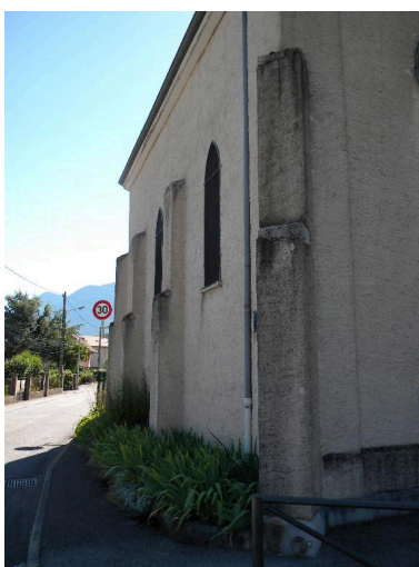
Vue d'une face latérale