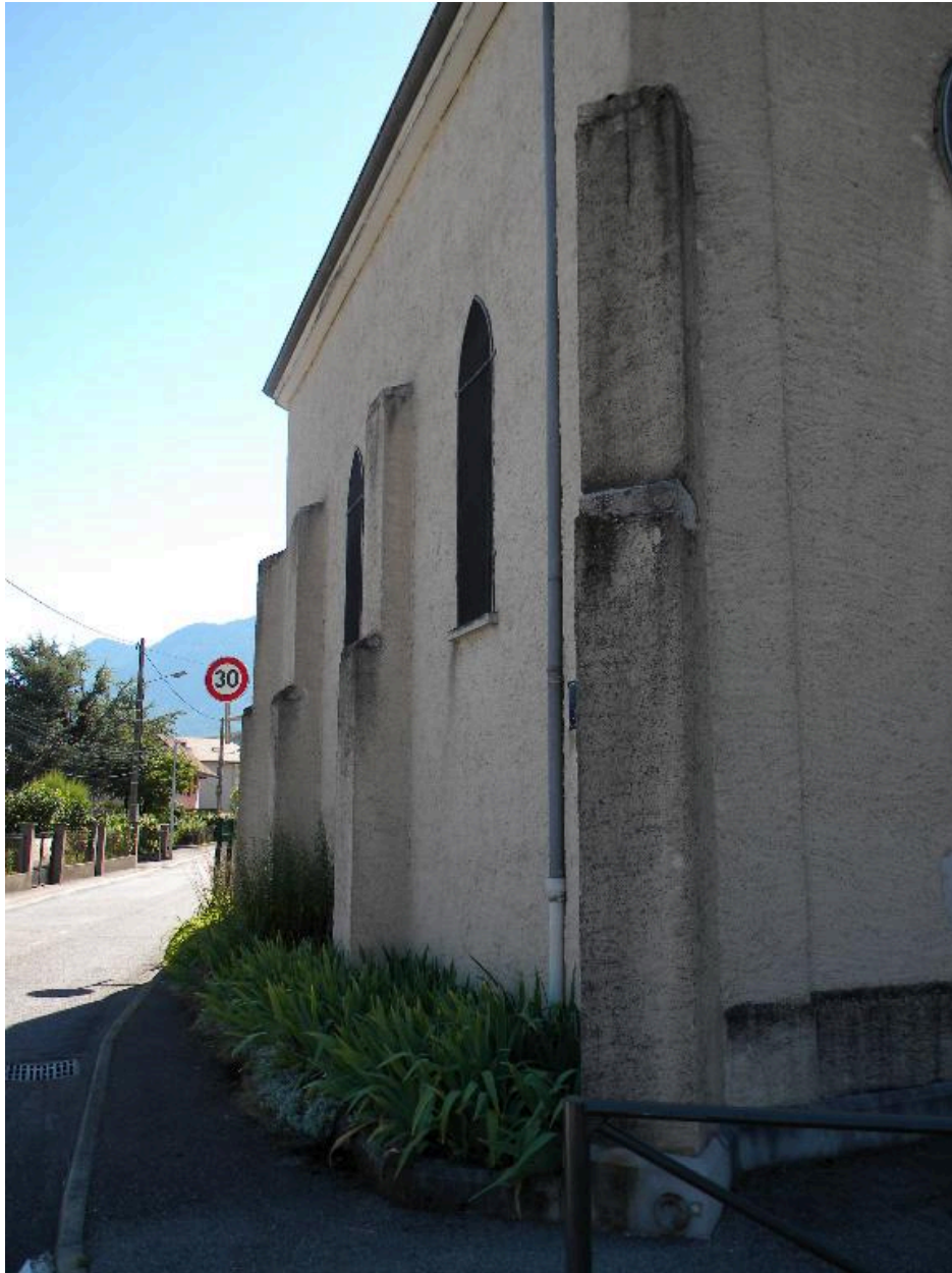
Vue d'une face latérale