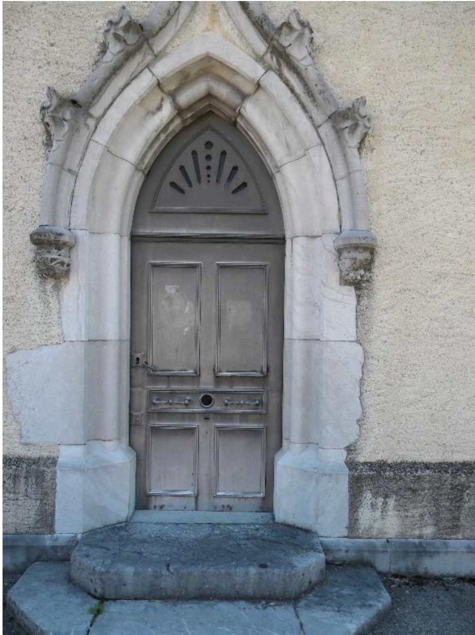
Détail du portail d'entrée