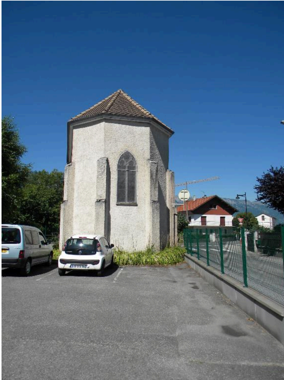
Vue du chevet