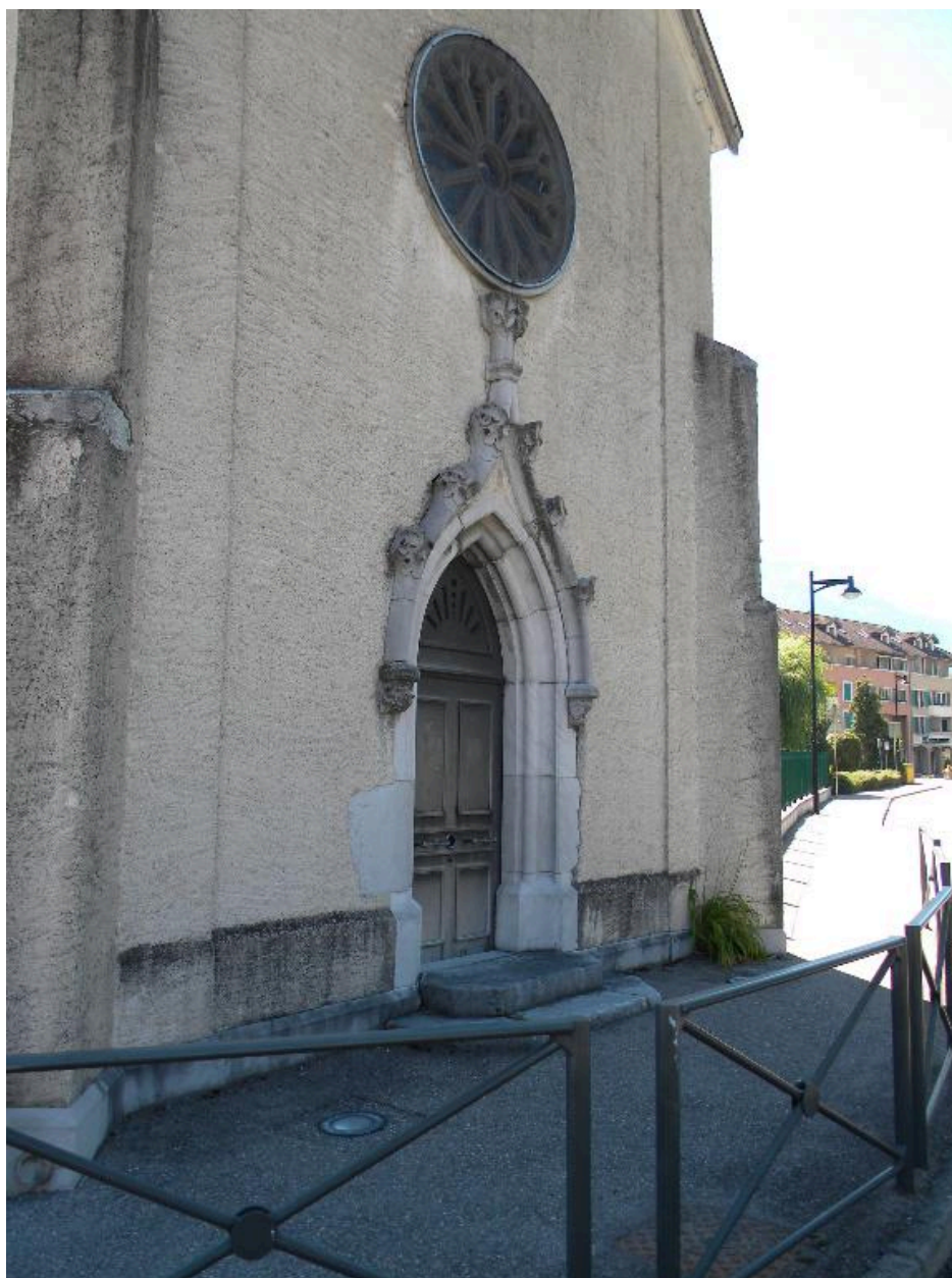
Vue de la façade principale.