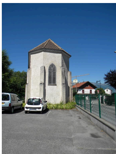
Vue du chevet