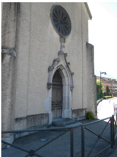
Vue de la façade principale. IVR82_20147400055NUCA