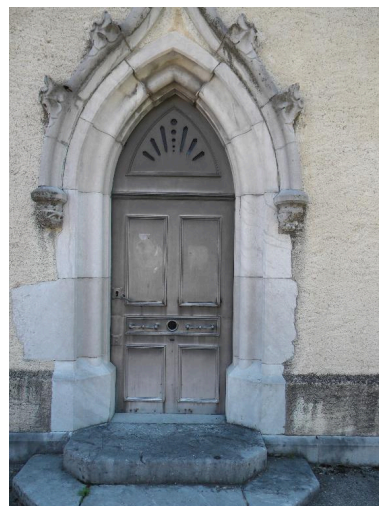
Détail du portail d'entrée IVR82_20147400056NUCA