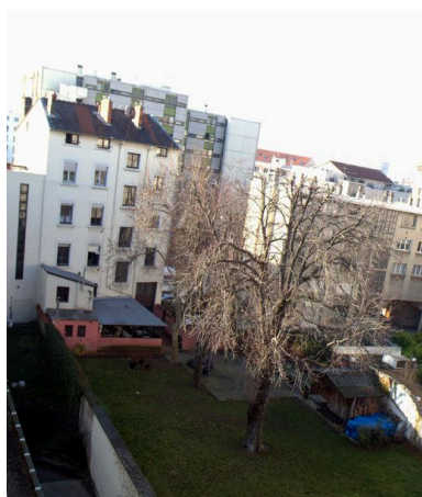
Elévation postérieure et jardin IVR82_20116904924NUCA