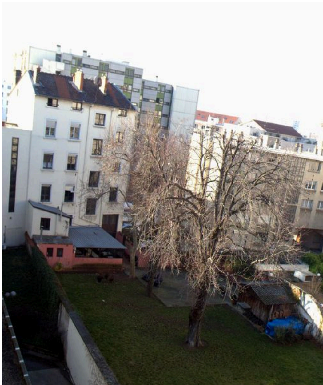
Elévation postérieure et jardin