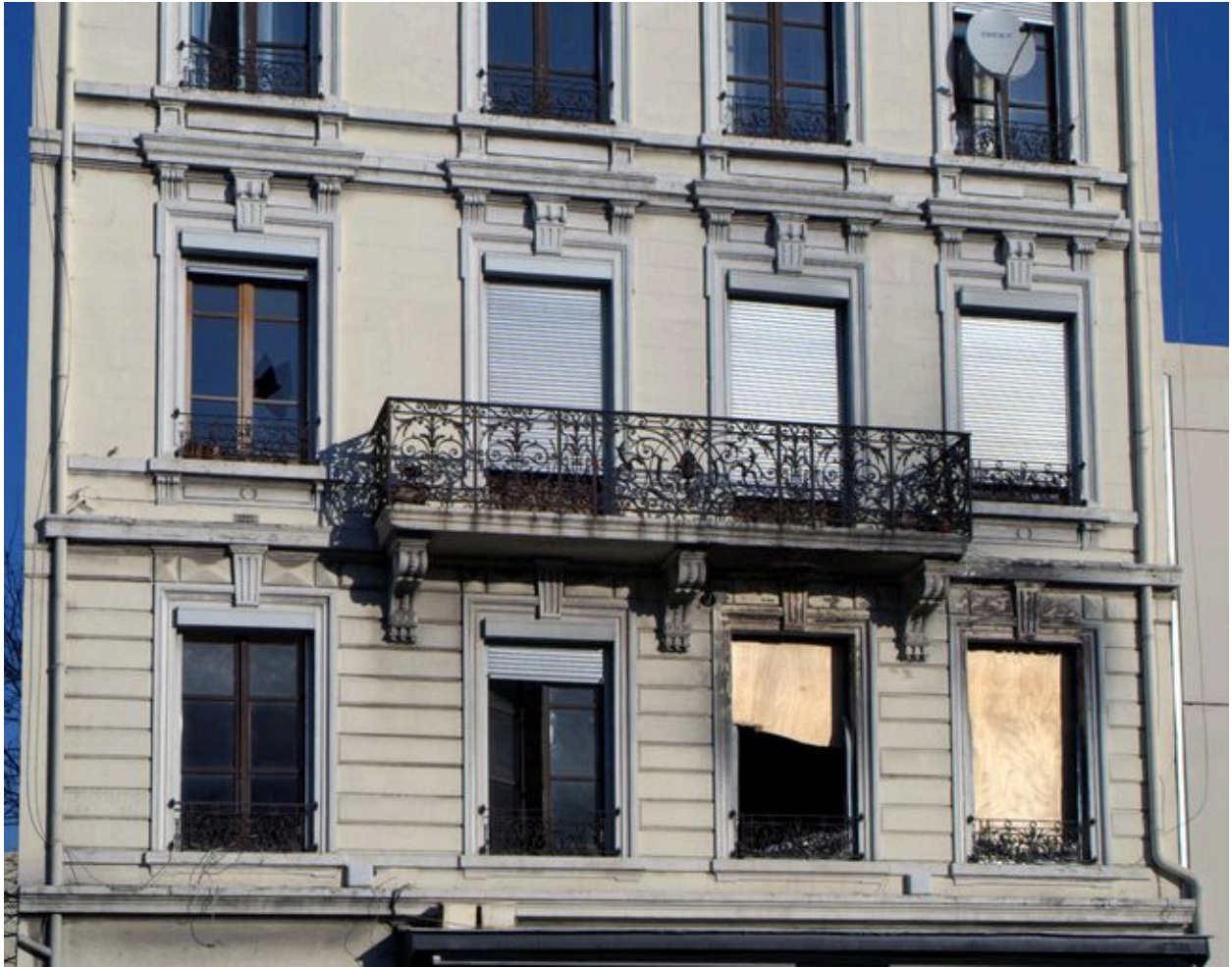
Elévation antérieure, détail