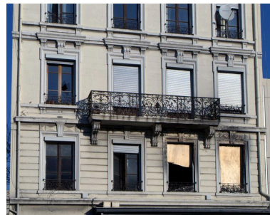
Elévation antérieure, détail IVR82_20116904923NUCA