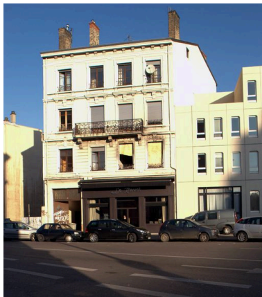
Vue générale IVR82_20116904922NUCA

Plan masse et de situation, extrait de http://cadastre.gouv.fr IVR82_20136902379NUDA