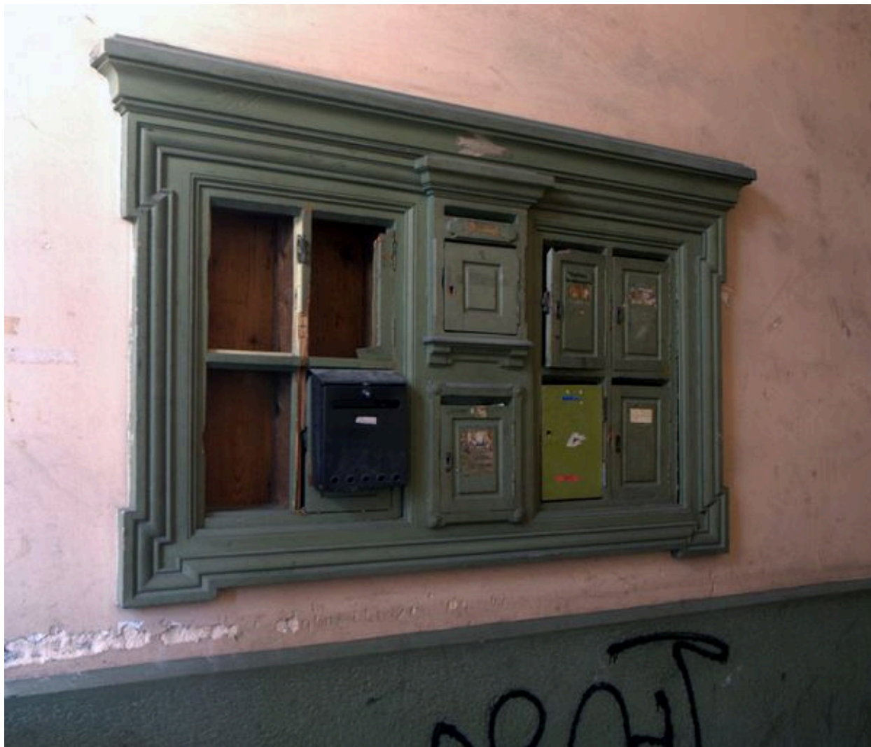
Boîtes aux lettres