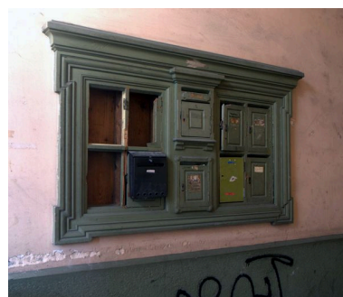
Boîtes aux lettres IVR82_20116904926NUCA