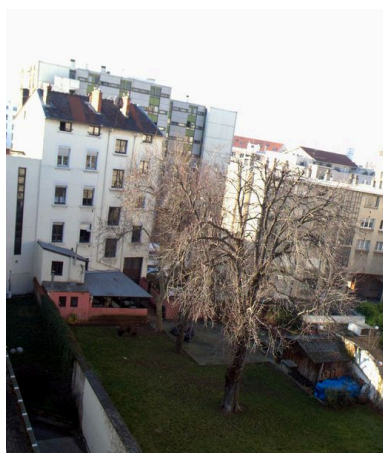
Elévation postérieure et jardin IVR82_20116904924NUCA