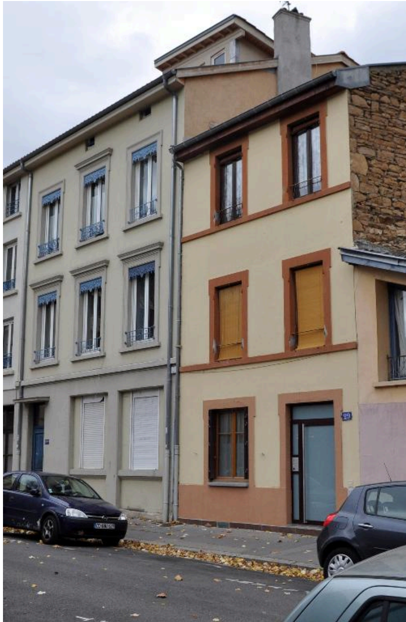
Vue latérale, montrant la surélévation partielle