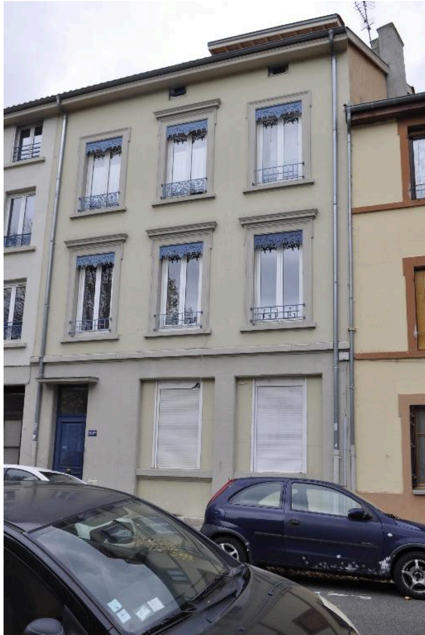
Elévation sur rue, décor élémentaire