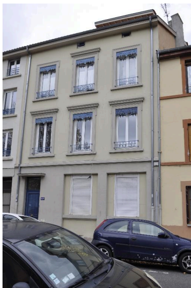
Élévation sur rue, décor élémentaire