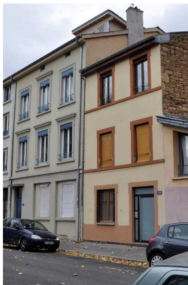
Vue latérale, montrant la surélévation partielle IVR84_20166902059NUCA