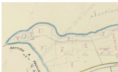
Cadastre rénové, Bourget-en-Huile, 1961, Section A, feuille 6 (FR.AD073, 3P 7054). IVR82_20147303067NUCA