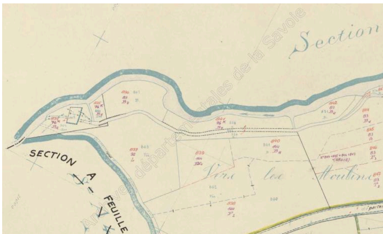
Cadastre rénové, Bourget-en-Huile, 1961, Section A, feuille 6 (FR.AD073, 3P 7054).