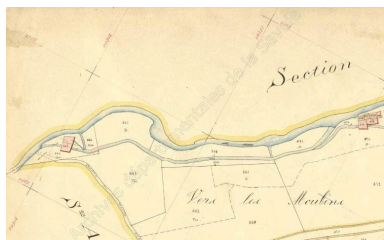
Premier cadastre français, Bourget-en-Huile, 1892, Section A, feuille 6 (FR.AD073, 3P 7053). IVR82_20147303066NUCA