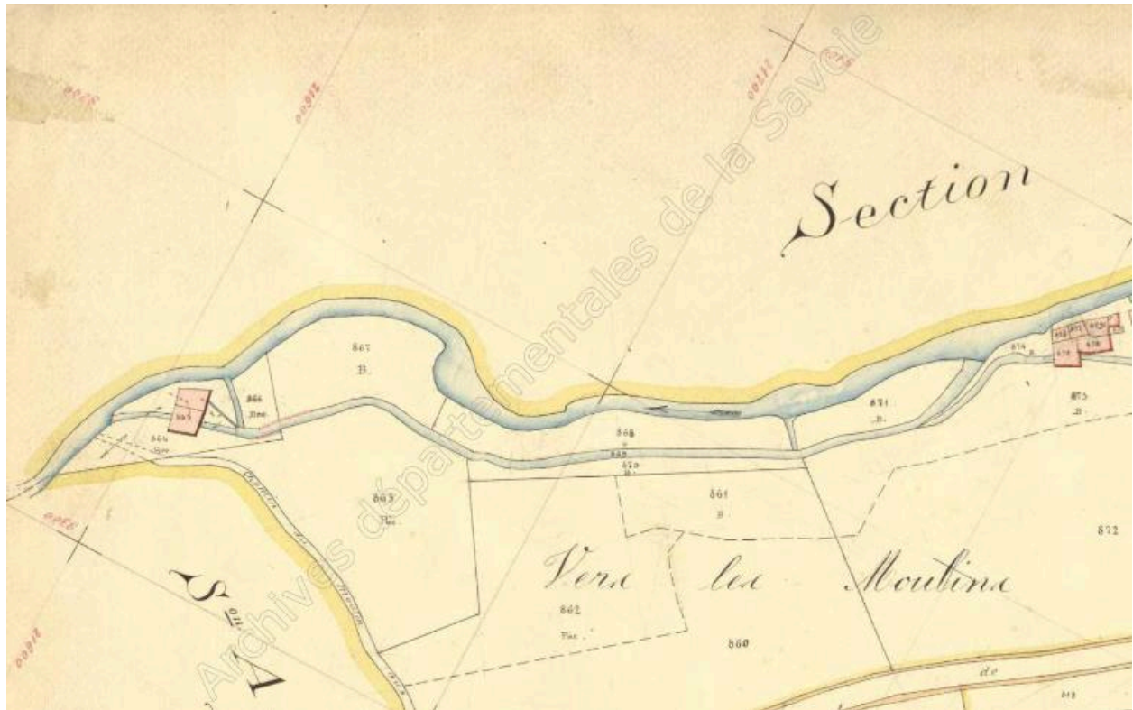
Premier cadastre français, Bourget en huile, 1892, Section A, feuille 6 (FR.AD073, 3P 7053).