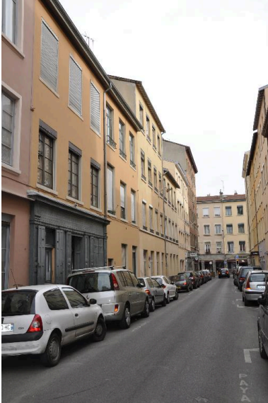
Vue d'ensemble sud est de l'immeuble de deux étages IVR82_20146900557NUCA