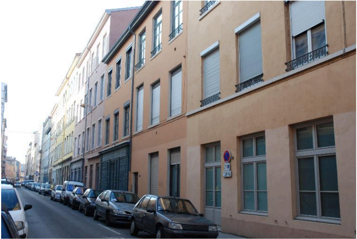
Vue d'ensemble nord est