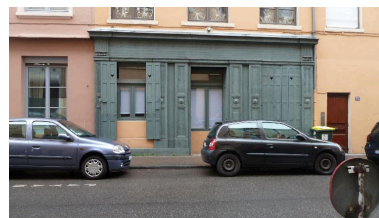
Vue de la devanture en bois