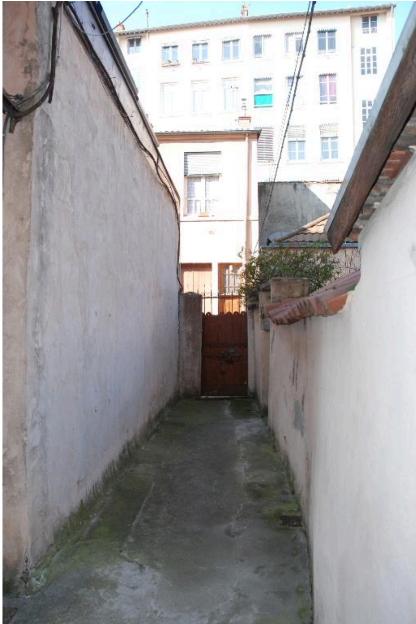
Vue de l'allée extérieure