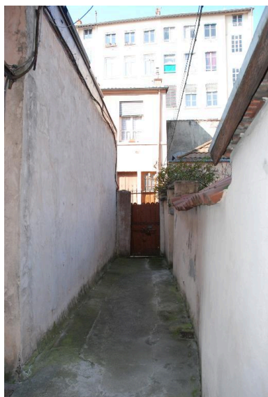
Vue de l'allée extérieure IVR82_20146900140NUCA