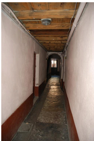
Vue de l'allée IVR82_20146900138NUCA