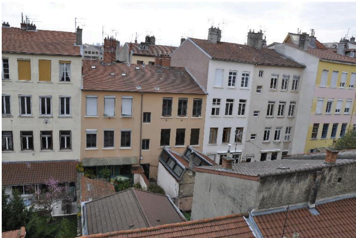
Vue ouest de l'immeuble de deux étages