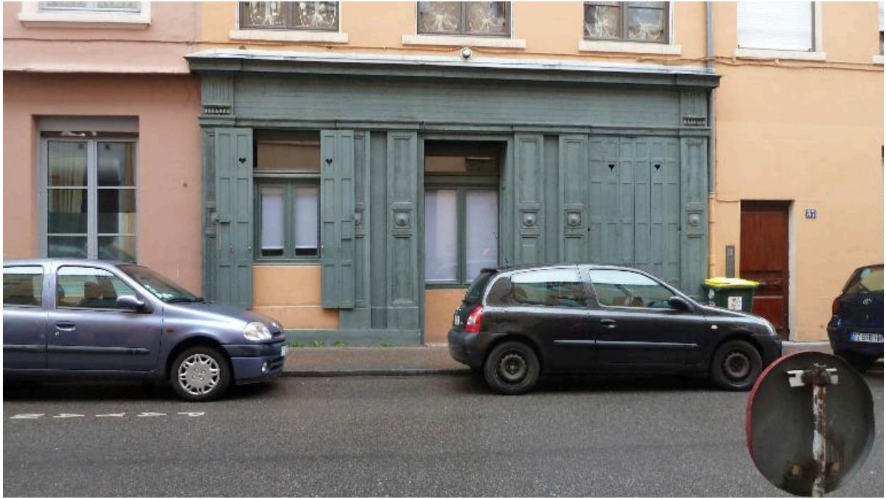
Vue de la devanture en bois