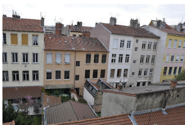
Vue ouest de l'immeuble de deux étages IVR82_20146900262NUCA