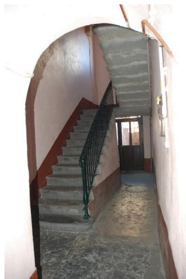
Vue du départ de l'escalier