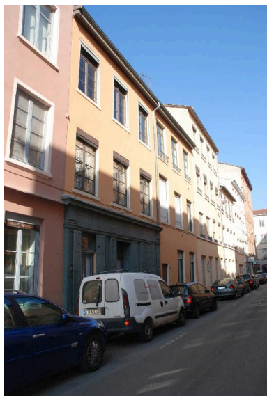
Vue d'ensemble sud est IVR82_20146900134NUCA