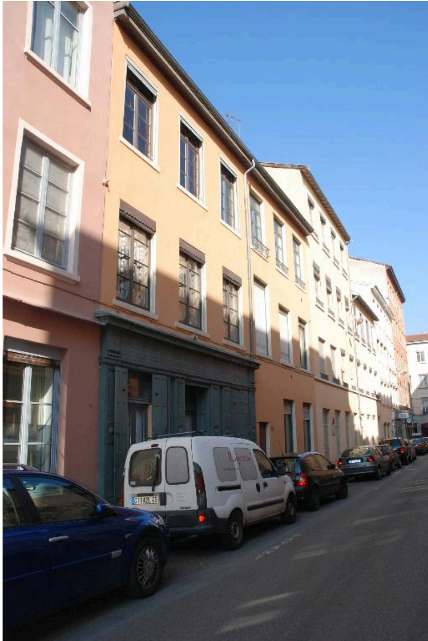
Vue d'ensemble sud est