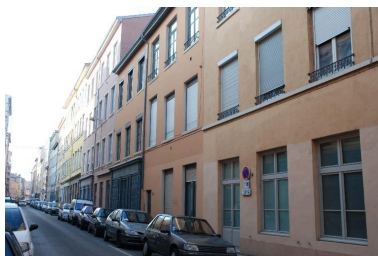
Vue d'ensemble nord est