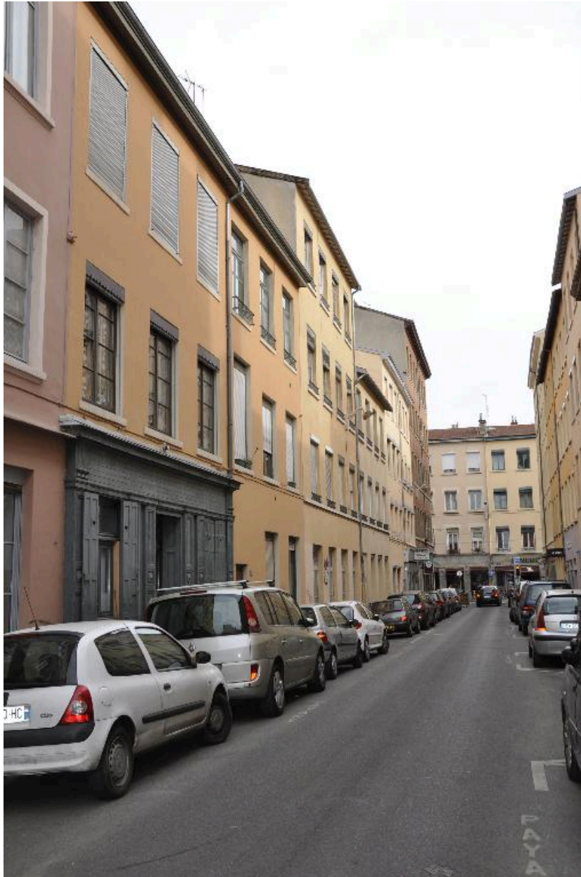
Vue d'ensemble sud est de l'immeuble de deux étages