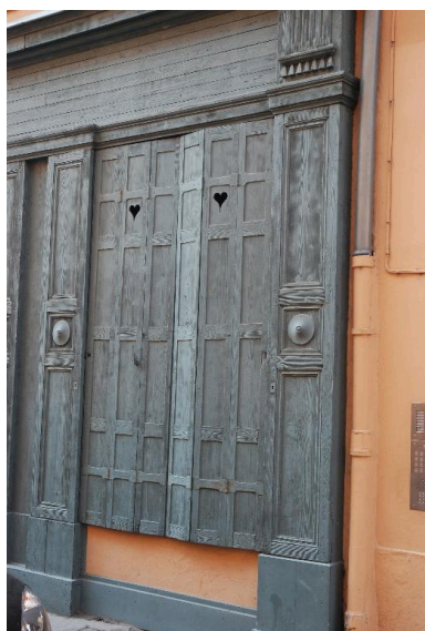
Détail de la devanture en bois IVR82_20146900137NUCA