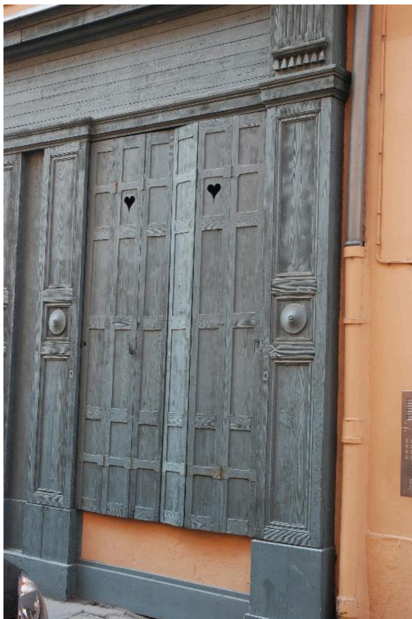
Détail de la devanture en bois