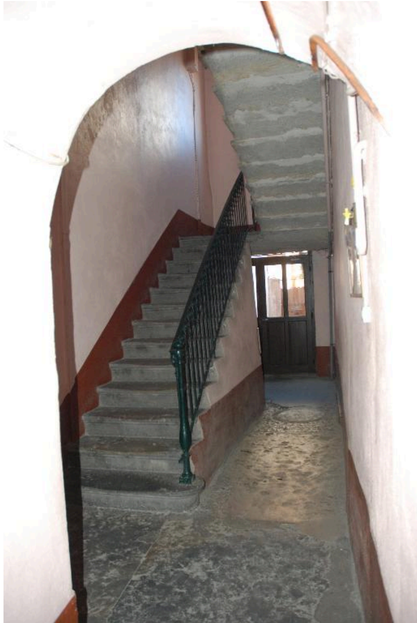
Vue du départ de l'escalier