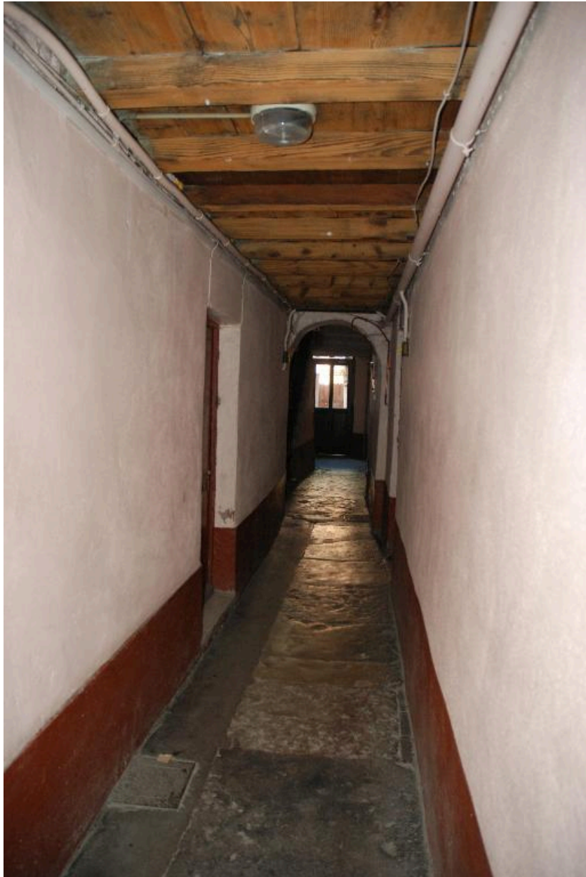
Vue de l'allée