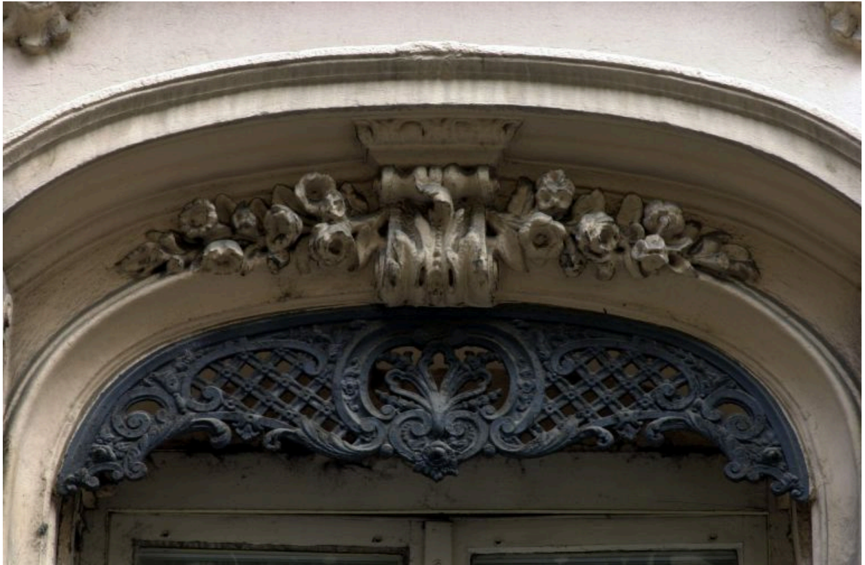
Façade, 2e niveau, partie supérieure de la 3e fenêtre