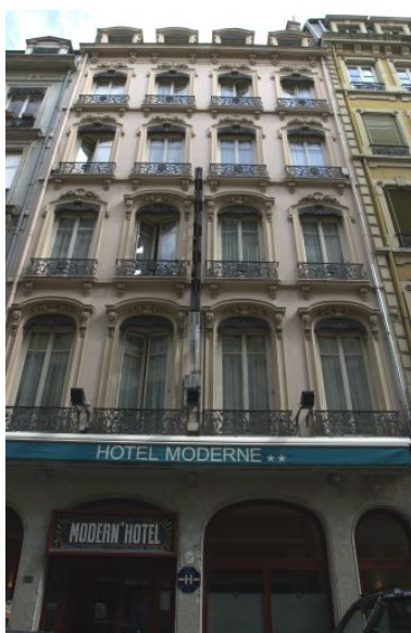
Façade, vue générale par-dessous IVR82_20046900861NUCA