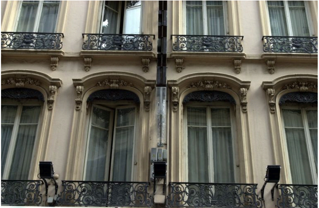
Façade, détail des 2e et 3e niveaux