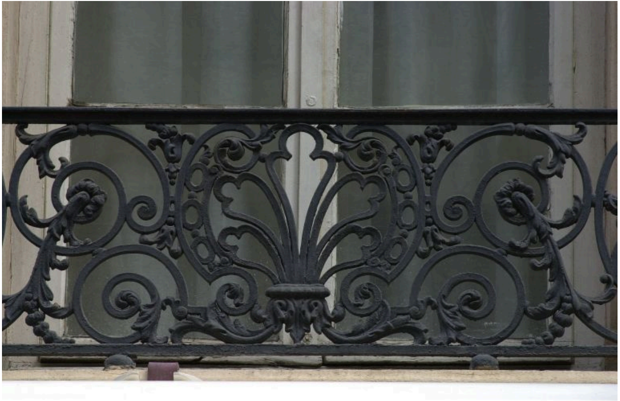
Façade, 2e niveau, détail du garde-corps de la 3e fenêtre