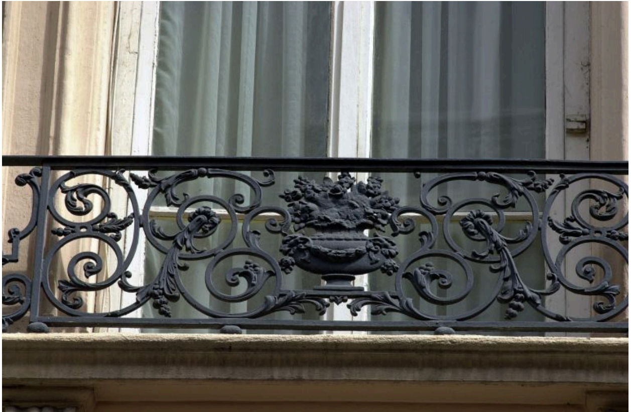
Façade, 3e niveau, détail du garde-corps de la 3e fenêtre