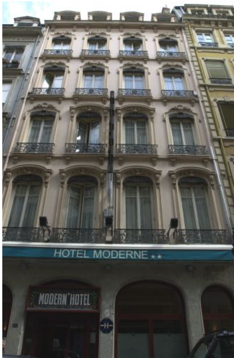
Façade, vue générale par-dessous