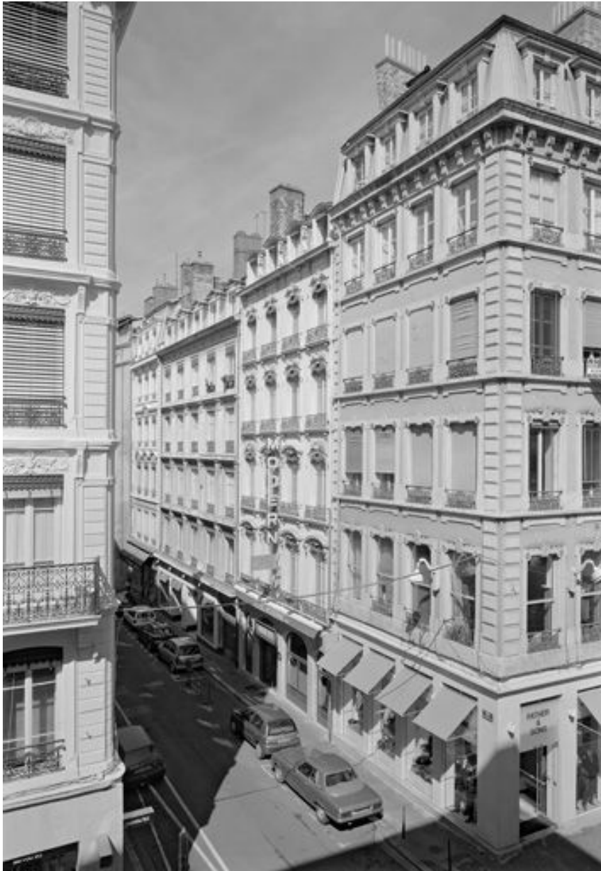
Façade, vue générale