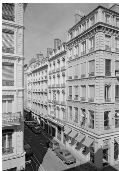
Façade, vue générale IVR82_20056901736P