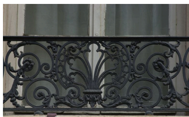
Façade, 2e niveau, détail du garde-corps de la 3e fenêtre IVR82_20046900863NUCA