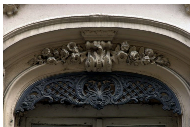
Façade, 2e niveau, partie supérieure de la 3e fenêtre IVR82_20046900864NUCA