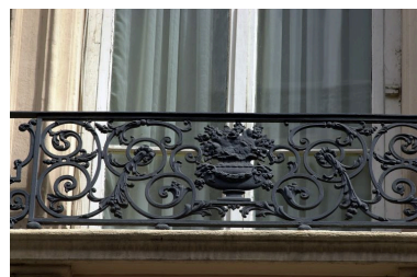
Façade, 3e niveau, détail du garde-corps de la 3e fenêtre IVR82_20046900865NUCA