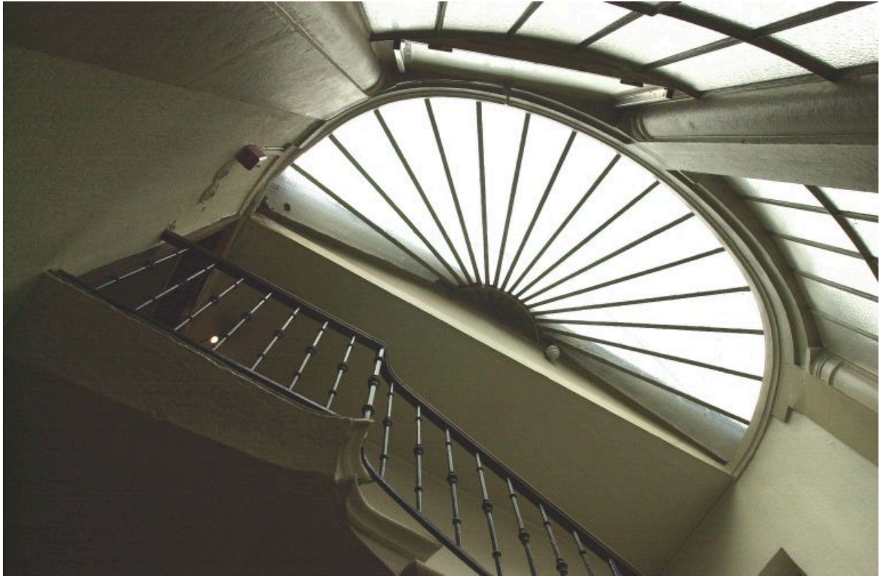
Vue intérieure du couronnement en verrière de la cage d'escalier