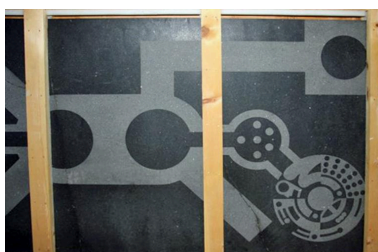
Vue de face (2009) IVR82_20173800493NUCAB