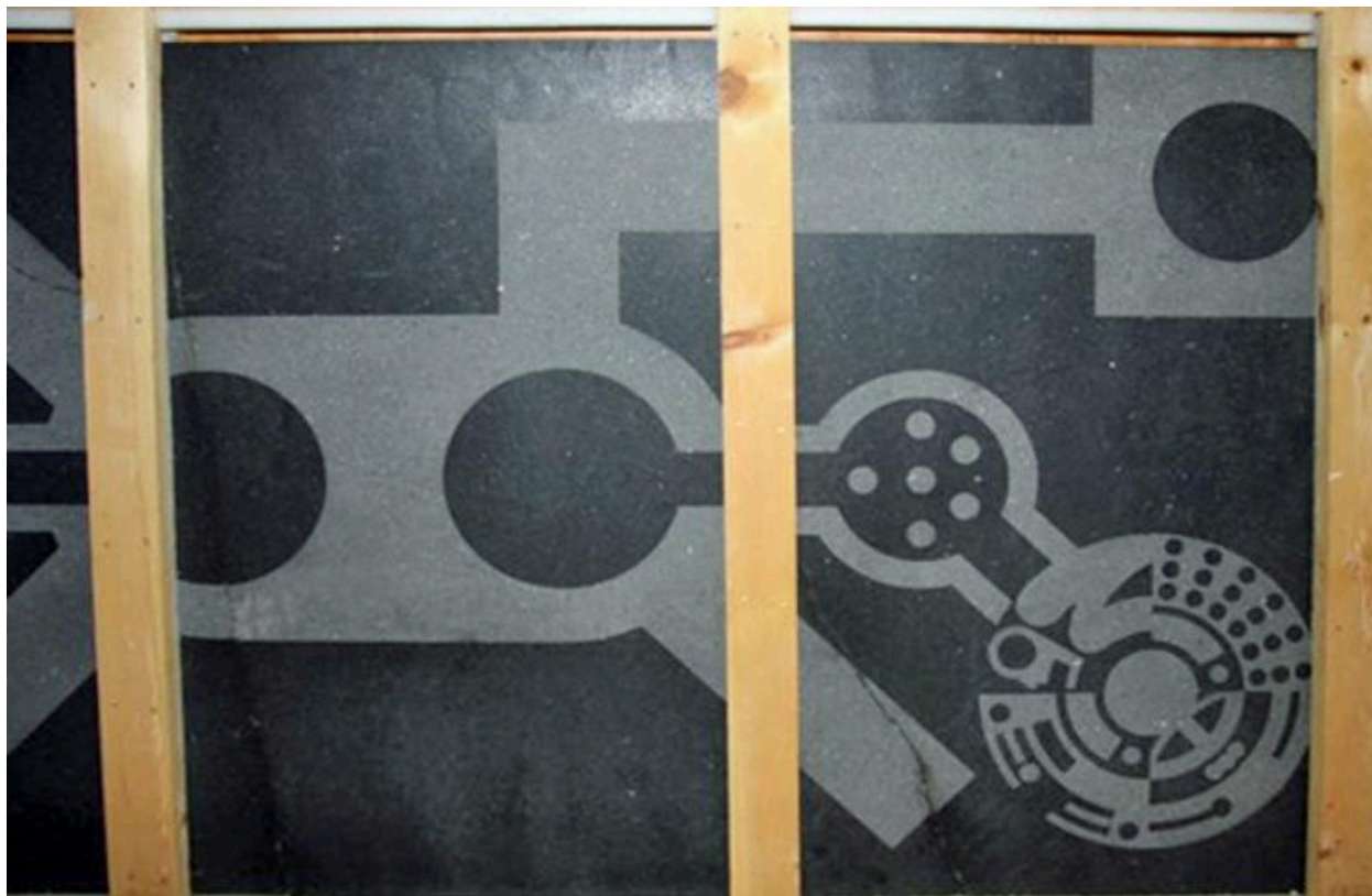
Vue de face (2009)