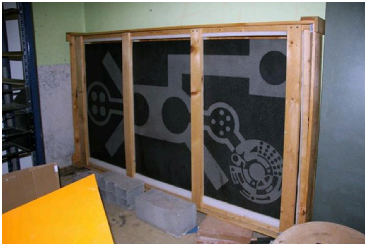
Vue générale (2009)