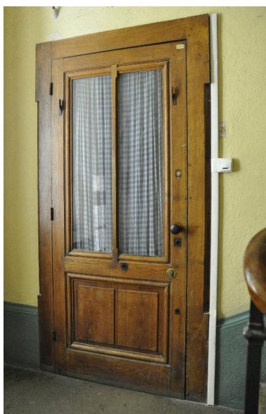
Vue intérieure : une porte palière IVR82_20156900967NUCA