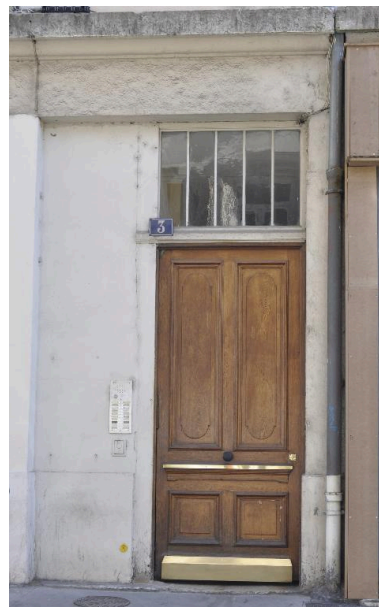
Vue rapprochée de la porte d'entrée