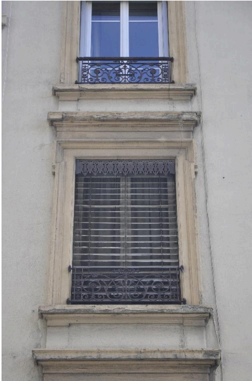
Vue rapprochée d'un encadrement de fenêtre