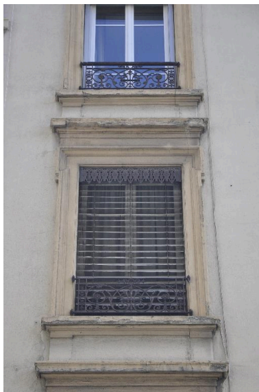
Vue rapprochée d'un encadrement de fenêtre IVR82_20156900965NUCA