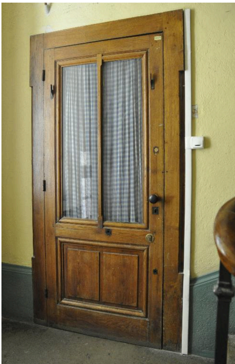
Vue intérieure : une porte palière