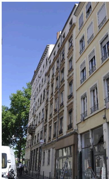
Vue générale de l'élévation sur rue IVR82_20156900963NUCA