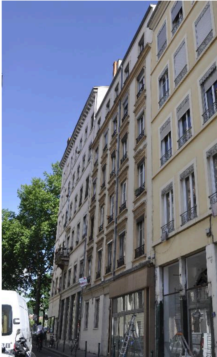
Vue générale de l'élévation sur rue