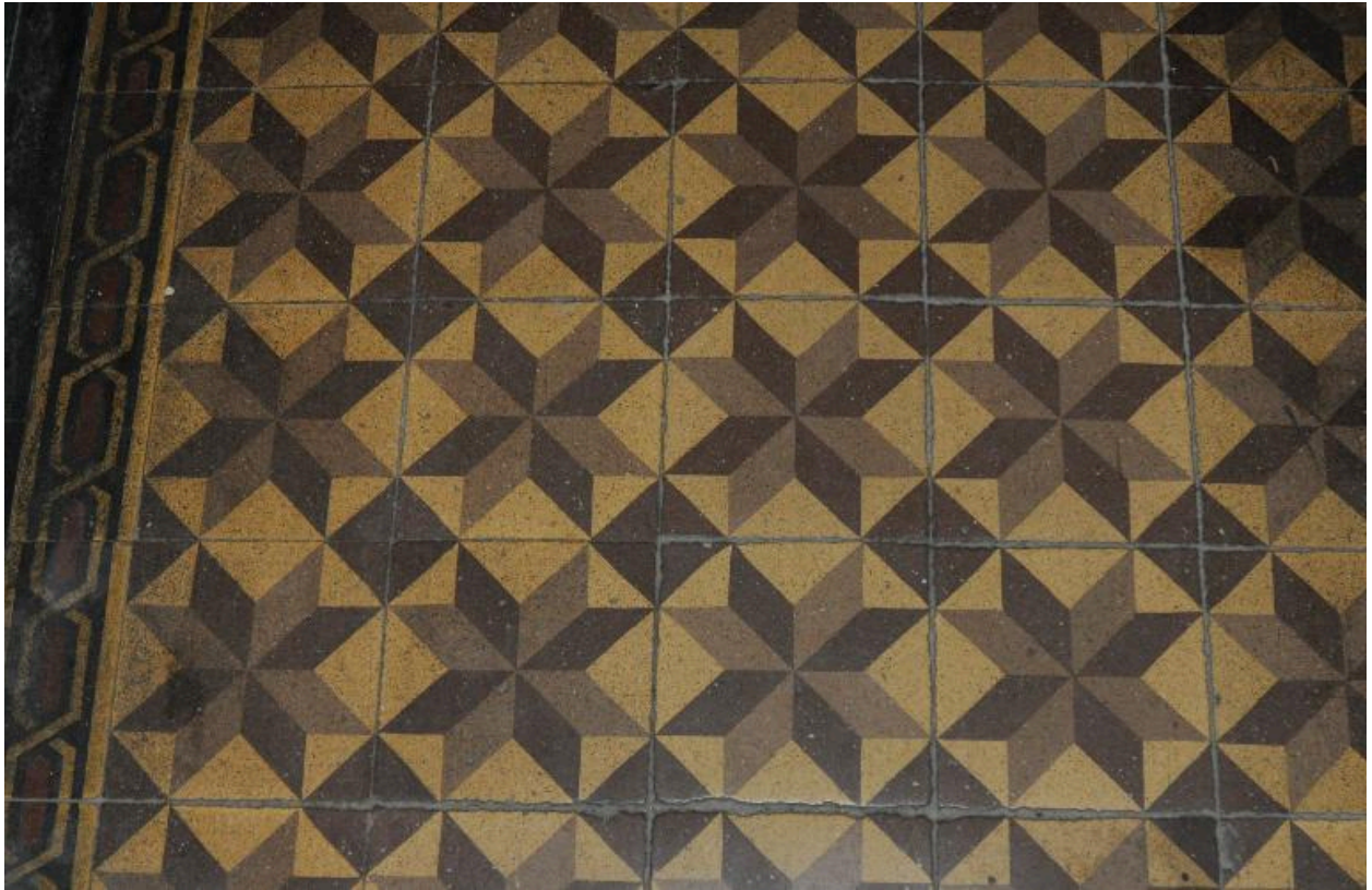
Vue intérieure : détail du pavement de l'allée en carreaux de ciment