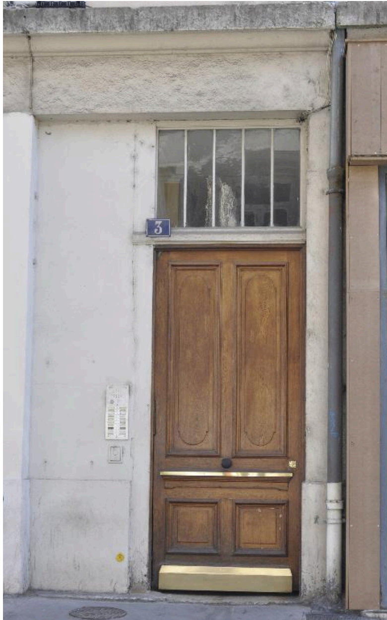
Vue rapprochée de la porte d'entrée