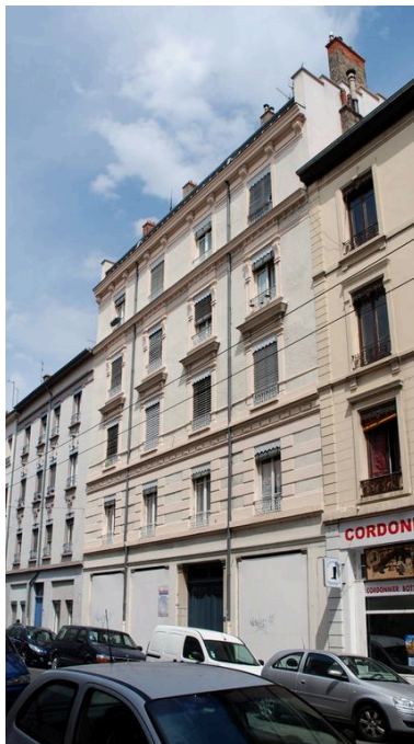
Élévation antérieure