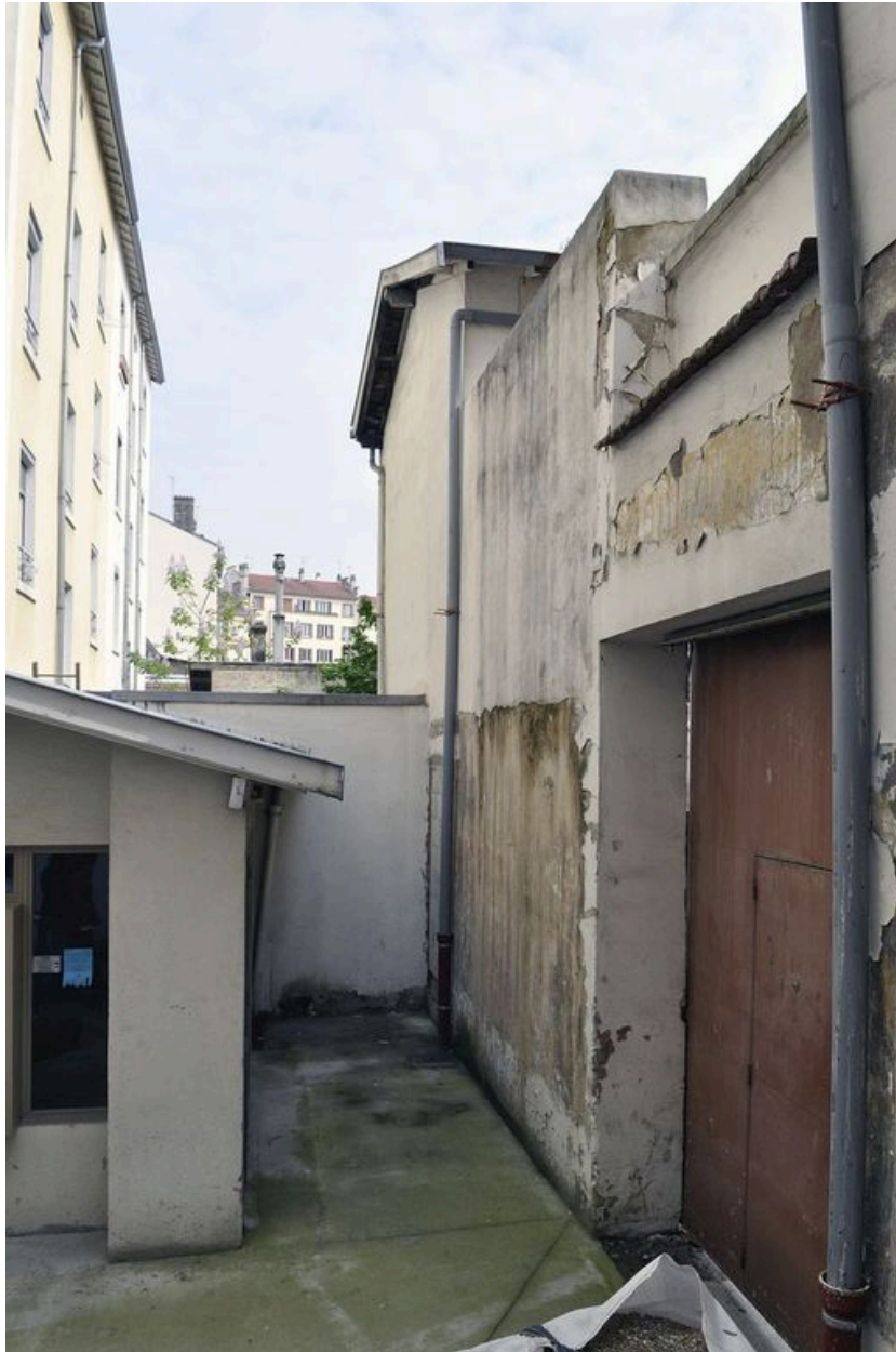
Vue de la cour