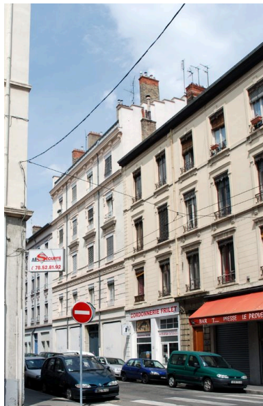
Vue générale IVR82_20096900772NUCA