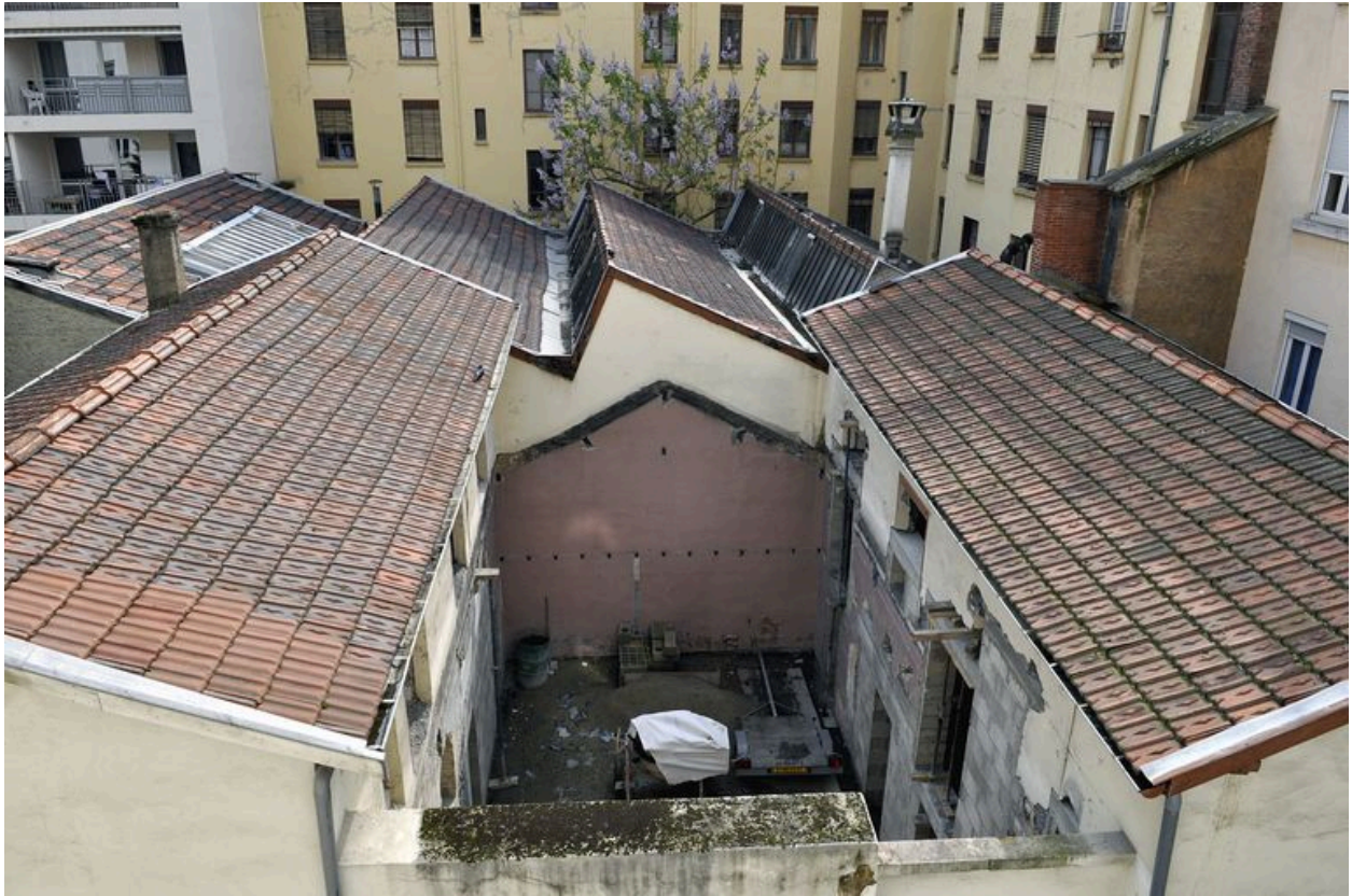
Bâtiments sur cours devant être démolis à moitié