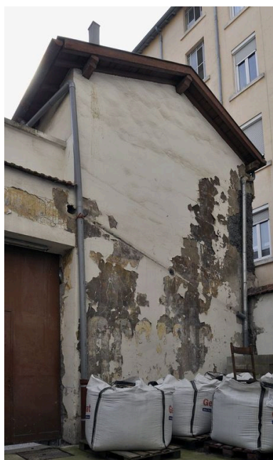
Bâtiment sur cour, à droite, devant être à moitié démolé.