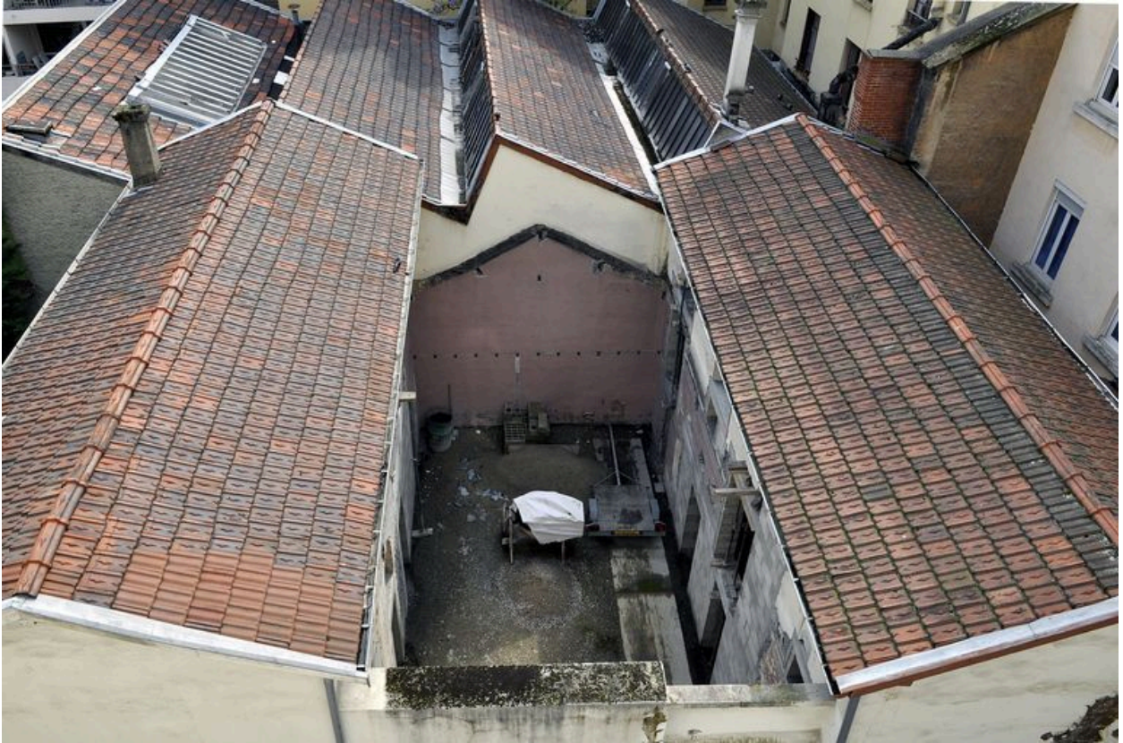
Bâtiment sur cour devant être démolis à moitié