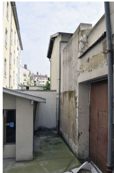
Vue de la cour IVR82_20106901001NUCA