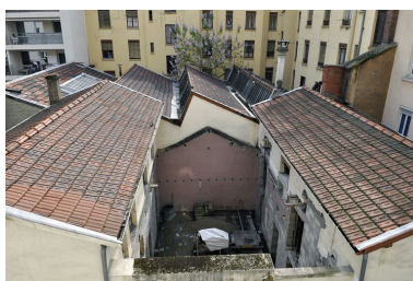
Bâtiments sur cours devant être démolis à moitié IVR82_20106901003NUCA