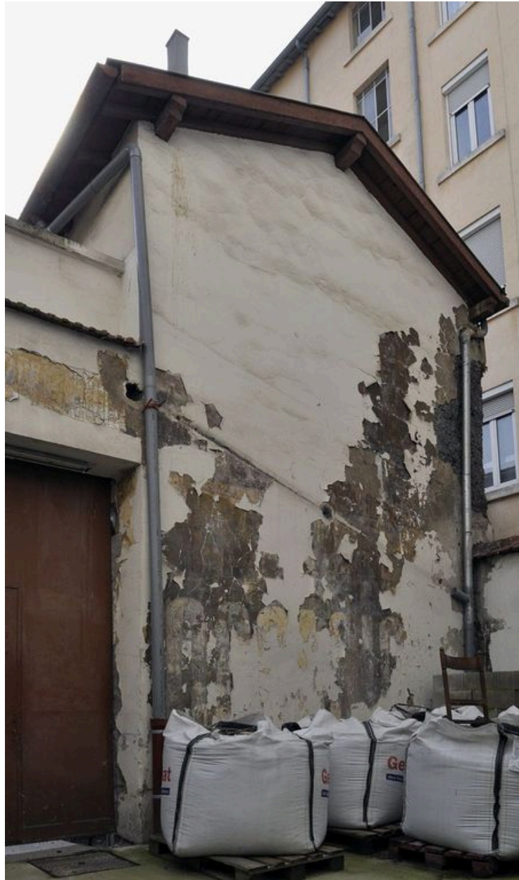
Bâtiment sur cour, à droite, devant être à moitié démoli.