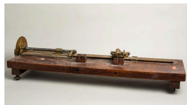
Instrument scientifique non identifié.