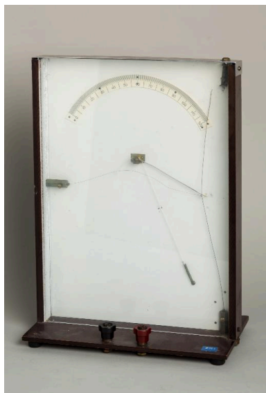
Instrument scientifique non identifié. IVR82_20134203946NUCA