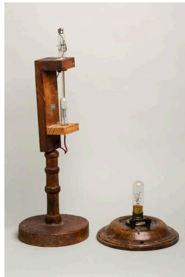
Instrument scientifique non identifié. Ampoule ?