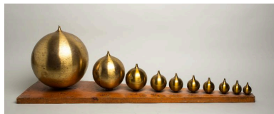
Échelle de résonateur de Helmholtz IVR82_20134203841NUCA