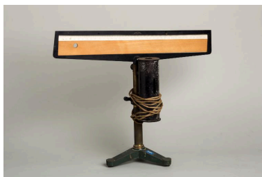
Instrument scientifique non identifié. IVR82_20134203947NUCA