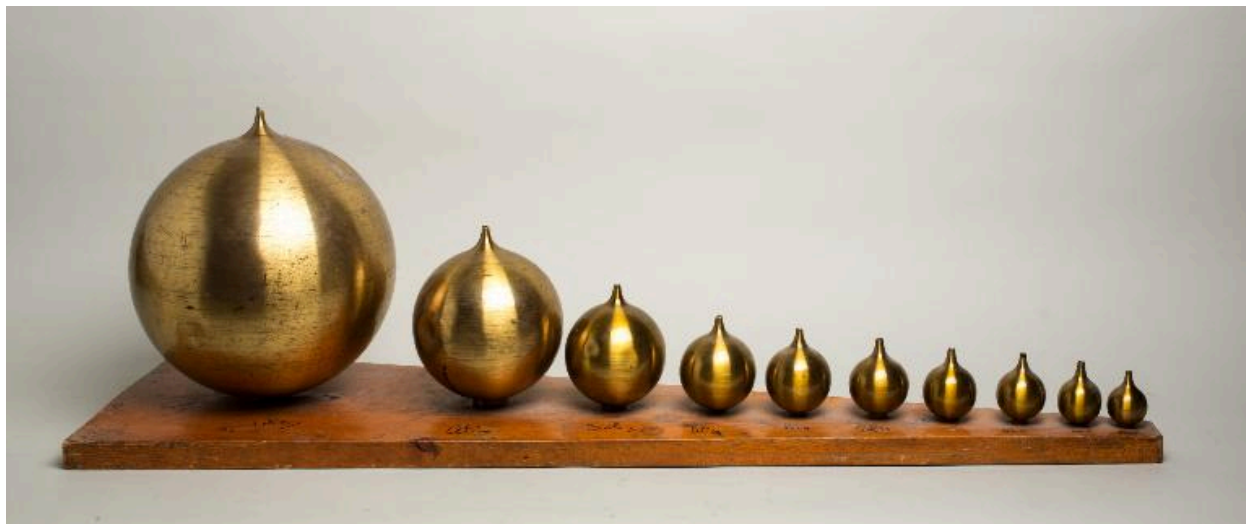
Échelle de résonateur de Helmholtz