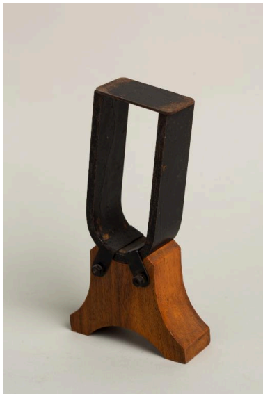
Instrument non identifié. Aimant ? IVR82_20134203939NUCA