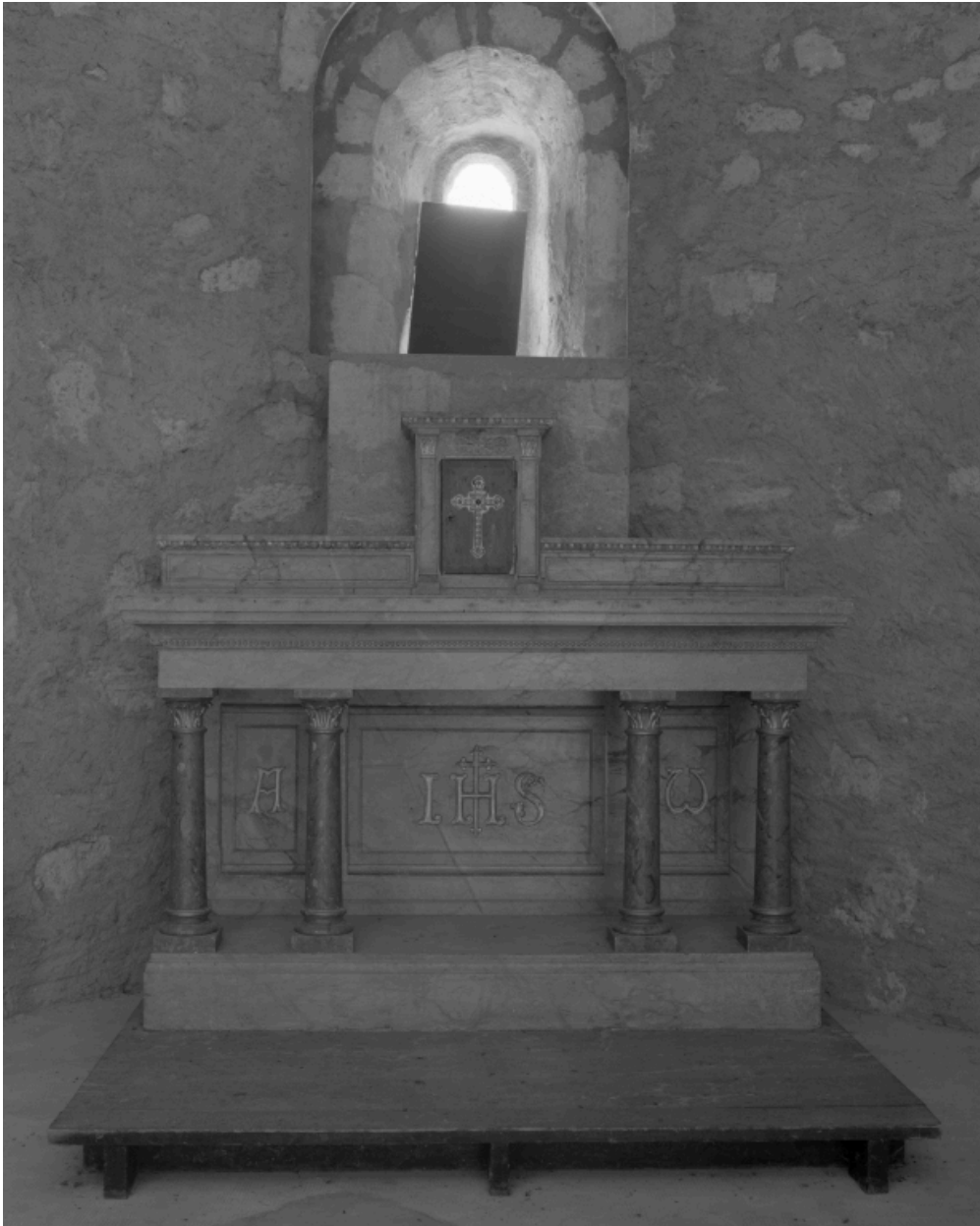
Maître-autel de la chapelle.