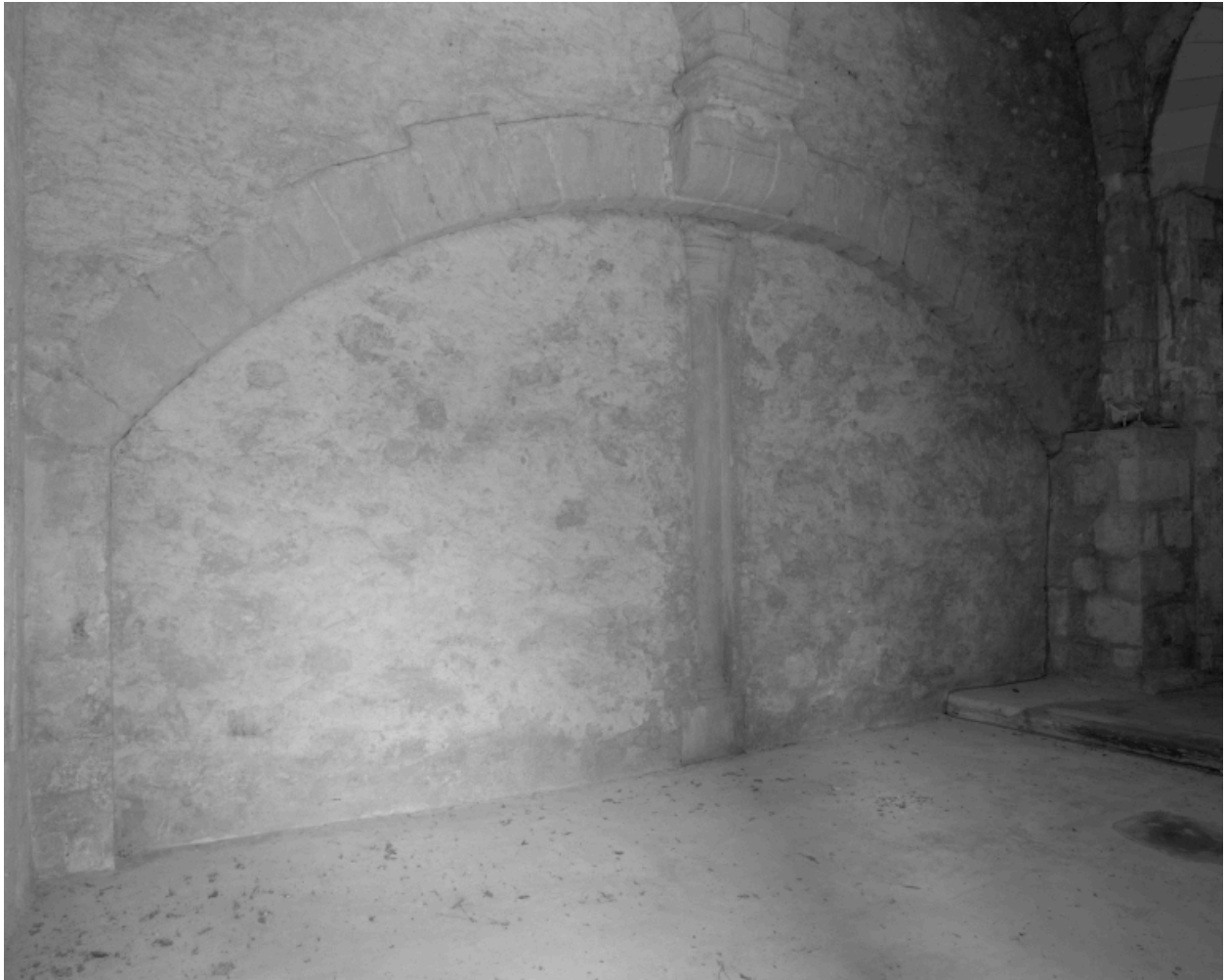
Élévation intérieure, mur nord : structure d'un arc de décharge latéral s'étendant sur deux travées.