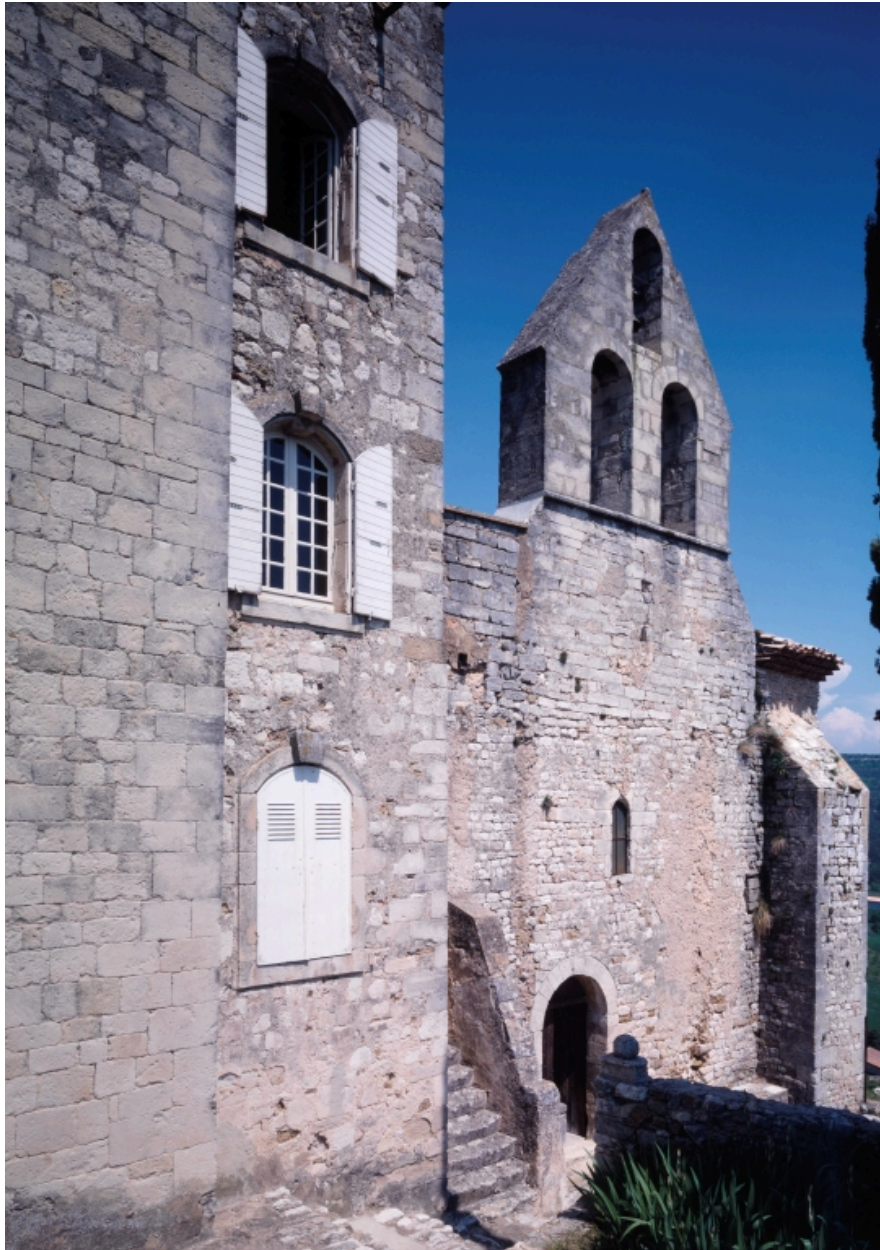
Vue de la façade principale de la chapelle, au sud, et vue partielle de l'élévation latérale du donjon médiéval avec le rajout du XVIIIe siècle.