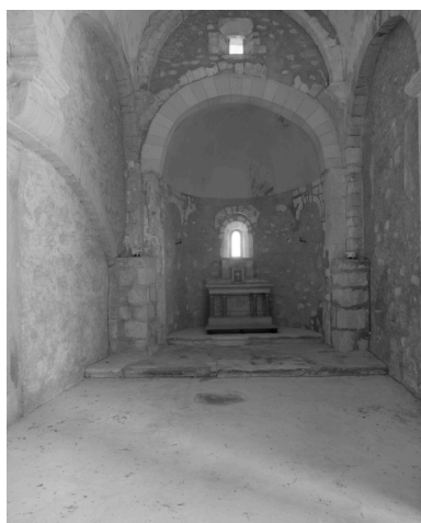
Vue de l'intérieur : abside et vue partielle de la nef. IVR82_20002600300X