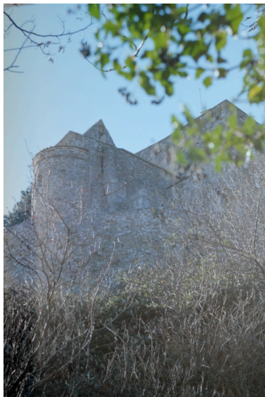
Vue extérieure prise du nord-est. IVR82_20052600004ZE