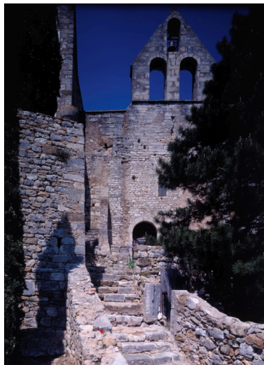
Elévation principale de la chapelle (latérale sud), avec l'escalier menant anciennement à la tribune. Vue depuis le chemin de ronde.