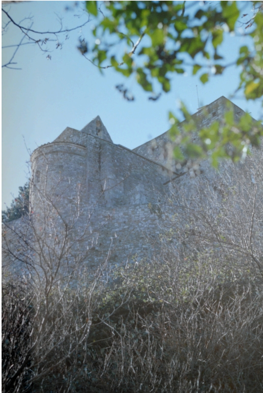
Vue extérieure prise du nord-est.