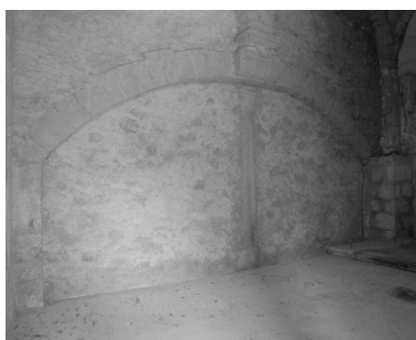
Elévation intérieure, mur nord : structure d'un arc de décharge latéral s'étendant sur deux travées.