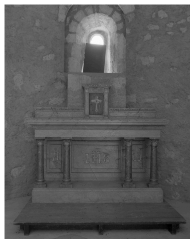
Maître-autel de la chapelle.