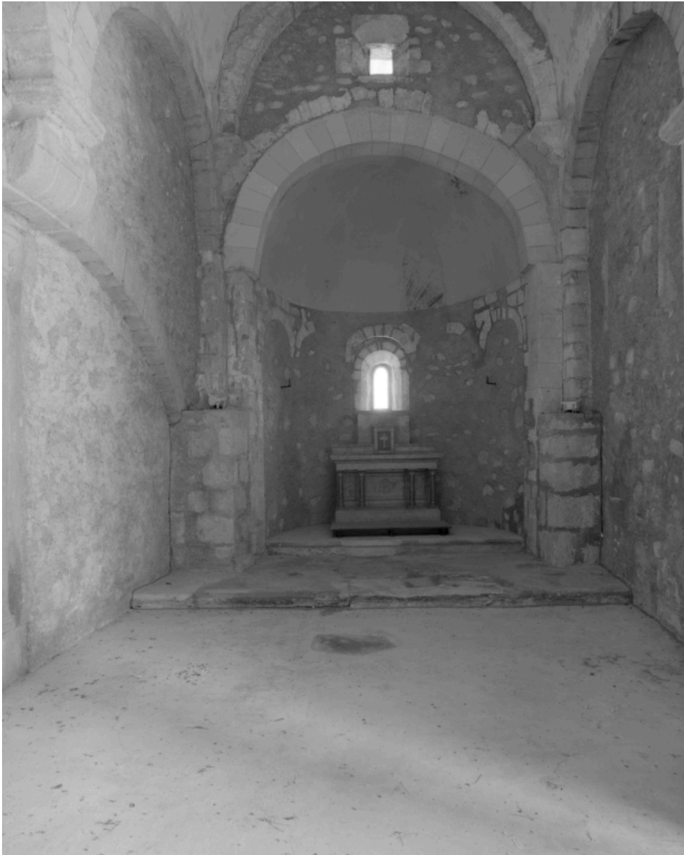
Vue de l'intérieur : abside et vue partielle de la nef.