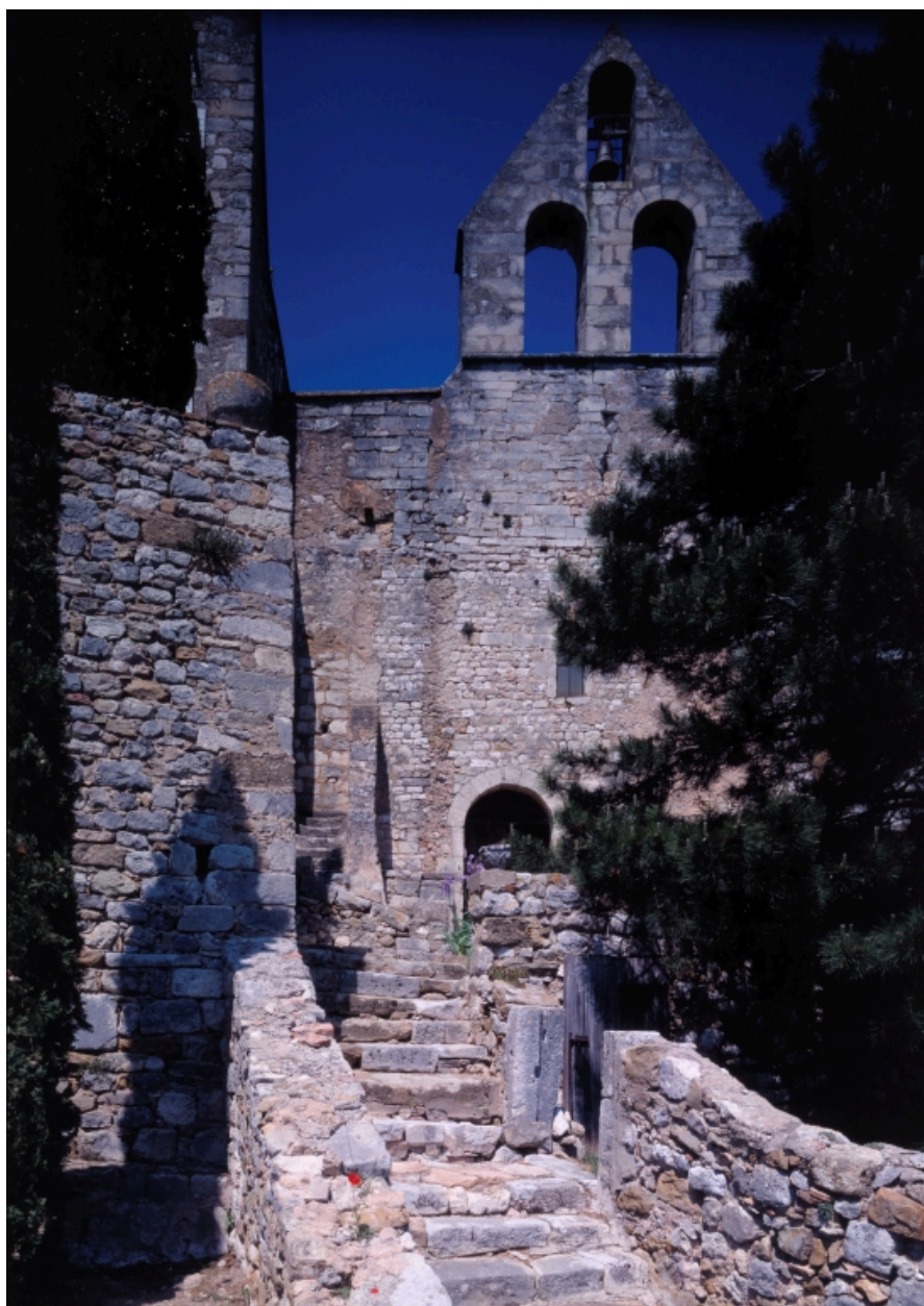
Elévation principale de la chapelle (latérale sud), avec l'escalier menant anciennement à la tribune. Vue depuis le chemin de ronde.