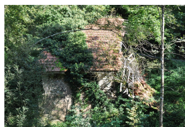
Vue ouest du moulin IVR82_20107300745NUCA