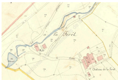
Premier cadastre français, 1923. Cadastre de 1923 AD Savoie. 3P 7246 IVR82_20107300741NUCA