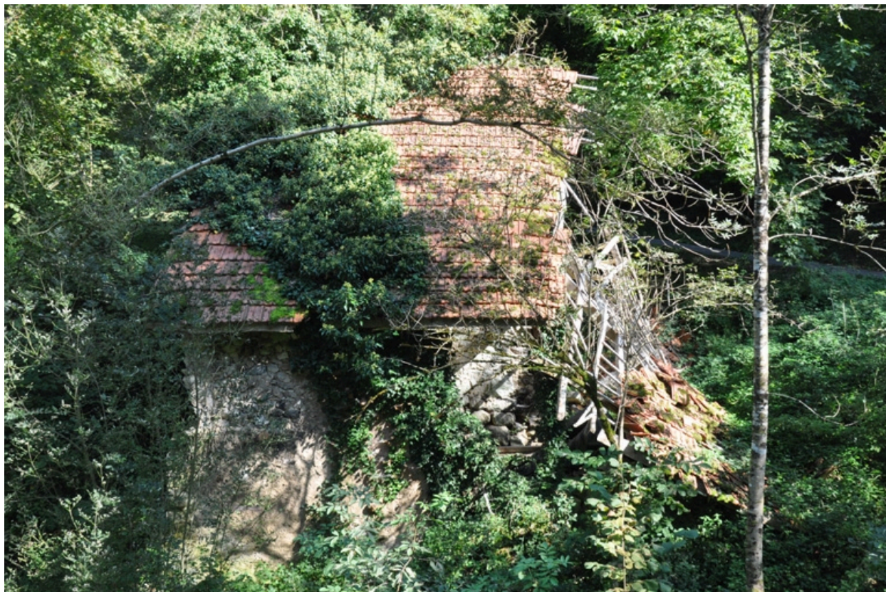
Vue ouest du moulin