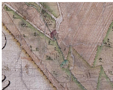
Cadastre de 1732. Cadastre de 1728 AD Savoie. C 4051 IVR82_20107300740NUCA