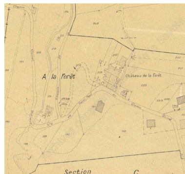
Cadastre rénové, 1937-1988. Cadastre de 1937-1988 AD Savoie. 3P 7247 IVR82_20107300742NUCA