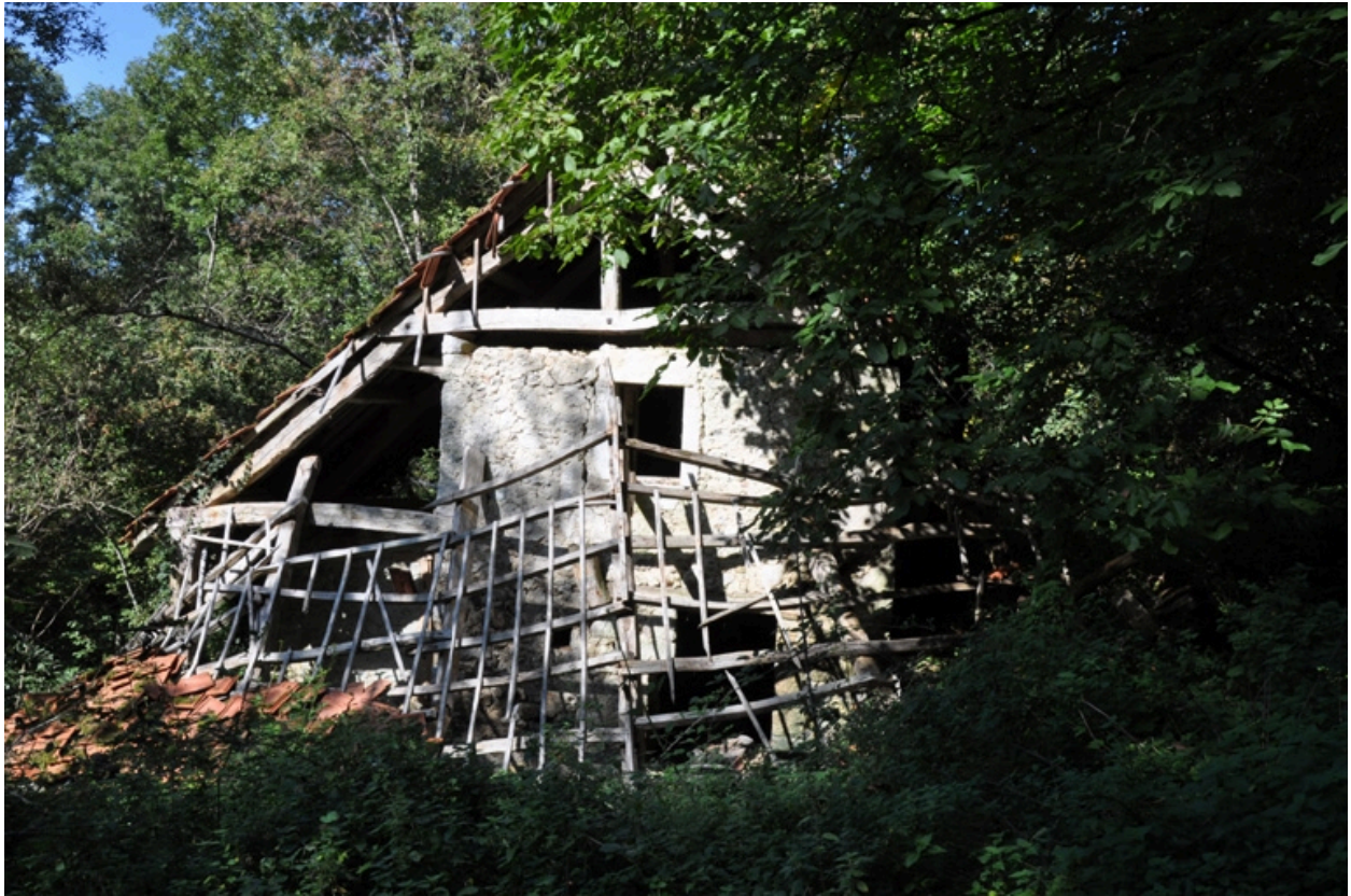
Vue générale du moulin