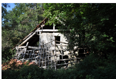
Vue générale du moulin IVR82_20107300744NUCA