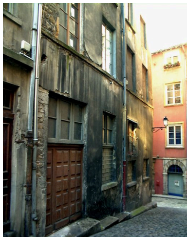
Elévation ouest, rez-de-chaussée IVR82_20006900172NUCA