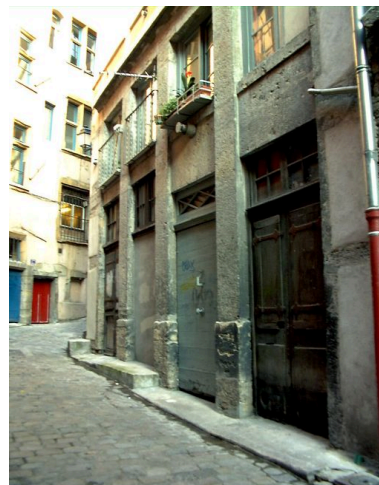
Elévation sud IVR82_20006900174NUCA