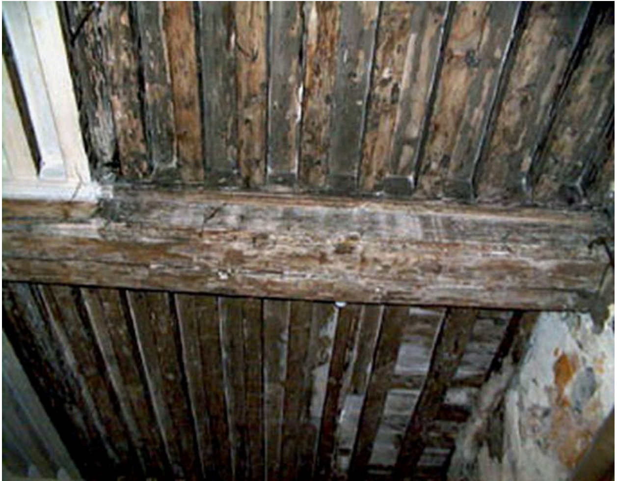
Plafond du rez-de-chaussée du corps de bâtiment ouest