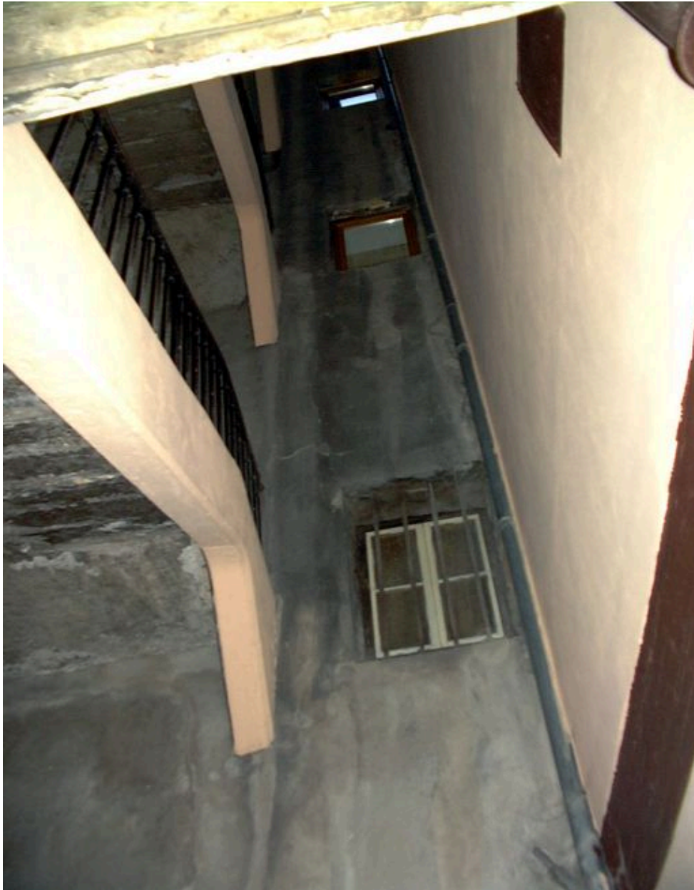
Escalier commun aux 12 rue Ferrachat et 9 rue Bellièvre, élévation sur cour du corps de bâtiment est