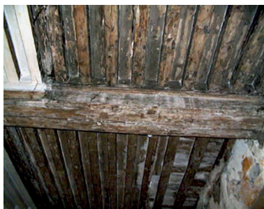
Plafond du rez-de-chaussée du corps de bâtiment ouest IVR82_20006900184NUCA