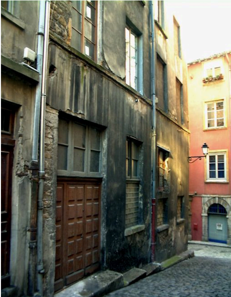
Elévation ouest, rez-de-chaussée