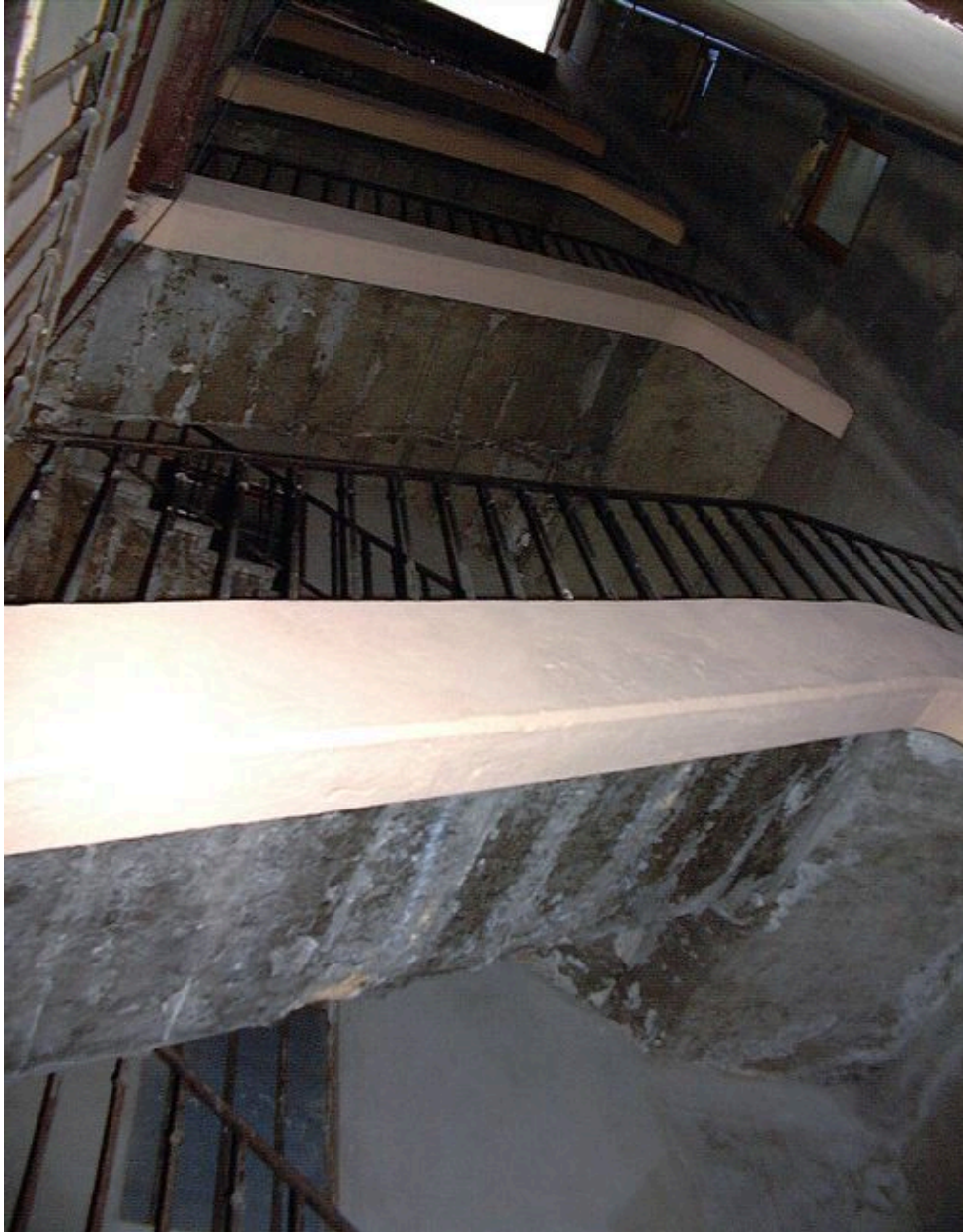
Escalier commun aux 12 rue Ferrachat et 9 rue Bellière