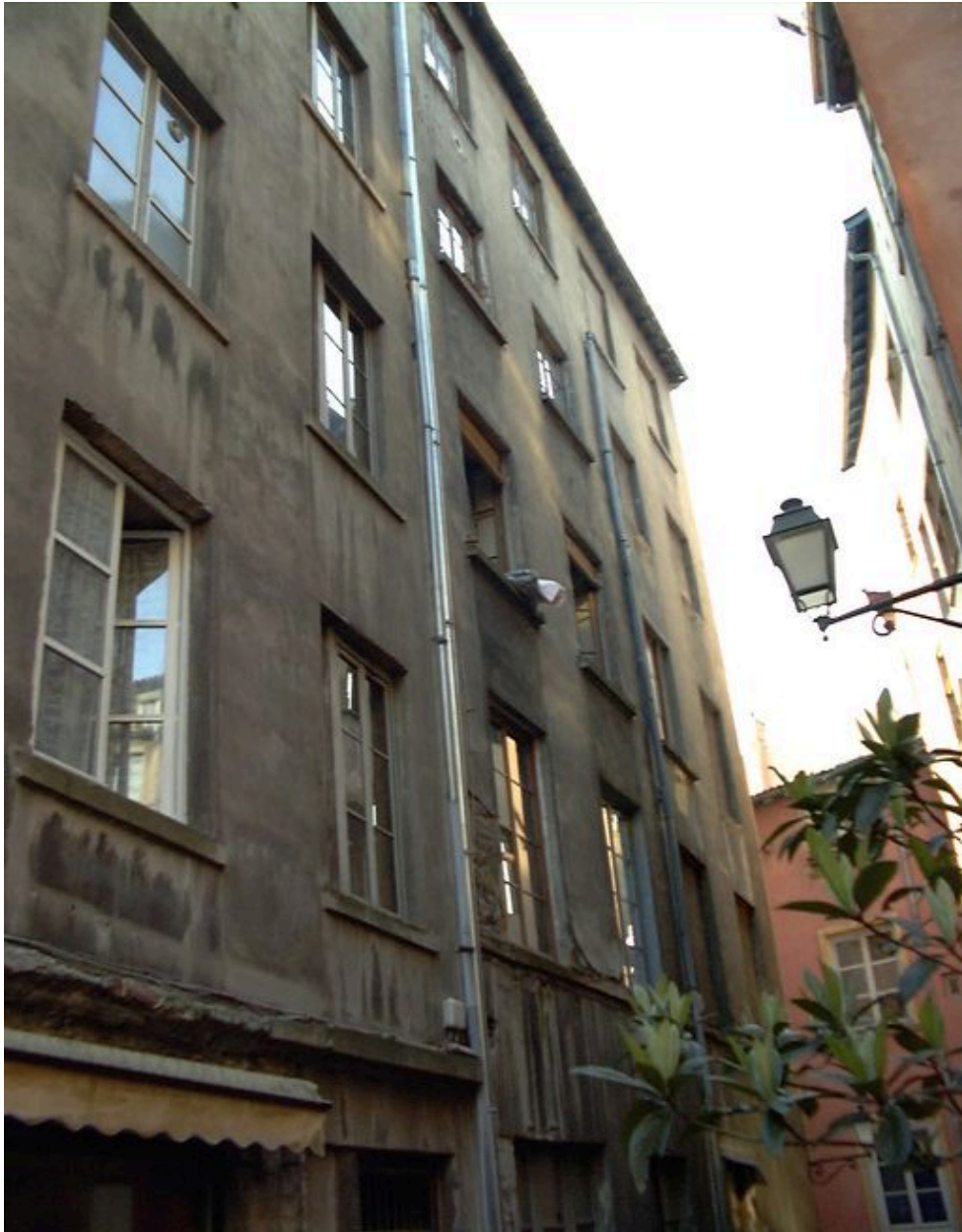
Elévation ouest, les étages