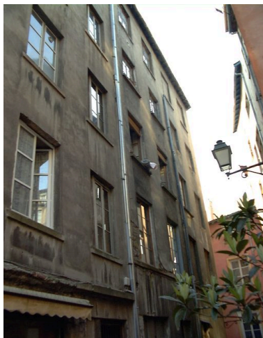
Elévation ouest, les étages IVR82_20006900173NUCA