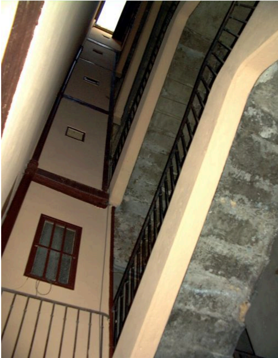
Vue de l'escalier commun aux 12 rue Ferrachat et 9 rue Bellière, élévation sur cour du corps de bâtiment ouest