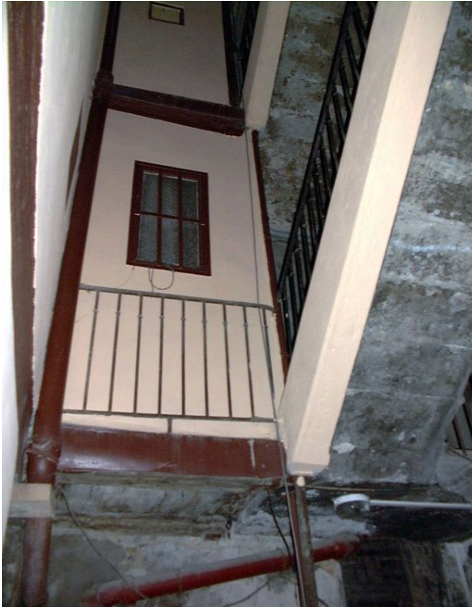
Détail de l'ancienne coursière reliant l'escalier au corps de bâtiment sud