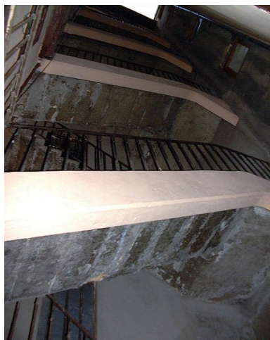
Escalier commun aux 12 rue Ferrachat et 9 rue Bellière IVR82_20006900160NUCA