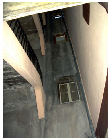
Escalier commun aux 12 rue Ferrachat et 9 rue Bellière, élévation sur cour du corps de bâtiment est IVR82_20006900162NUCA