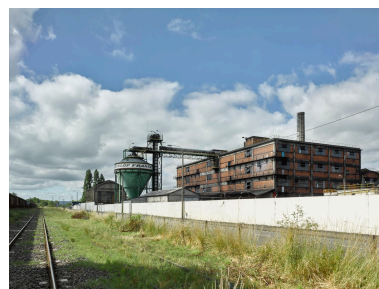
Vue d'ensemble IVR84_20160300255NUCA