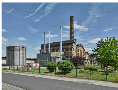
Vue d'ensemble du site IVR84_20160300257NUCA