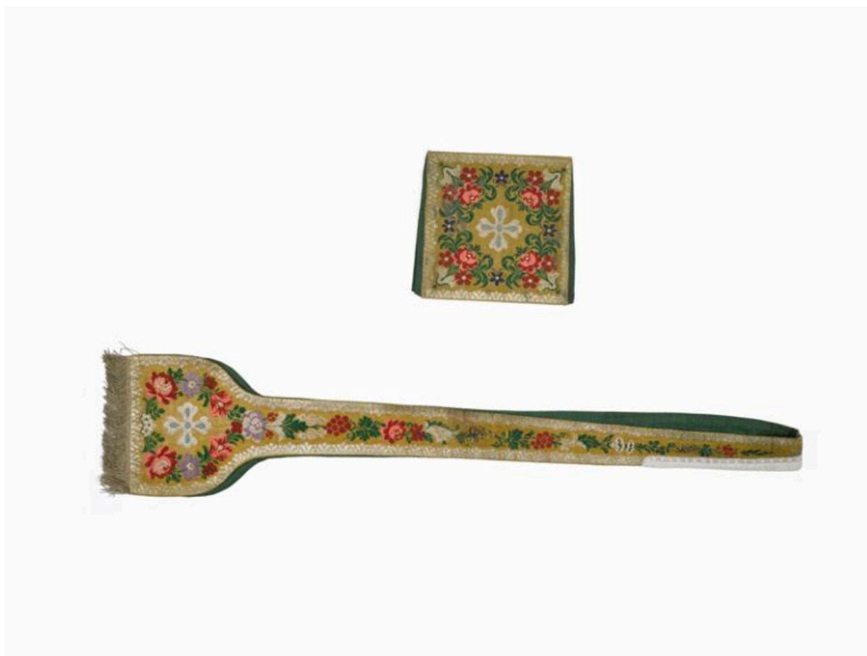
Vue de l'étole et de la bourse de corporal