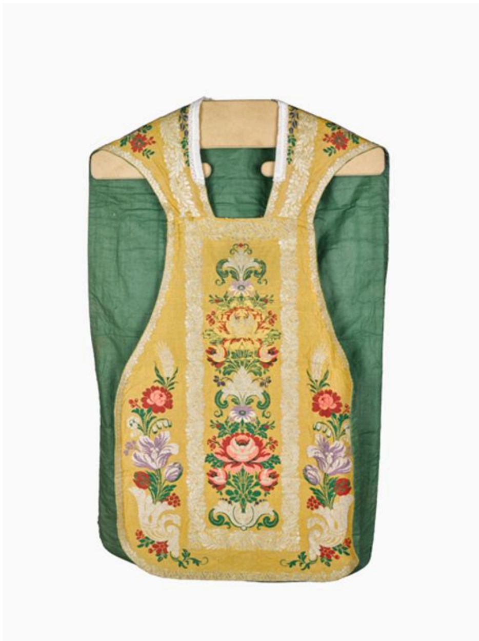
Vue du devant de la chasuble