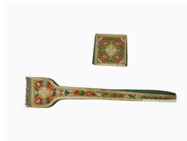
Vue de l'étole et de la bourse de corporal IVR84_20181500005NUC4A