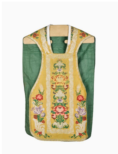
Vue du devant de la chasuble IVR84_20181500001NUC4A