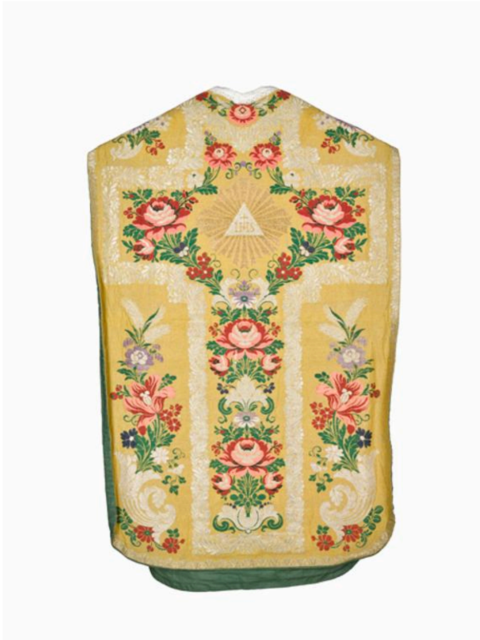
vue général du dos de la chasuble