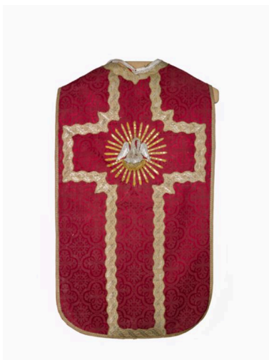
Vue du dos de la chasuble IVR84_20166300194NUC4A