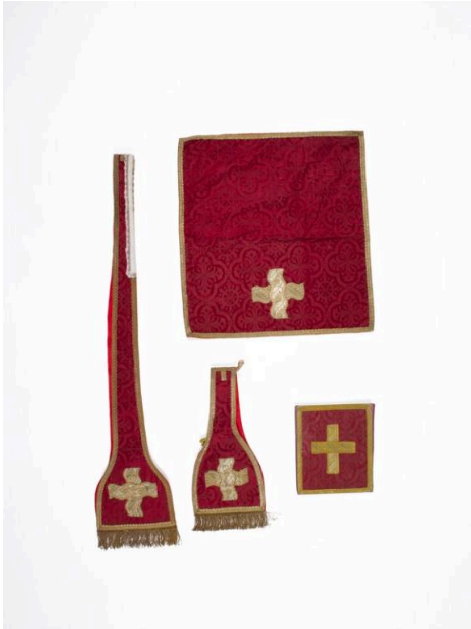
Vue générale de l'étole, du manipule, du voile de calice et de la bourse de corporal