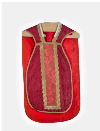
Vue générale du devant de la chasuble IVR84_20166300193NUC4A