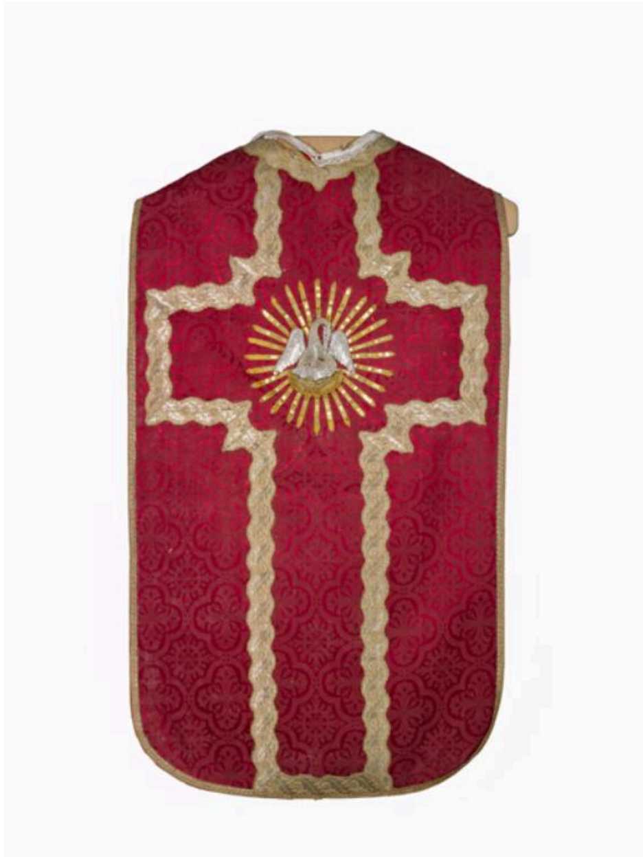
Vue du dos de la chasuble