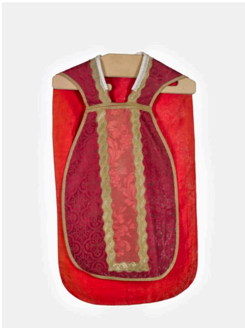
Vue générale du devant de la chasuble