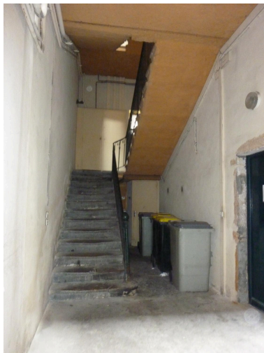
Vue de l'escalier