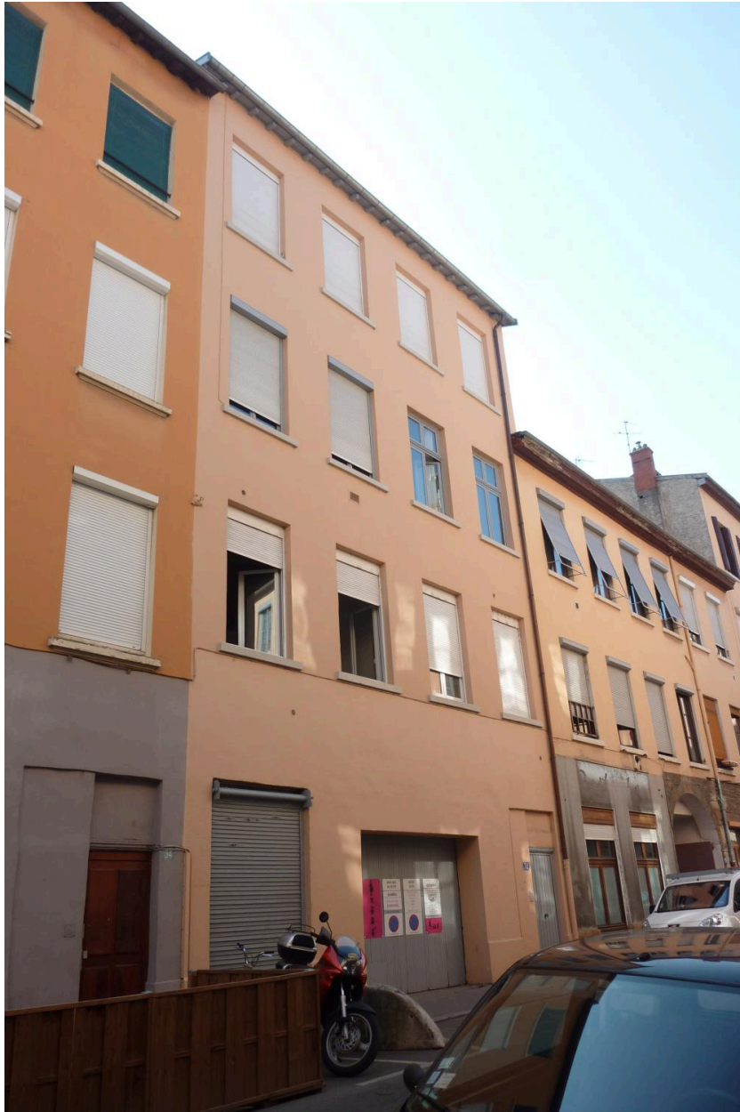
Vue principale de l'immeuble du 32 rue du Mail