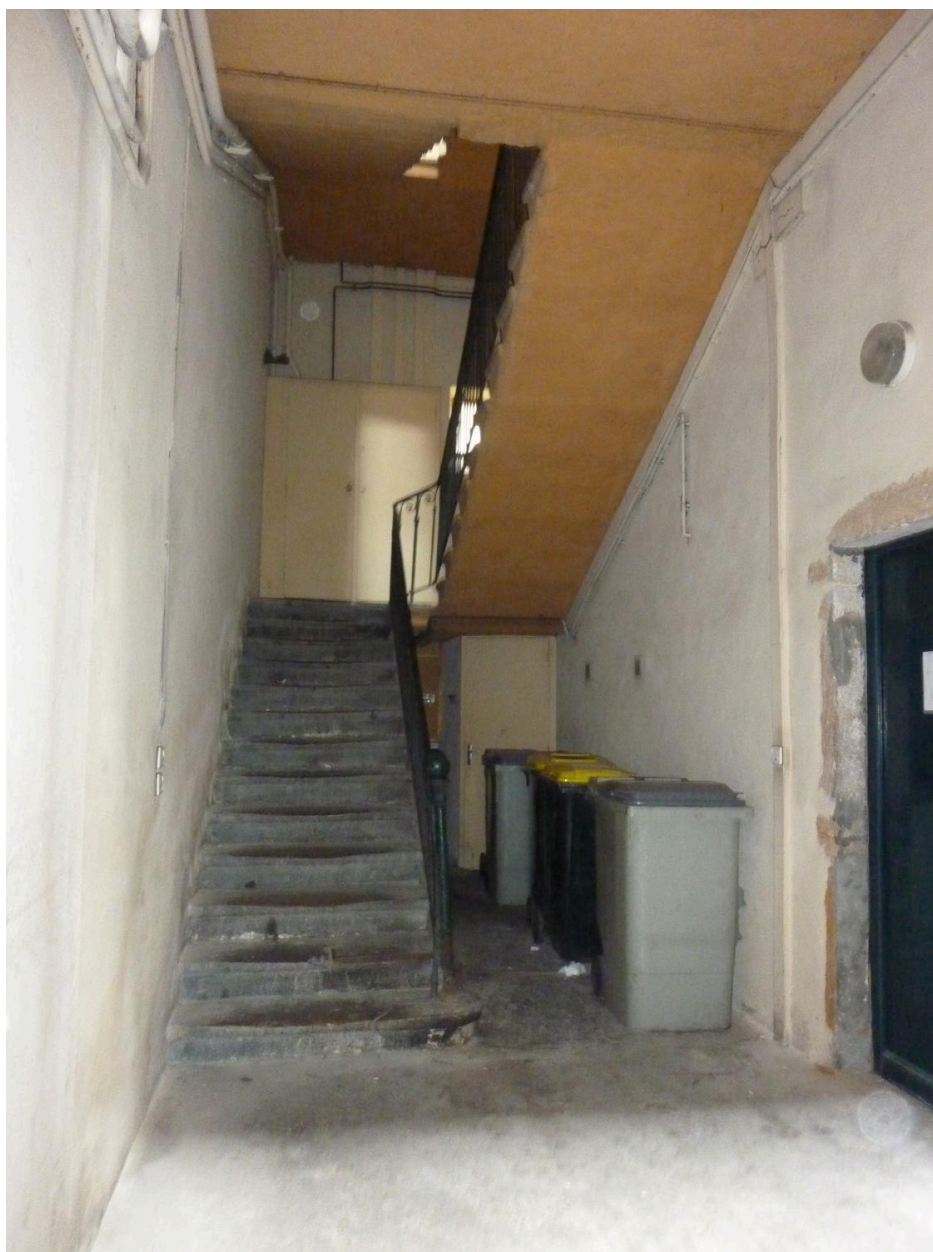
Vue de l'escalier