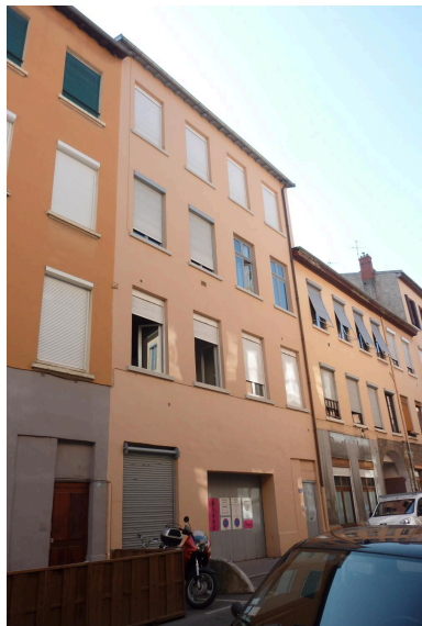
Vue principale de l'immeuble du 32 rue du Mail IVR84_20186901265NUCA