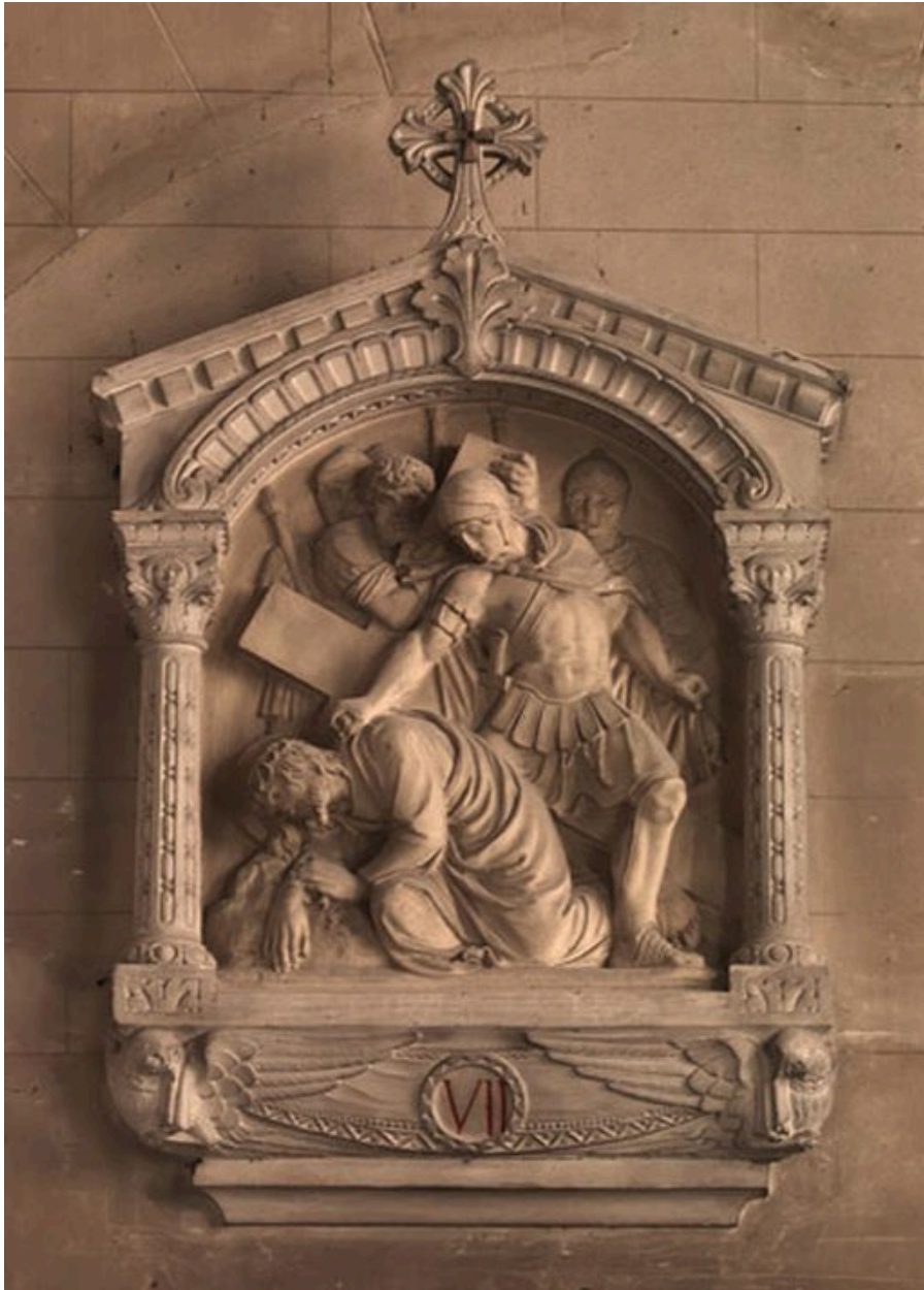
Vue générale de la station VII : Jésus tombe pour la deuxième fois.