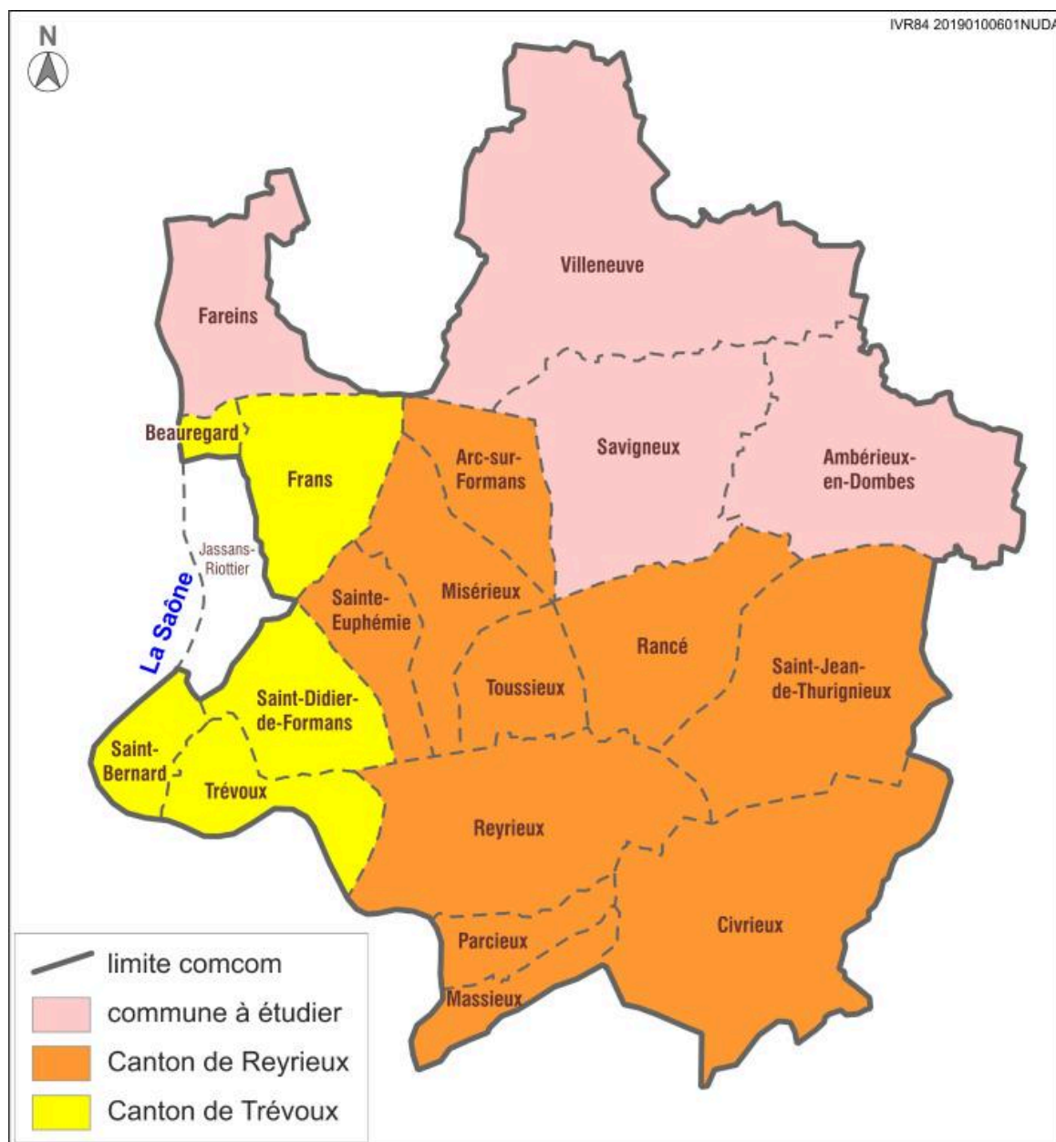
Carte du territoire, montrant les communes concernées par l'étude complémentaire en rose