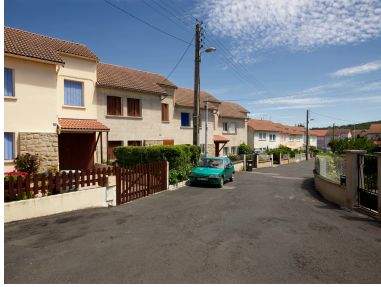
La rue Marcel-Michelin vue depuis le nord.