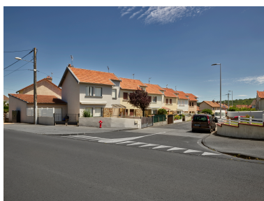
La cité côté nord vue depuis la rue de Roche-Genès, au carrefour avec la rue Roger-Astier. IVR84_20206300925NUC4A