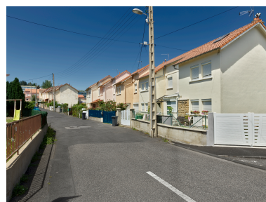
La rue Marcel-Michelin vue depuis le sud-est.