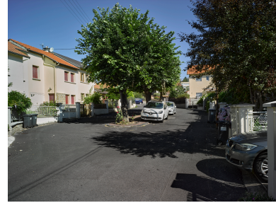
Rue du Huit-Mai, partie nord : terre-plein central planté d'arbres, bordé de maisons de la cité.