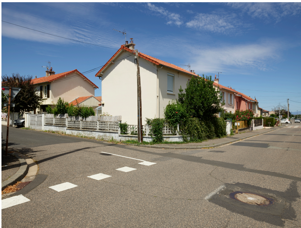
La cité depuis l'angle des rues du Huit-Mai et du Docteur-Casati.