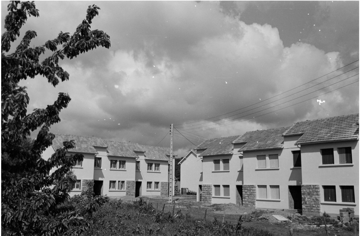
Maisons mitoyennes à décrochements. Photographie prise vraisemblablement au début des années 1960.