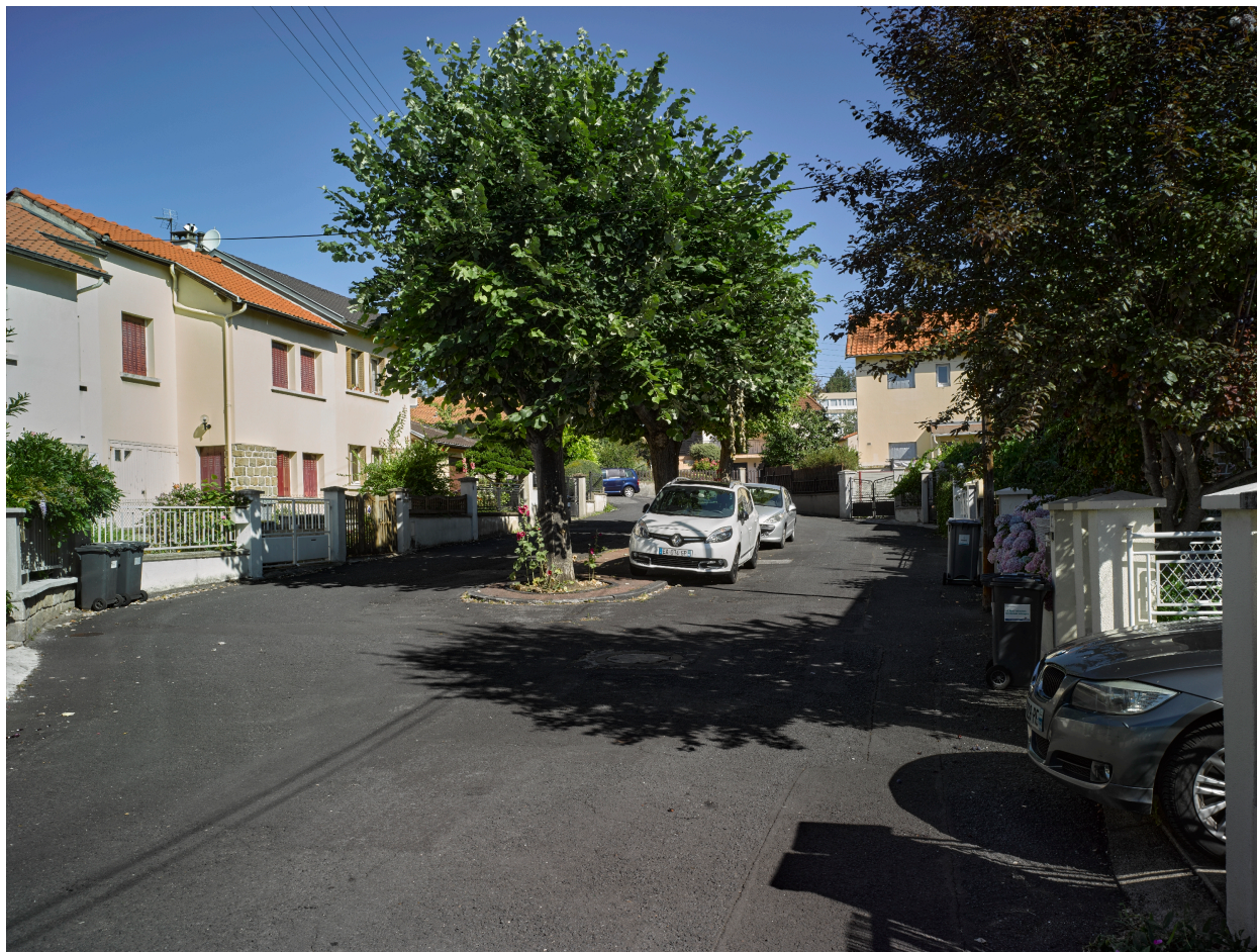
Rue du Huit-Mai, partie nord : terre-plein central planté d'arbres, bordé de maisons de la cité.