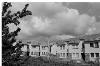
Maisons mitoyennes à décrochements. Photographie prise vraisemblablement au début des années 1960. IVR84_20236300159NUC