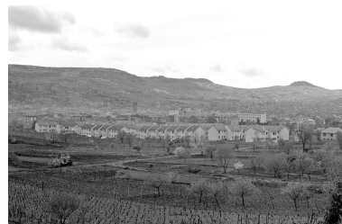
Vue d'ensemble, probablement prise peu après la construction de la cité, vers 1959-1960; IVR84_20236300152NUC