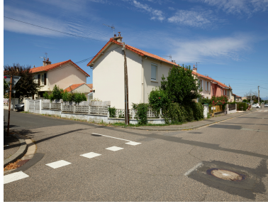
La cité depuis l'angle des rues du Huit-Mai et du Docteur-Casati. IVR84_20206300928NUC4A