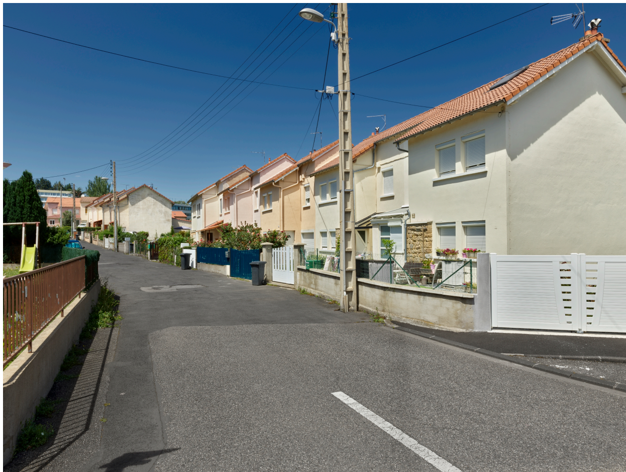
La rue Marcel-Michelin vue depuis le sud-est.