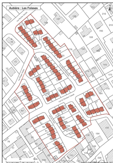
Plan des différents bâtiments d'origine de la cité. IVR84_20216301283NUDA