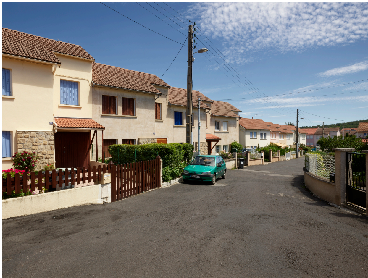
La rue Marcel-Michelin vue depuis le nord.