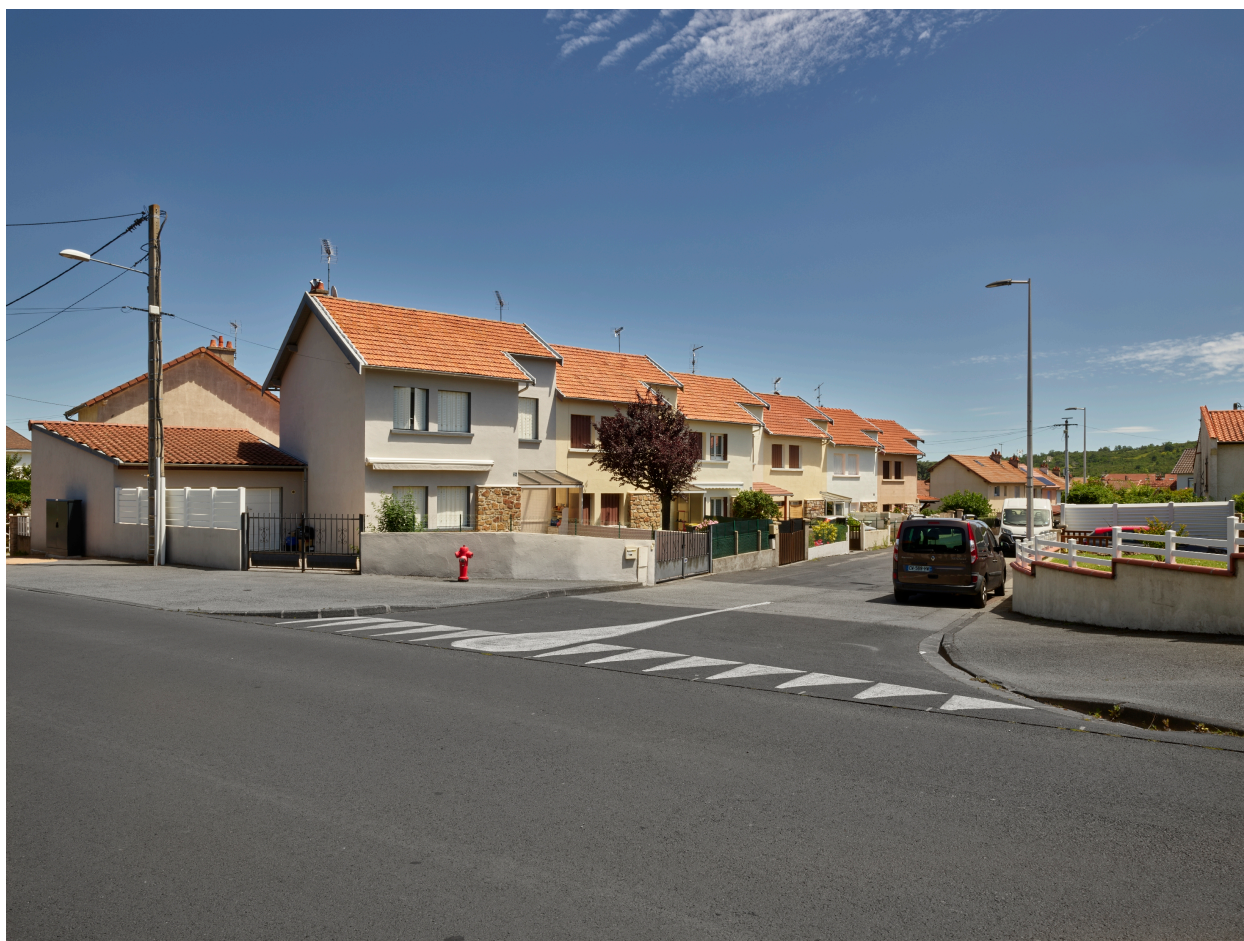
La cité côté nord vue depuis la rue de Roche-Genès, au carrefour avec la rue Roger-Astier.