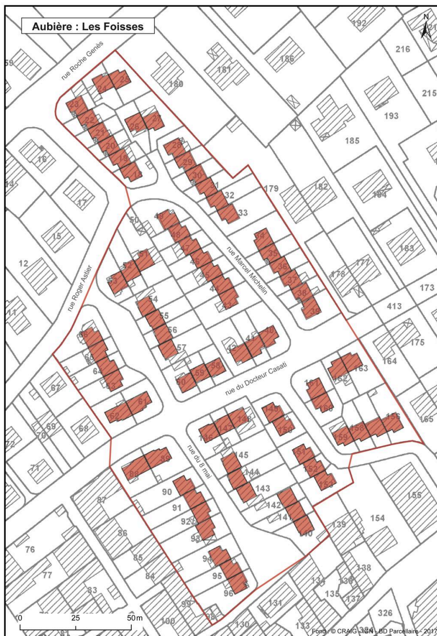
Plan des différents bâtiments d'origine de la cité.