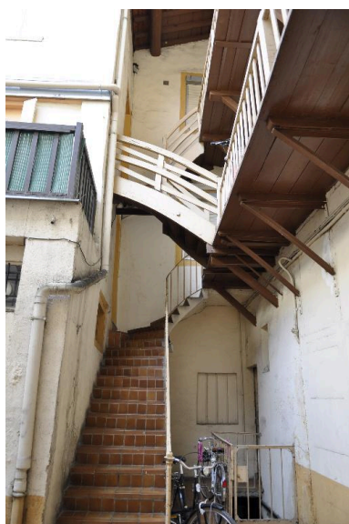
Cour : escalier reliant les deux bâtiments et coursives en bois sur la façade postérieure du bâtiment sur rue IVR84_20176900990NUCA