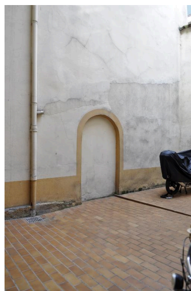
Cour : ancienne porte de communication avec le 50 rue d'Anvers