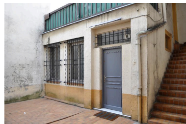
Bâtiment sur cour, extension plus récente en rez-de-chaussée IVR84_20176900989NUCA