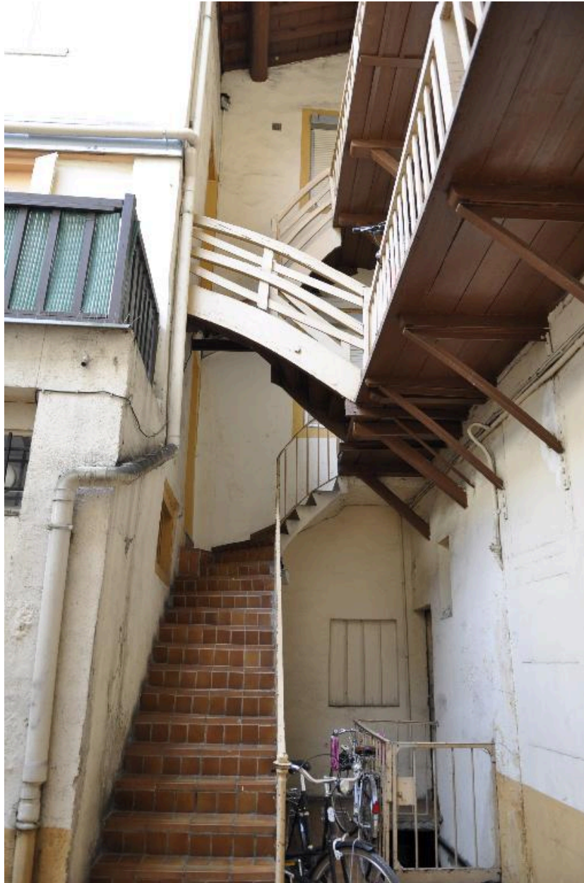
Cour : escalier reliant les deux bâtiments et coursières en bois sur la façade postérieure du bâtiment sur rue