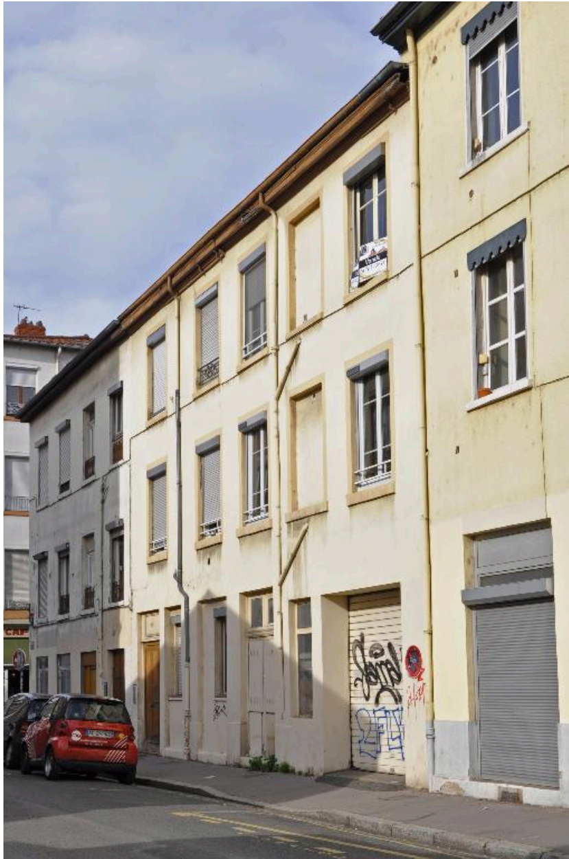
Bâtiment sur rue, élévation antérieure