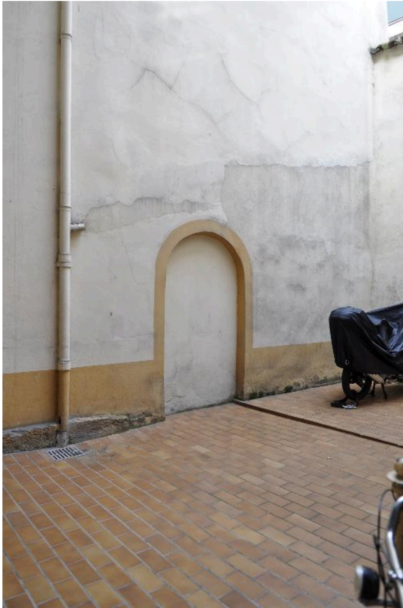
Cour : ancienne porte de communication avec le 50 rue d'Anvers