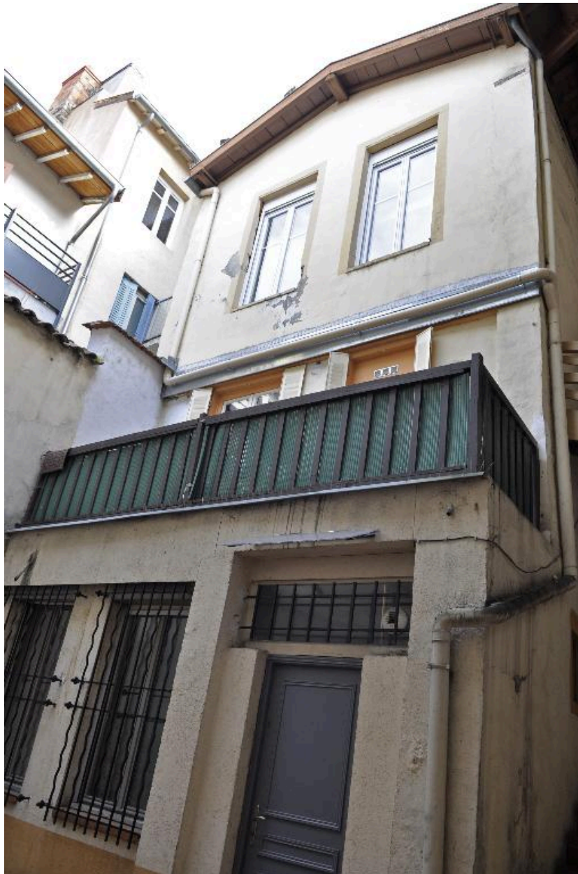
Bâtiment sur cour, vue générale