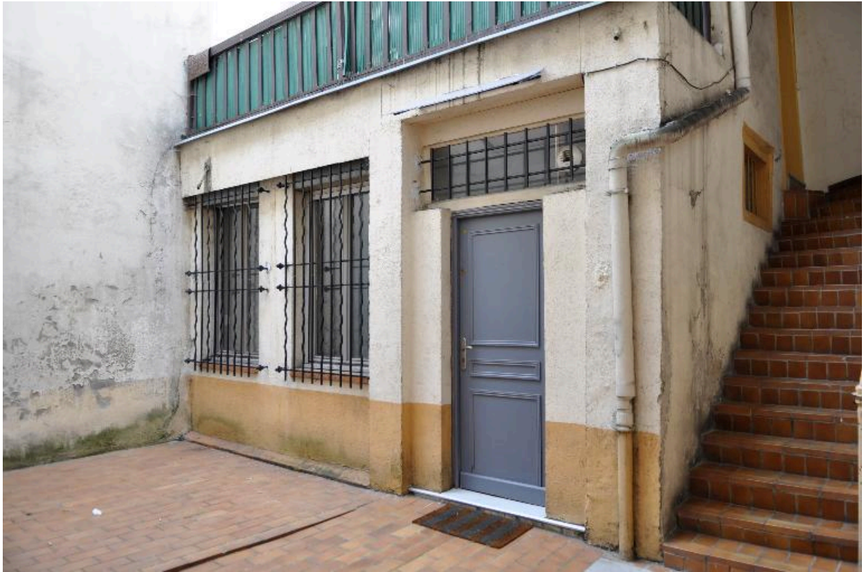
Bâtiment sur cour, extension plus récente en rez-de-chaussée