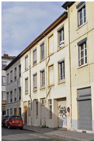
Bâtiment sur rue, élévation antérieure IVR84_20176900987NUCA