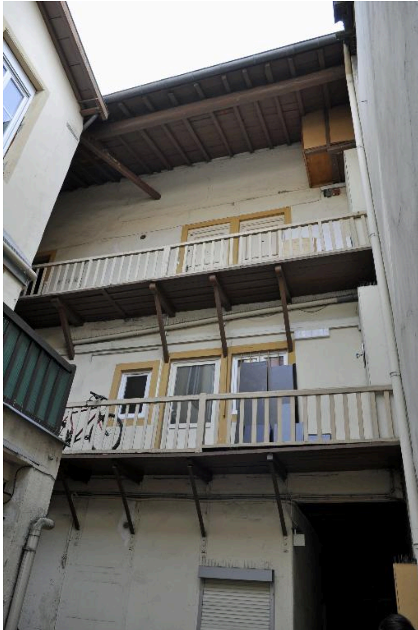
Bâtiment sur rue, vue rapprochée des coursières