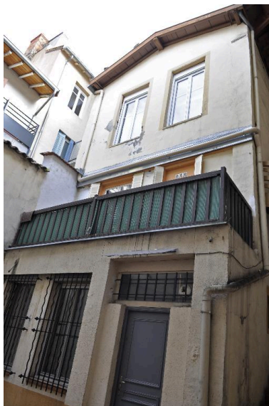
Bâtiment sur cour, vue générale IVR84_20176900988NUCA