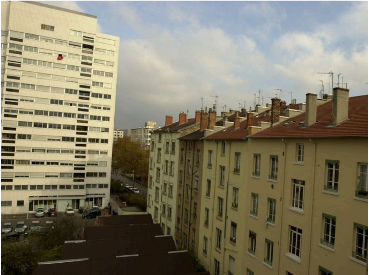
Vue de la façade postérieure depuis le sud-ouest