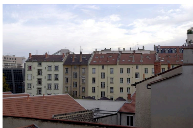
Elévation postérieure IVR82_20086900643NUCA