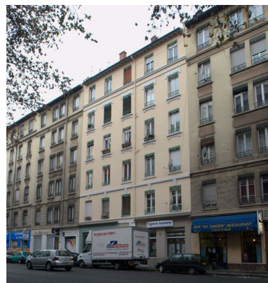
Elévation principale depuis le nord-est