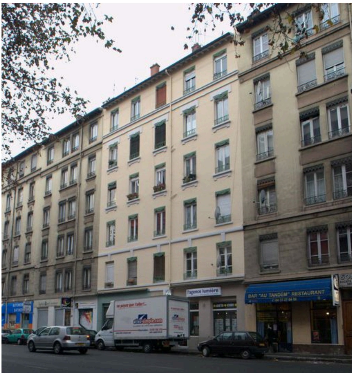
Elévation principale depuis le nord-est