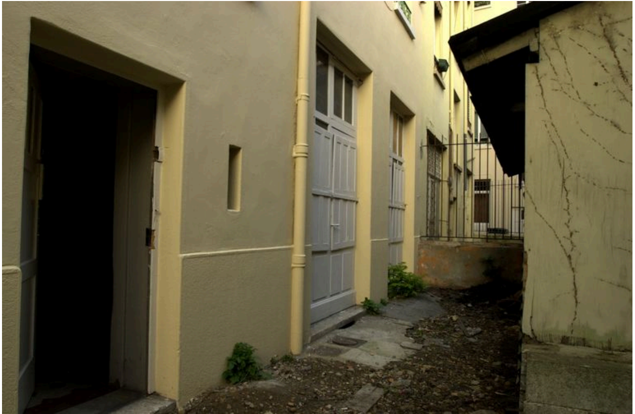
Vue de la cour depuis le nord