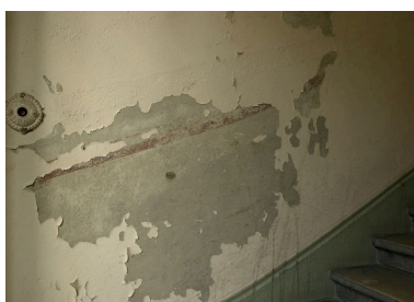
Trace de l'ancien décor peint de la cage d'escalier IVR82_20086900640NUCA