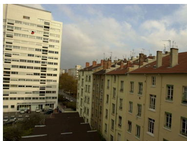
Vue de la façade postérieure depuis le sud-ouest IVR82_20086900646NUCA