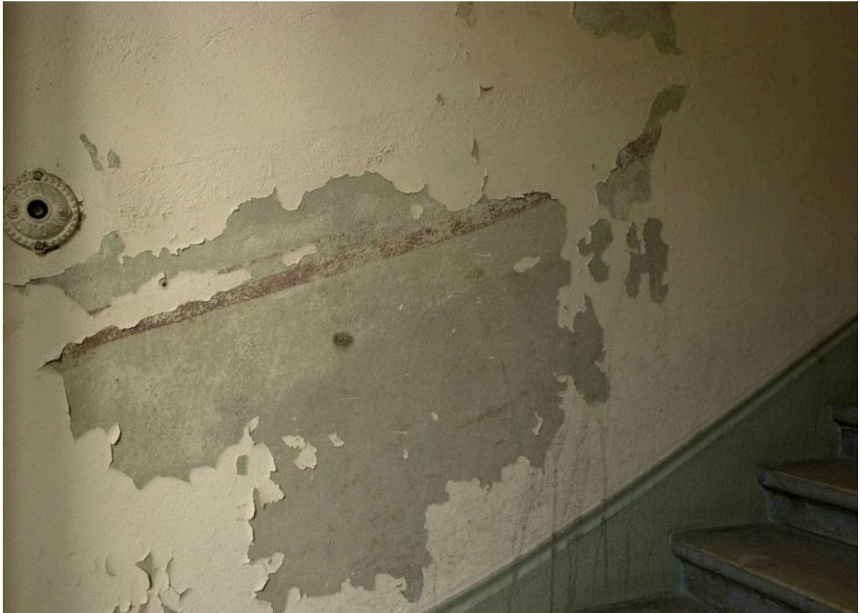
Trace de l'ancien décor peint de la cage d'escalier