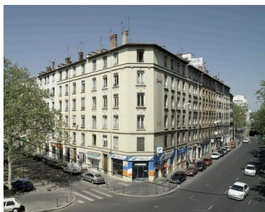
Vue d'ensemble depuis le sud-est IVR82_20076902425NUCA

Plan masse et de situation, extrait de http://cadastre.gouv.fr IVR82_20136902313NUDA