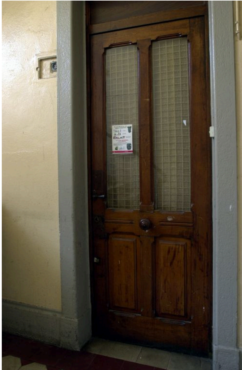
Porte de la loge de concierge dans l'entrée