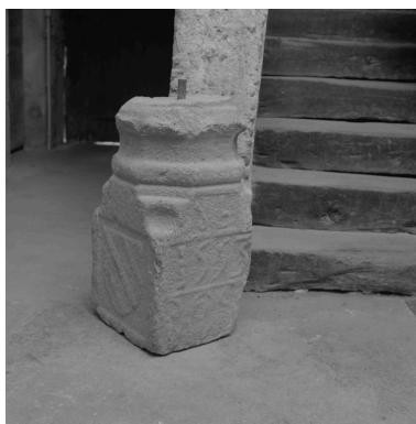
Vue d'ensemble de trois-quarts du dé et de la base du fût, déposés dans le sous-sol de la mairie. IVR82_20034200402X