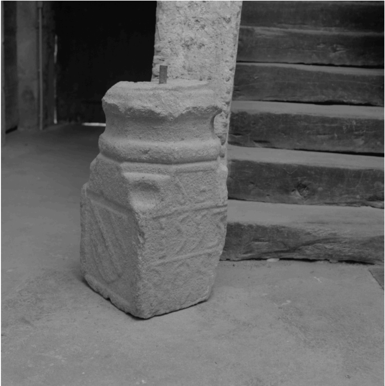
Vue d'ensemble de trois-quarts du dé et de la base du fût, déposés dans le sous-sol de la mairie.