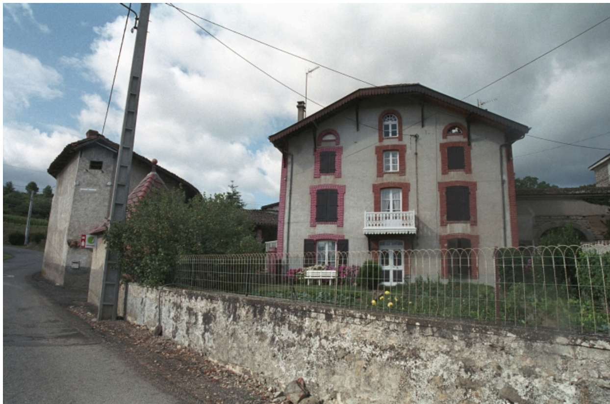
Aux Genettes, maison d'industriel (?) (1986 A 217, 218). Bâtiment en pisé, avec encadrements et chaînage d'angle en brique, toit à croupe. Vue d'ensemble de face.