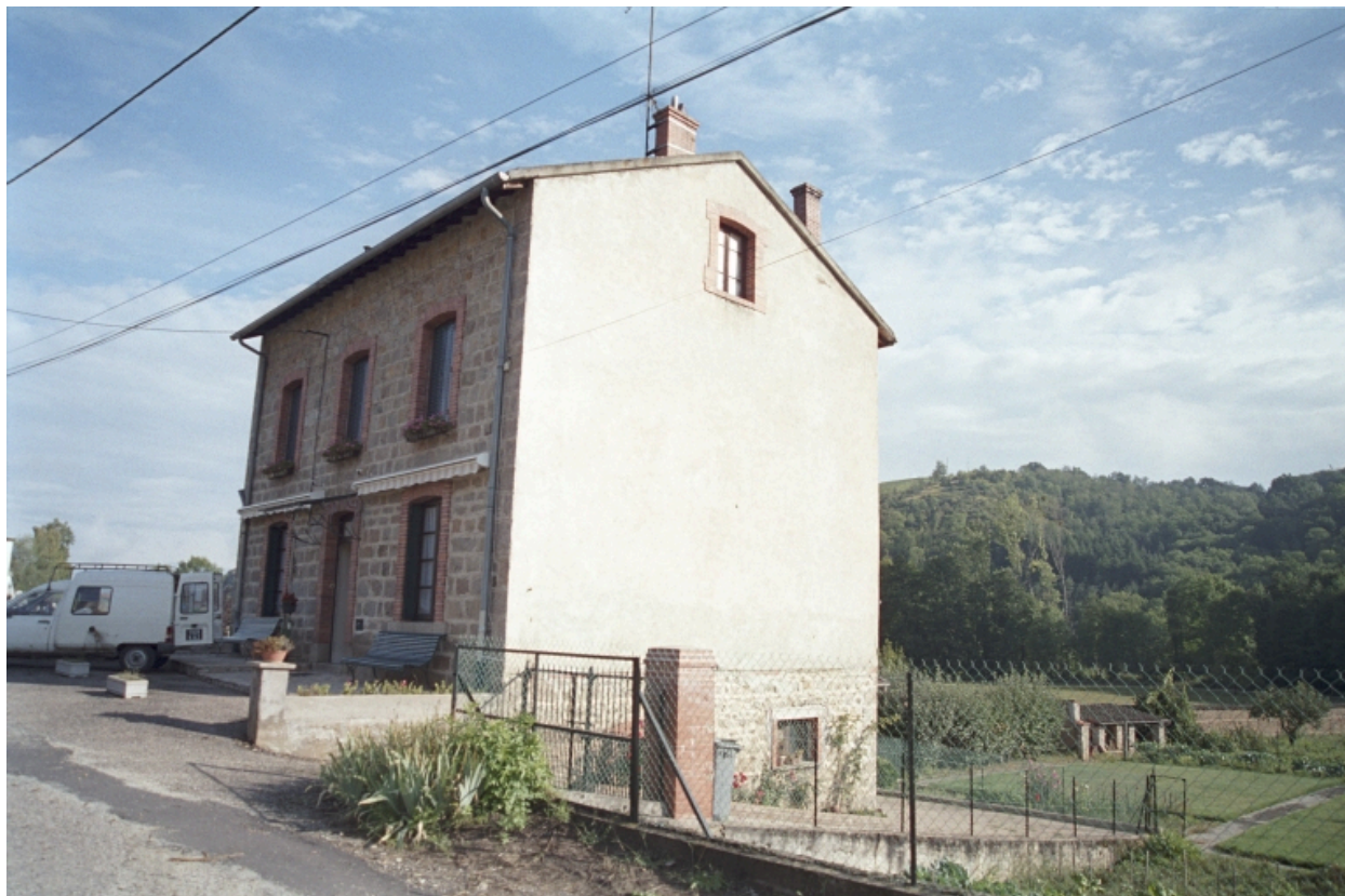
Goutard, maison (1986 C2 1412 a). Bâtiment en moellons avec baie à encadrements en brique sur la façade avant, pisé pour les autres, chaîne d'angle en pierre de taille. Vue d'ensemble de trois-quart latéral droit.