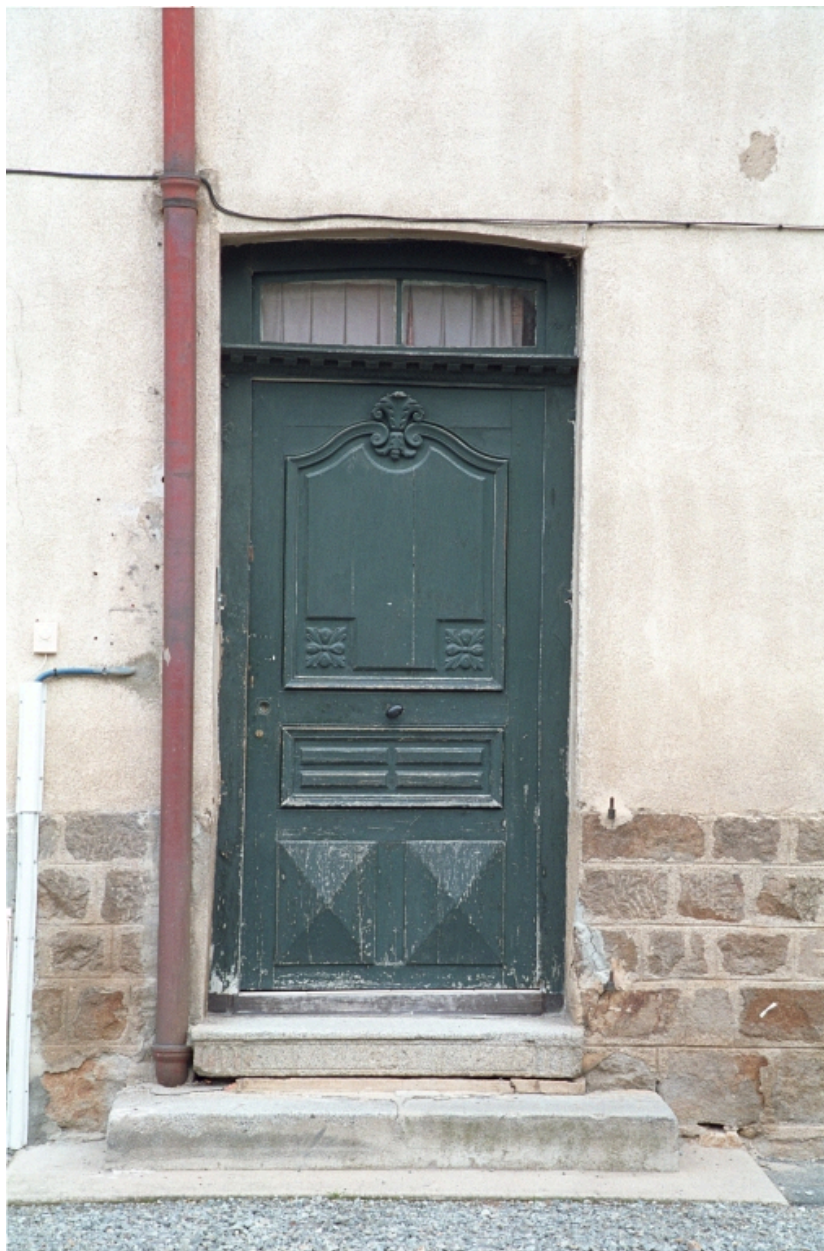
Croix Besson, maison et commerce (1986 B2 1012, 1013). Bâtiment en pisé enduit ; rez-de-chaussée modifié. Détail de la porte d'entrée.