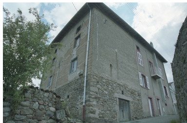
Au Trève, ferme, vue d'ensemble arrière droite de trois-quart (1986 C2 962 à 964).

IVR82_20034200889ZE