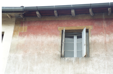
Le Bourg, Maison avec commerce alimentaire (1986 C2 709), vue partielle de la partie haute avec le décor peint (encadrement des baies, faux chaînage d'angle)

IVR82_20034200921ZE