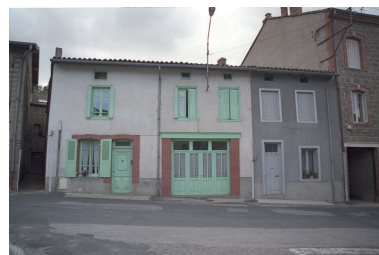
Au Bourg, ancien commerce (1986 C2 779, 780). Bâtiment datant de la dème moitié du 19e siècle, ancienne ferme (?) remaniée avec reperçement de baies à encadrement de brique pour en faire un commerce. Bâtiment aujourd'hui divisé en deux parcelles.