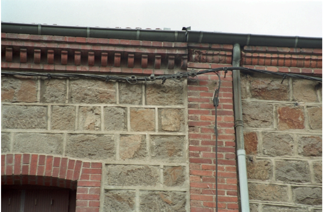
Détail du traitement des corniches et du chaînage d'angle.