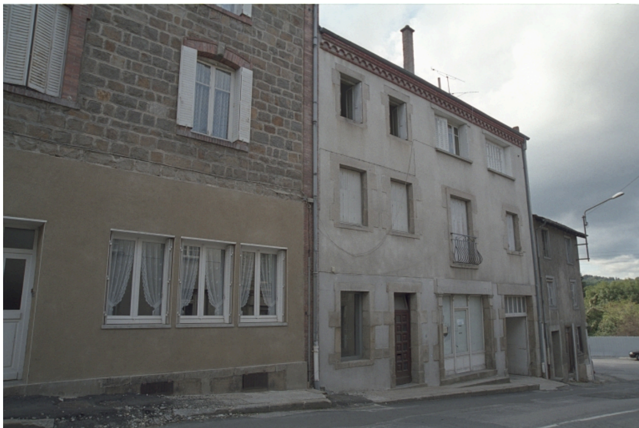
Au Bourg, maison avec ancienne boulangerie au rez-de-chaussée (1986 C2 701). Bâtiment avec enduit ciment et passage donnant accès à une cour arrière. Vue d'ensemble de l'élévation sur rue.