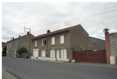
A la Gare, commerce à encadrements en bois, vue d'ensemble de trois-quarts (1986 A 1049).