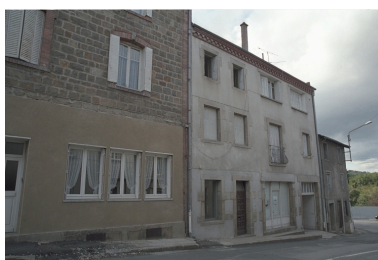
Au Bourg, maison avec ancienne boulangerie au rez-de-chaussée (1986 C2 701). Bâtiment avec enduit ciment et passage donnant accès à une cour arrière. Vue d'ensemble de l'élévation sur rue.

IVR82_20034200921ZE