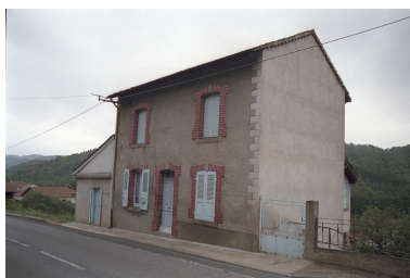
Maison au Gipaud (1986 C2 697). Vue d'ensemble de trois-quarts.