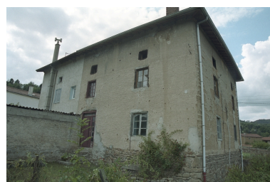
Au Trève, ferme, vue d'ensemble avant droite de trois-quart (1986 C2 962 à 964).