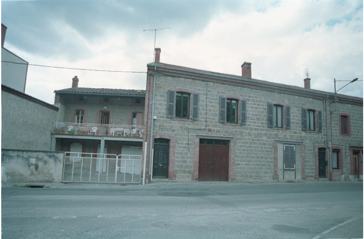
Vue d'ensemble de la façade de la maison depuis la route.