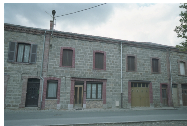
Vue d'ensemble de la façade de la maison depuis la route.

Phot. Thierry Monnet IVR82_20034200785ZE