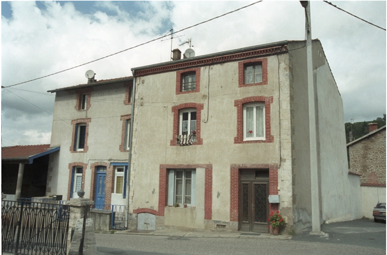
Au Bourg, maison (1986 C2 956). Bâtiment en moellons avec fausse chaîne d'angle à redants peints en trompe-l'oeil, encadrements en brique, rez-de-chaussée remanié. Vue d'ensemble de trois-quarts latérale droite.