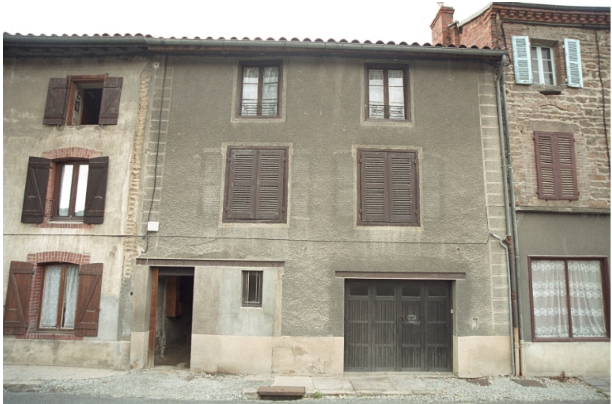
Aux Promenades, maison à encadrements en bois, vue d'ensemble de face (1986 B2 928). Passage permettant l'accès à la cour ; porte d'entrée en façade murée puis repercée à l'intérieur du passage, enduit ciment et faux encadrements gravé dans l'enduit.