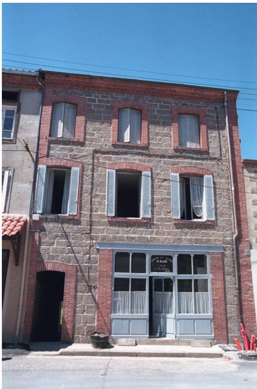
Au Bourg, maison avec commerce (1986 C2 725). Bâtiment en pierre de taille avec encadrement et corniche en brique. Vue d'ensemble de face donnant sur la place de l'église.