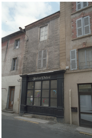
Au Bourg, maison et commerce (1986 C2 710). Bâtiment à encadrements et devanture en bois ; enduit ciment gravé d'une fausse chaîne d'angle. IVR82_20034200881ZE