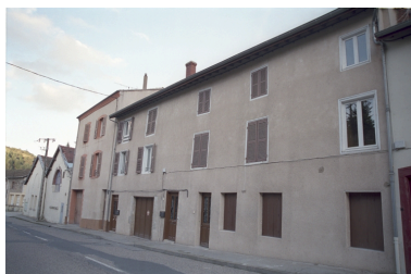
La Font Fort, maison à encadrement de bois vue depuis la route (1986 C2 688).

Phot. Thierry Monnet IVR82_20034200885ZE