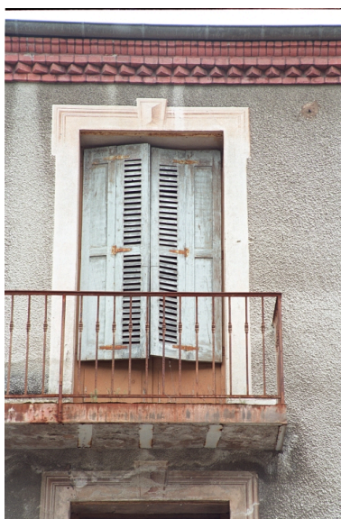
Aux Promenades, maison (1986 B2 901). Bâtiment enduit ciment, décor peint en trompe l'oeil : encadrement mouluré. Détail encadrement peint IVR82_20034200790ZE