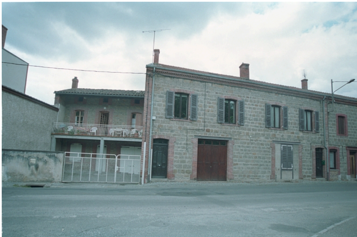
Vue d'ensemble de la façade de la maison depuis la route.