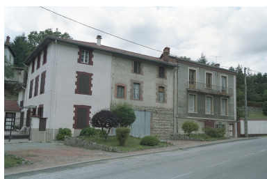
Aux Promenades, maison (1986 B2 901). Bâtiment enduit ciment, décor peint en trompe l'oeil : encadrement mouluré. Vue d'ensemble de face. IVR82_20034200789ZE