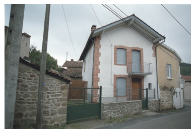
Goutard, maison (1986C2 1052). Bâtiment à encadrements et chaîne d'angle en brique. Vue d'ensemble de trois-quarts.

d'angle en brique. Vue d'ensemble de trois-quarts avant gauche.