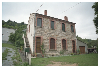
Goutard, maison à double logis (1986 C2 1035). Bâtiment en moellons, avec encadrements, corniche et chaînage