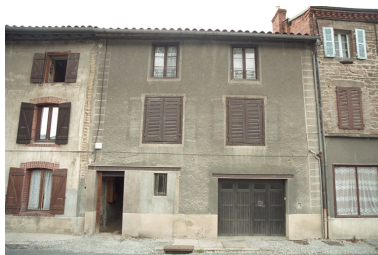
Aux Promenades, maison à encadrements en bois, vue d'ensemble de face (1986 B2 928). Passage permettant l'accès à la cour ; porte d'entrée en façade murée puis reperçée à l'intérieur du passage, enduit ciment et faux encadrements gravés dans l'enduit.

IVR82_20034200779ZE