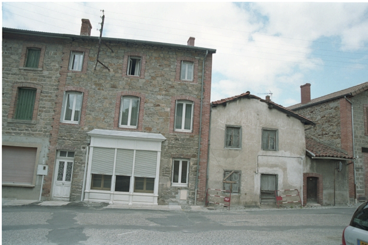
Au Bourg, maison et commerce (1986 C2 746). Vue d'ensemble de la façade principale.