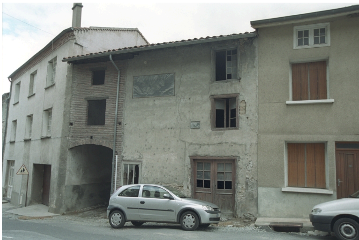
Au Bourg, maison et commerce (1986 C2 1227). Bâtiment en pisé à encadrements et devanture en bois ; ancien atelier d'artisan (?).