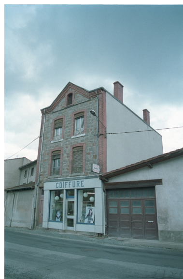
Aux Promenades, maison et commerce (1986 B2 928). Bâtiment en moellons, encadrements, chaîne d'angle et corniche en brique ; fronton triangulaire pour l'étage de combles. Vue d'ensemble de trois-quarts latérale droite.