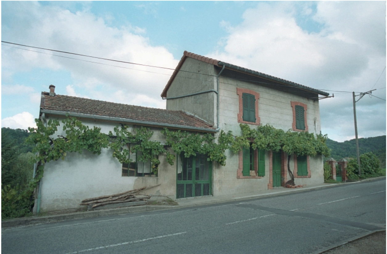
Au Bourg, vue d'ensemble de la façade avant sur rue.