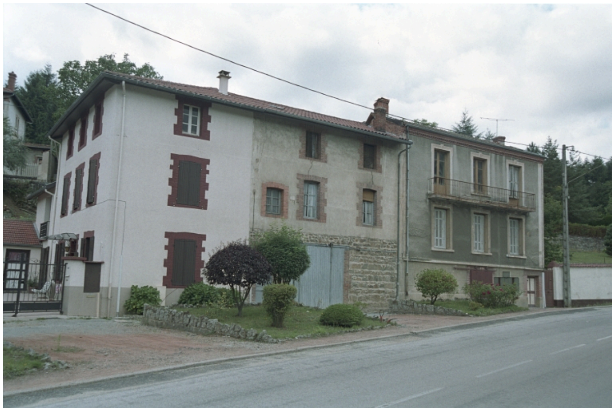
Aux Promenades, maison (1986 B2 901). Bâtiment enduit ciment, décor peint en trompe l'oeil : encadrement mouluré. Vue d'ensemble de face.