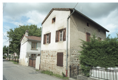
Au Bourg, maison datée 1885 (1986 C2 1025). Vue d'ensemble de trois quarts.