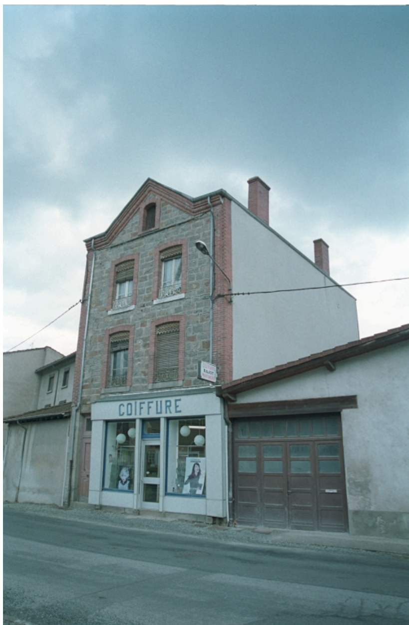
Aux Promenades, maison et commerce (1986 B2 928). Bâtiment en moellons, encadrements, chaîne d'angle et corniche en brique ; fronton triangulaire pour l'étage de combles. Vue d'ensemble de trois-quarts latérale droite.