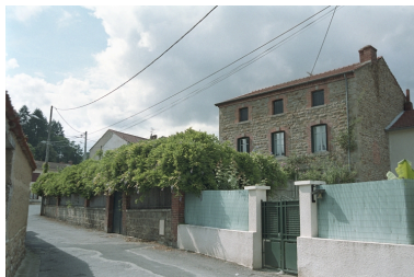
Au Bourg, maison d'industriel (1986 C2 958). Bâtiment en moellons avec baie à encadrements et corniche en brique chaîne d'angle en pierre de taille. Vue d'ensemble de trois-quart latéral droit.

chaînage d'angle en brique, toit à croupe. Vue d'ensemble de face.