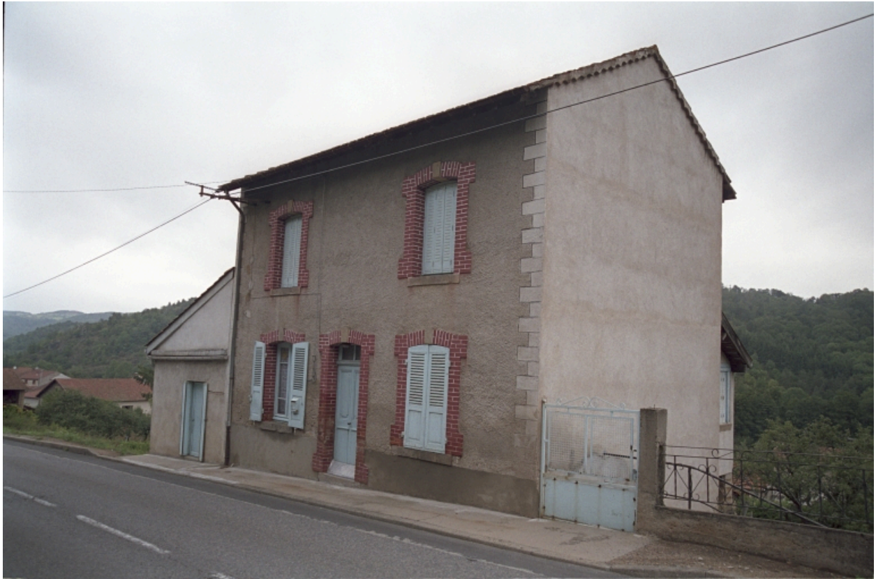
Maison au Gipaud (1986 C2 697). Vue d'ensemble de trois-quarts.