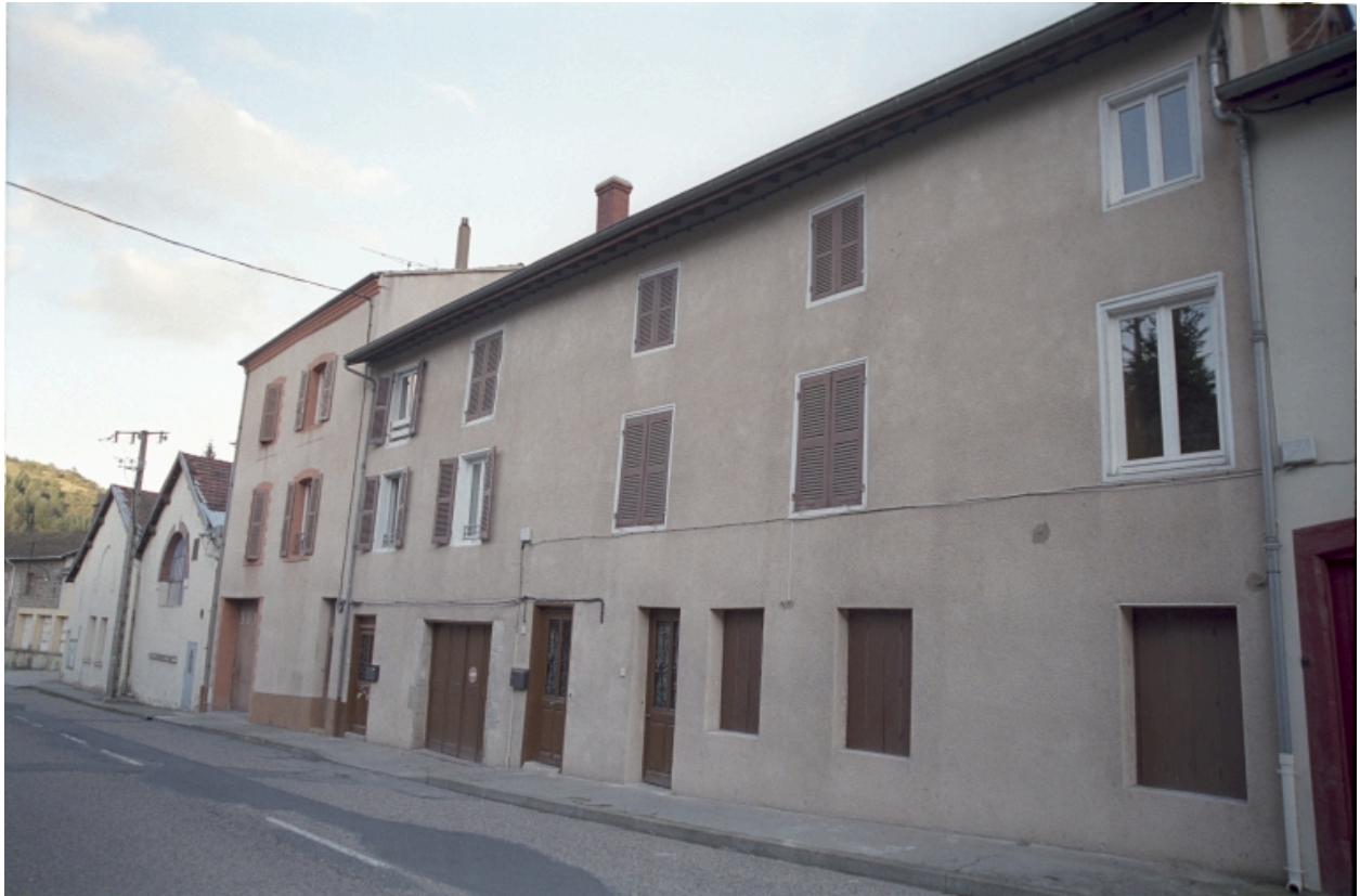
La Font Fort, maison à encadrement de bois vue depuis la route (1986 C2 688).