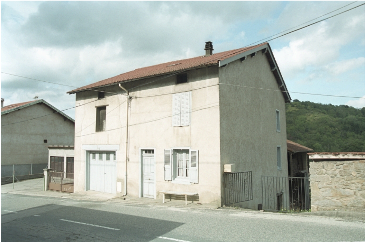
Le Bourg, maison (1986 C2 914), vue d'ensemble avant droite de trois-quarts.