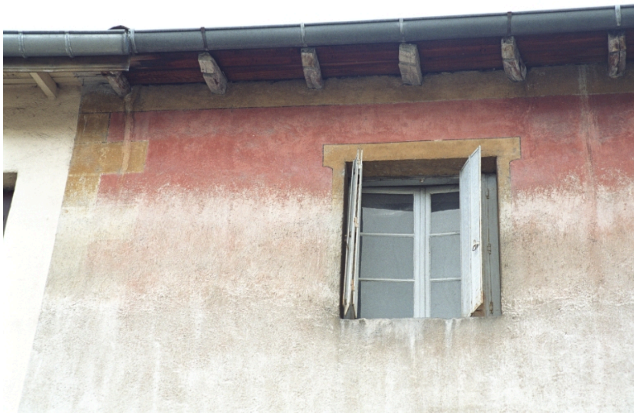
Le Bourg, Maison avec commerce alimentaire (1986 C2 709), vue partielle de la partie haute avec le décor peint (encadrement des baies, faux chaînage d'angle)