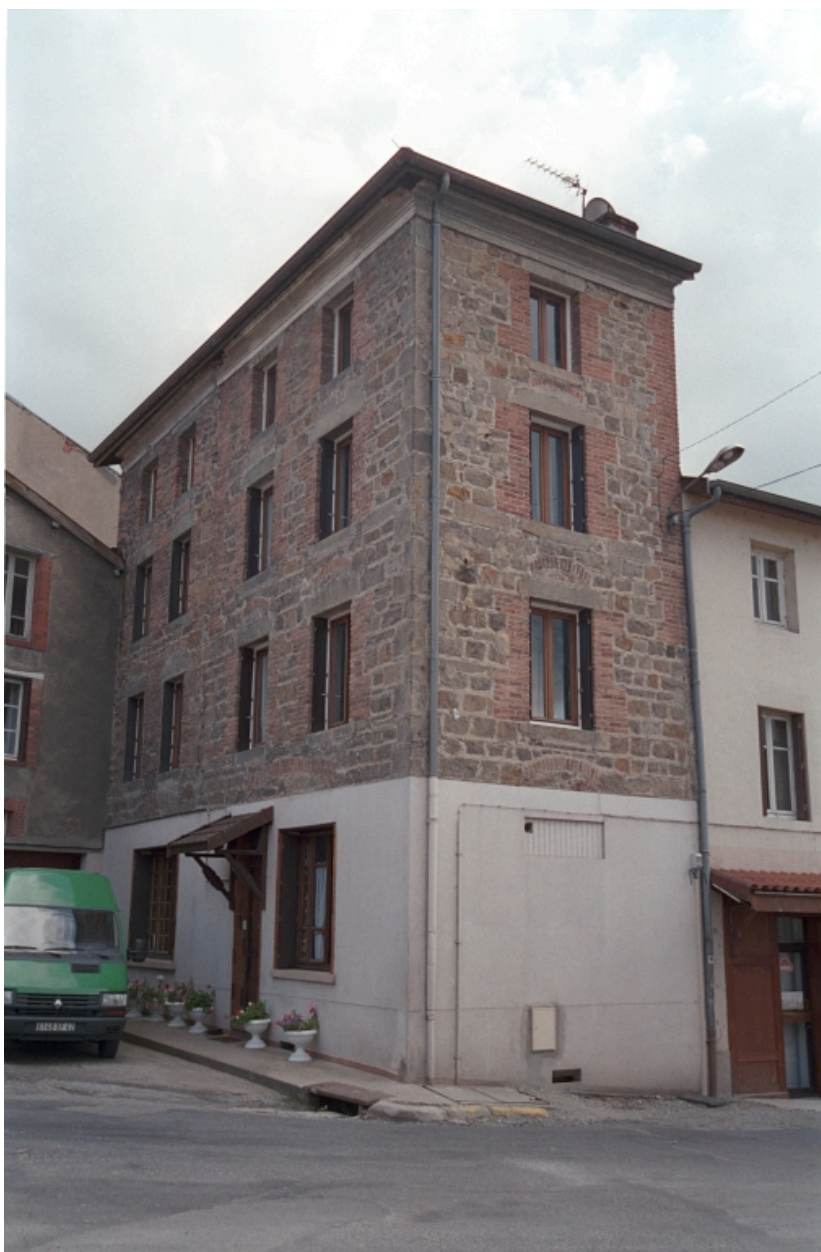
Au Bourg, immeuble (1986 C2 703, 704). Bâtiment en moellons avec baie à encadrements en brique et pierre de taille, arc de décharge, corniche en brique enduite, chaîne d'angle en brique. Vue d'ensemble de trois-quart.