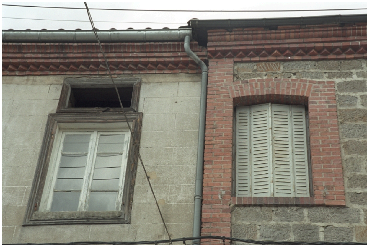
Au Bourg, maison avec commerce (1986 C2 725). Bâtiment en moellons avec chaîne d'angle et corniche en brique. Détail des baies et corniches.