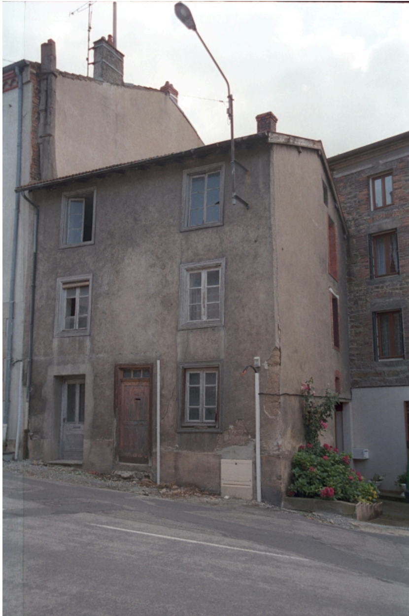
Le Bourg, maison (1986 C2 702), vue d'ensemble de trois-quarts.