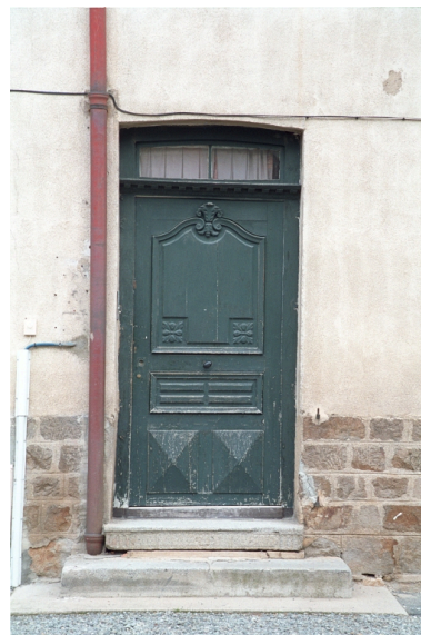
Croix Besson, maison et commerce (1986 B2 1012, 1013). Bâtiment en pisé enduit ; rez-de-chaussée modifié. Détail de la porte d'entrée. IVR82_20034200784ZE