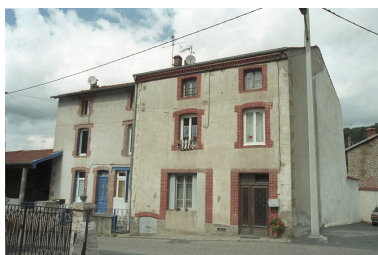
Au Bourg, maison (1986 C2 956). Bâtiment en moellons avec fausse chaîne d'angle à redants peints en trompe-l'oeil, encadrements en brique, rez-de-chaussée remanié. Vue d'ensemble de trois-quarts latérale droite. IVR82_20034200780ZE