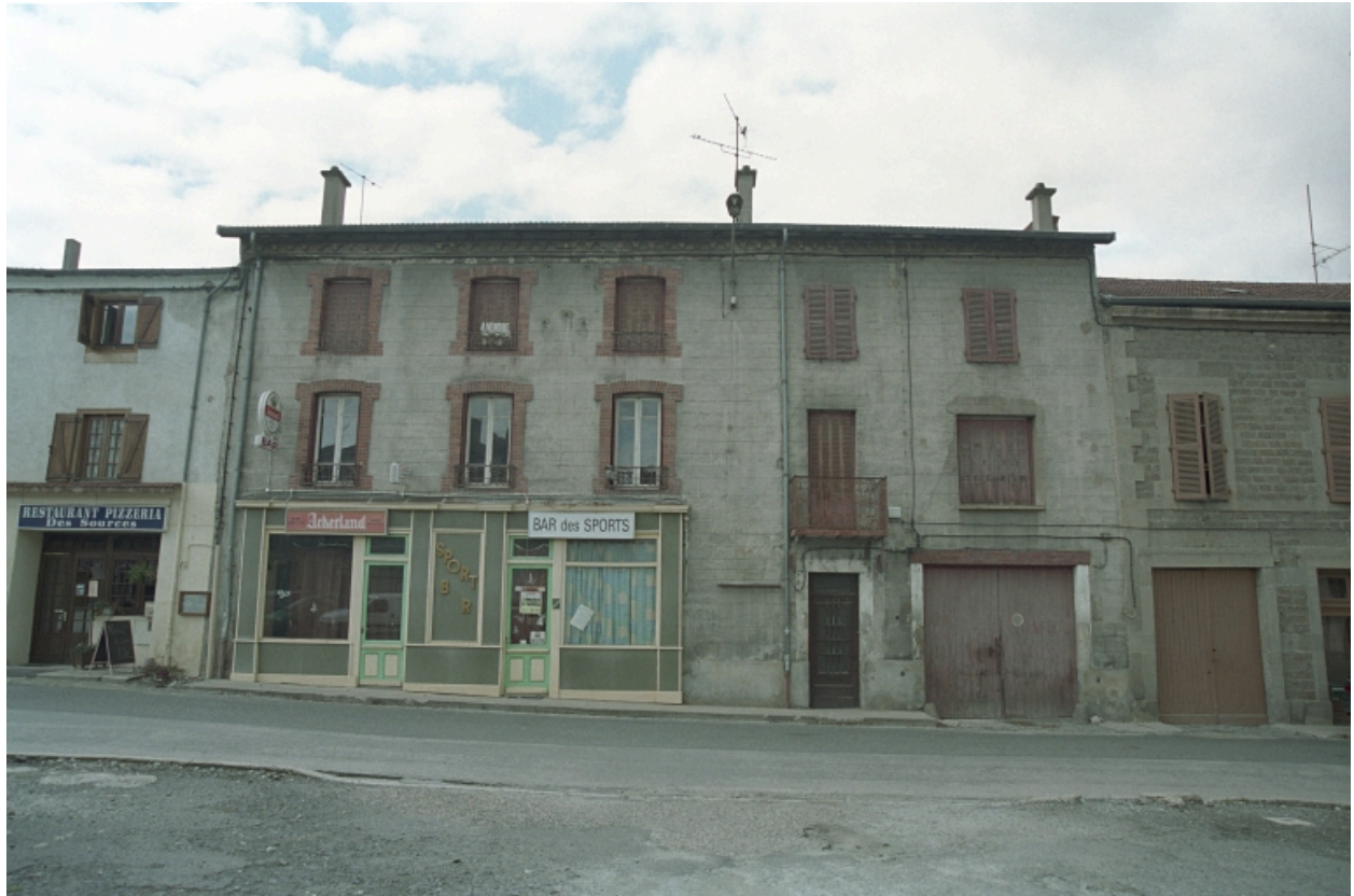
Aux Promenades, maison et commerce (1986 B2 953). Bâtiment à encadrements de brique dans sa partie gauche, enduite ciment avec faux appareillage gravé, partie droite de l'édifice plus récente. Vue d'ensemble de face.