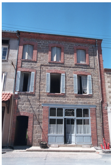
Au Bourg, maison avec commerce (1986 C2 725). Bâtiment en pierre de taille avec encadrement et corniche en brique. Vue d'ensemble de face donnant sur la place de l'église. IVR82_20034201947ZE