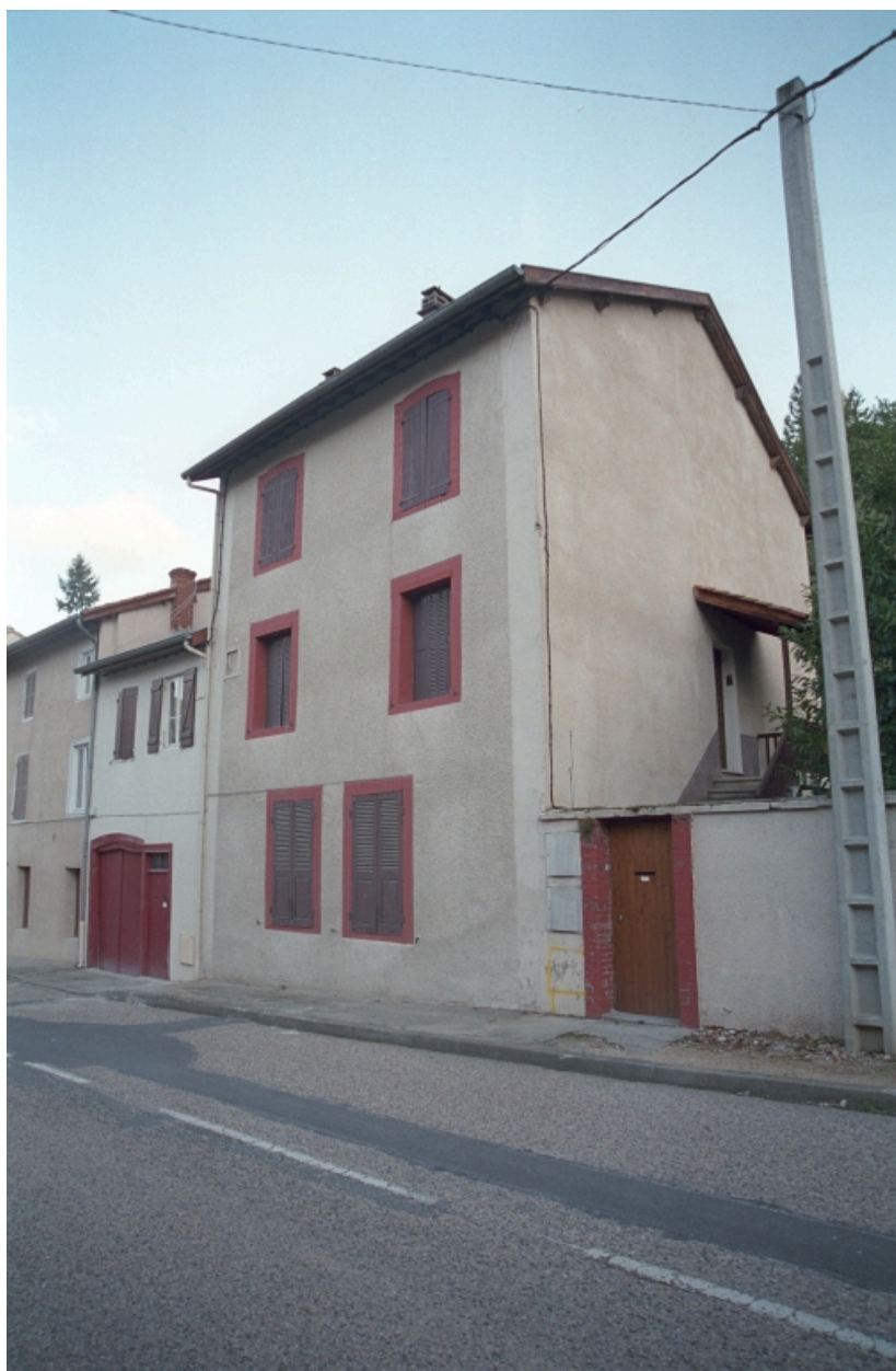
La Font Fort, maison (1986 C2 1386). Bâtiment à encadrements en brique. Vue d'ensemble de trois-quarts droit.