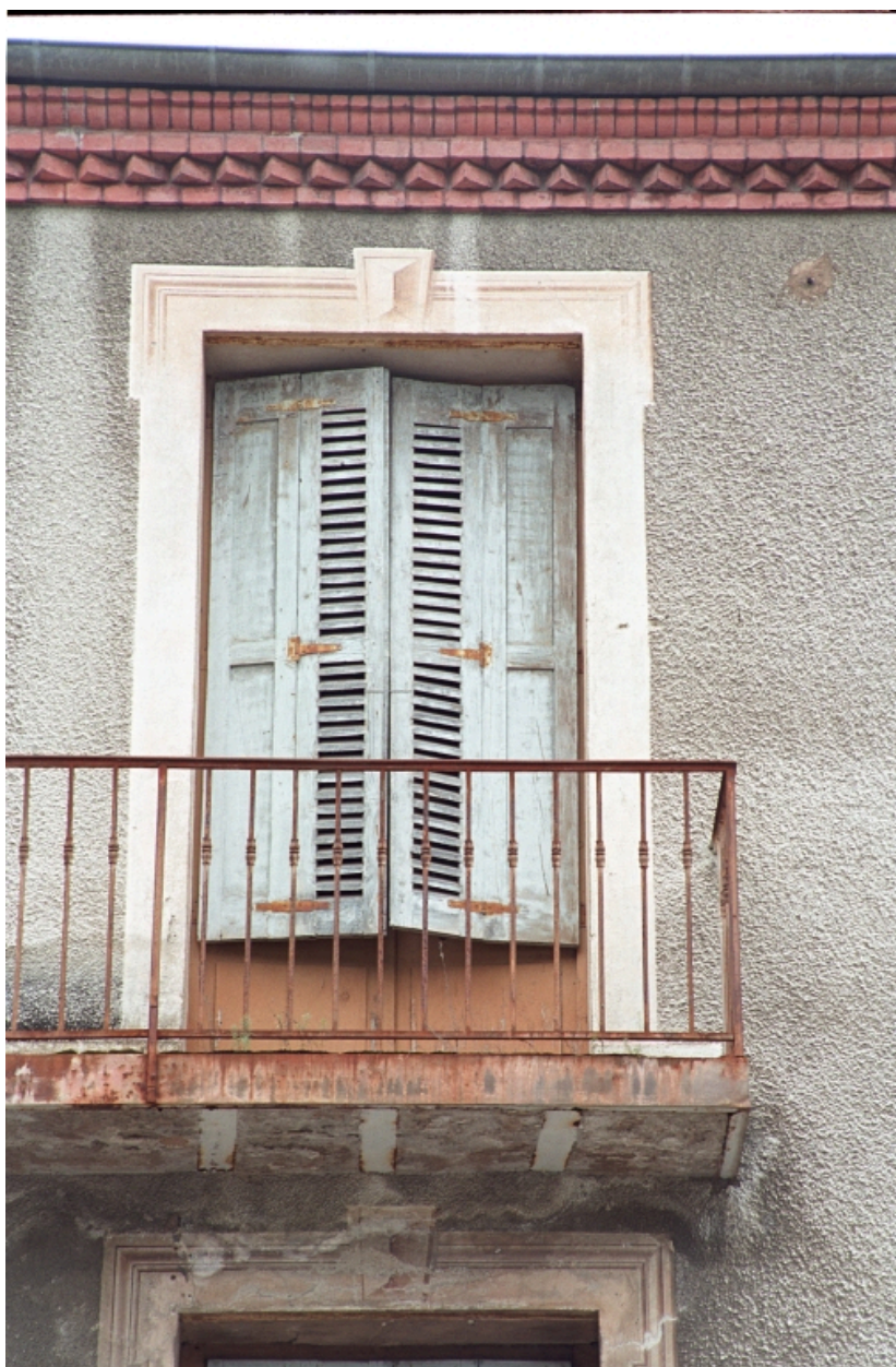
Aux Promenades, maison (1986 B2 901). Bâtiment enduit ciment, décor peint en trompe l'oeil : encadrement mouluré. Détail encadrement peint