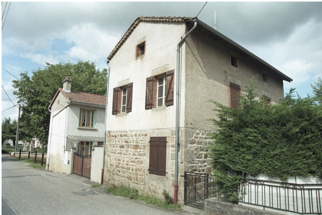
Au Bourg, maison datée 1885 (1986 C2 1025). Vue d'ensemble de trois quarts.