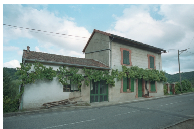
Au Bourg, vue d'ensemble de la façade avant sur rue.