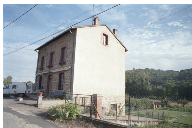
Goutard, maison (1986 C2 1412 a). Bâtiment en moellons avec baie à encadrements en brique sur la façade avant, pisé pour les autres, chaîne d'angle en pierre de taille. Vue d'ensemble de trois-quart latéral droit. IVR82_20034200794ZE

IVR82_20034200876ZE