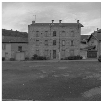
Vue d'ensemble de l'immeuble (1986 C2 1504).

Phot. Thierry Monnet IVR82_20034200792ZE