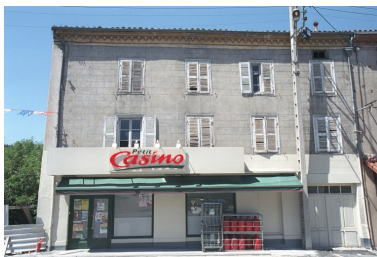
Au Bourg, maison avec commerce (1986 C2 1290). Bâtiment avec enduit à faux appareillage et génoise. Vue d'ensemble de face donnant sur la place de l'église.