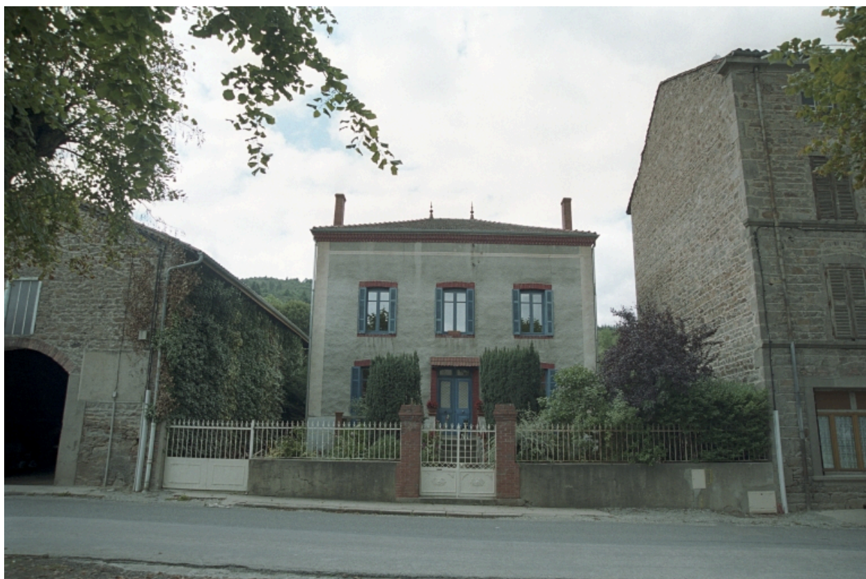
Maison d'industriel au Bourg (1986 B2 945). Vue d'ensemble de face.