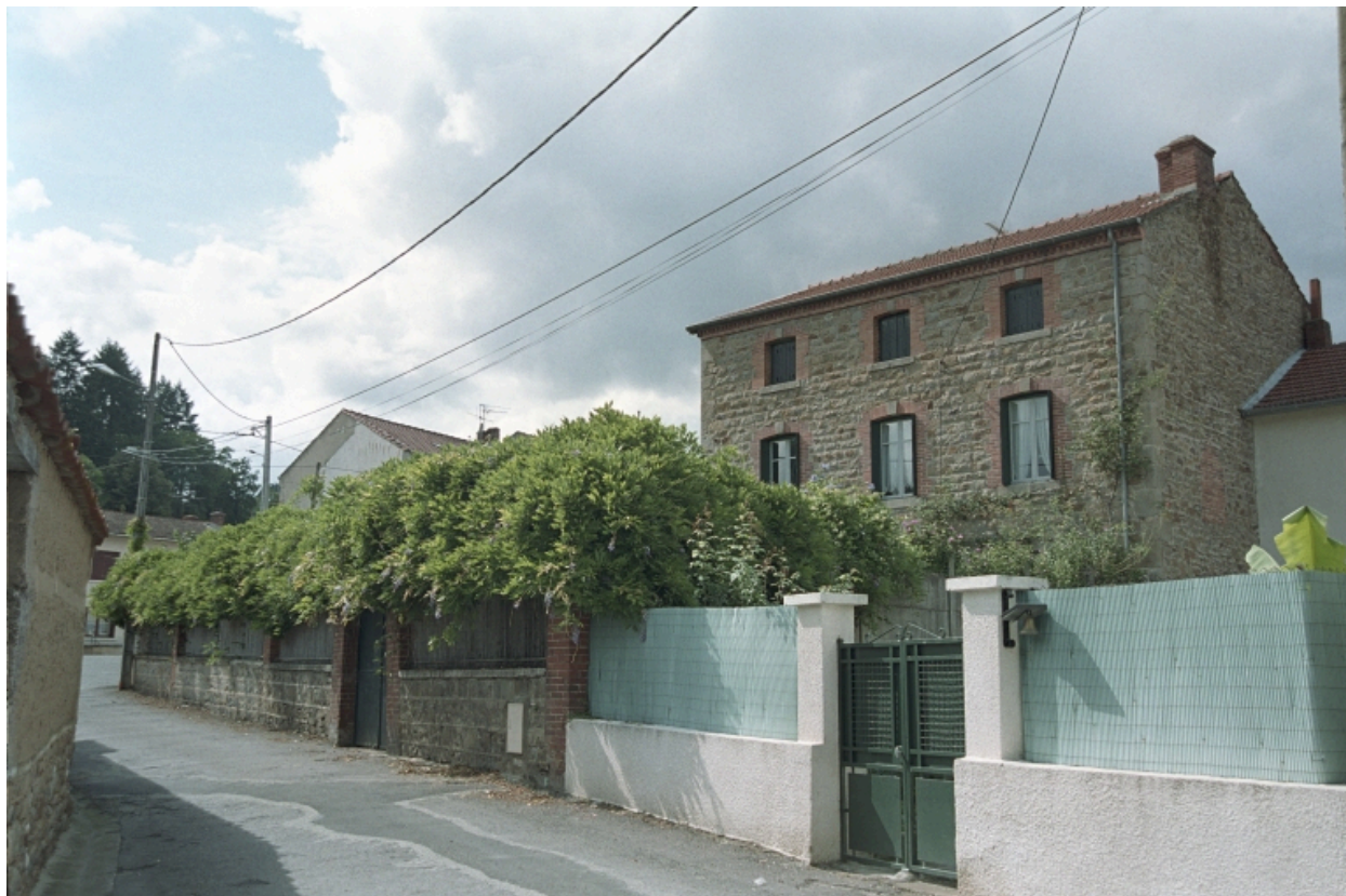
Au Bourg, maison d'industriel (1986 C2 958). Bâtiment en moellons avec baie à encadrements et corniche en brique chaîne d'angle en pierre de taille. Vue d'ensemble de trois-quart latéral droit.