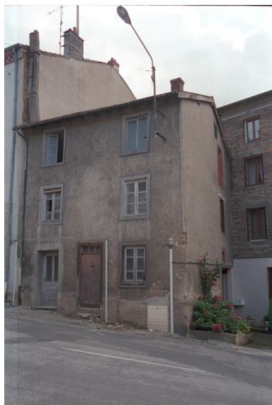
Le Bourg, maison (1986 C2 702), vue d'ensemble de trois-quarts.