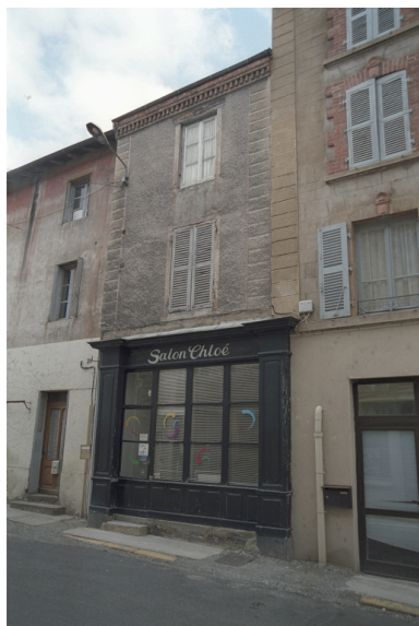
Au Bourg, maison et commerce (1986 C2 710). Bâtiment à encadrements et devanture en bois ; enduit ciment gravé d'une fausse chaîne d'angle.