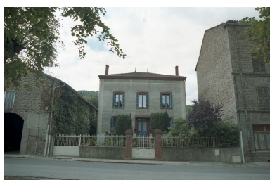
Maison d'industriel au Bourg (1986 B2 945). Vue d'ensemble de face.