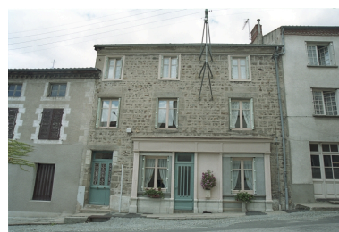
Au Bourg, maison avec ancien commerce au rez-de-chaussée, devanture en bois (1986 C2 701). Bâtiment maçonné non enduit, encadrements en pierre et bois à l'étage de combles, corniche en brique enduite. Vue d'ensemble de l'élévation sur rue.

IVR82_20034200874ZE