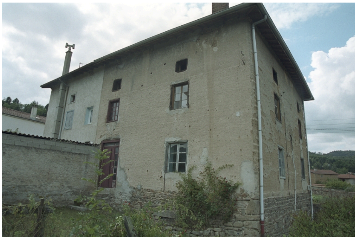
Au Trève, ferme, vue d'ensemble avant droite de trois-quart (1986 C2 962 à 964).