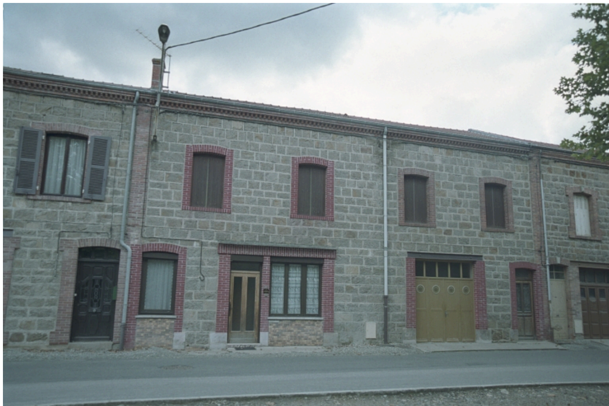
Vue d'ensemble de la façade de la maison depuis la route.