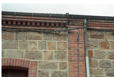
Détail du traitement des corniches et du chaînage d'angle.

IVR82_20034200738ZE