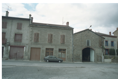
Aux Promenades, maison avec commerce (1986 B2 950). Bâtiment en moellons avec chaîne d'angle en pierre de taille, corniche en brique enduite. Vue d'ensemble de face.

IVR82_20034200791ZE