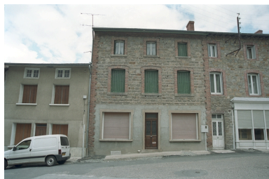
Le Bourg, maison et commerce (1986 C2 745), vue d'ensemble de face. Maison maçonnerie avec encadrement des baies en brique.

Phot. Thierry Monnet IVR82_20034200779ZE