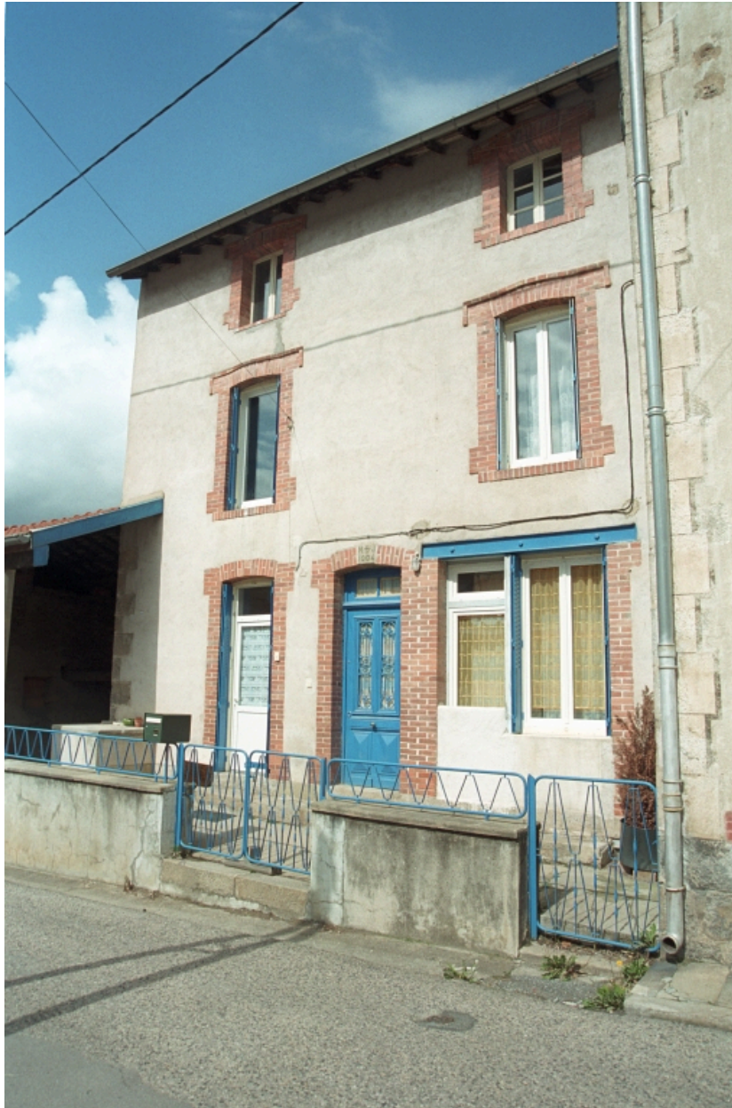
Au Bourg, maison (1986 C2 959, 1202). Vue d'ensemble de la façade principale.