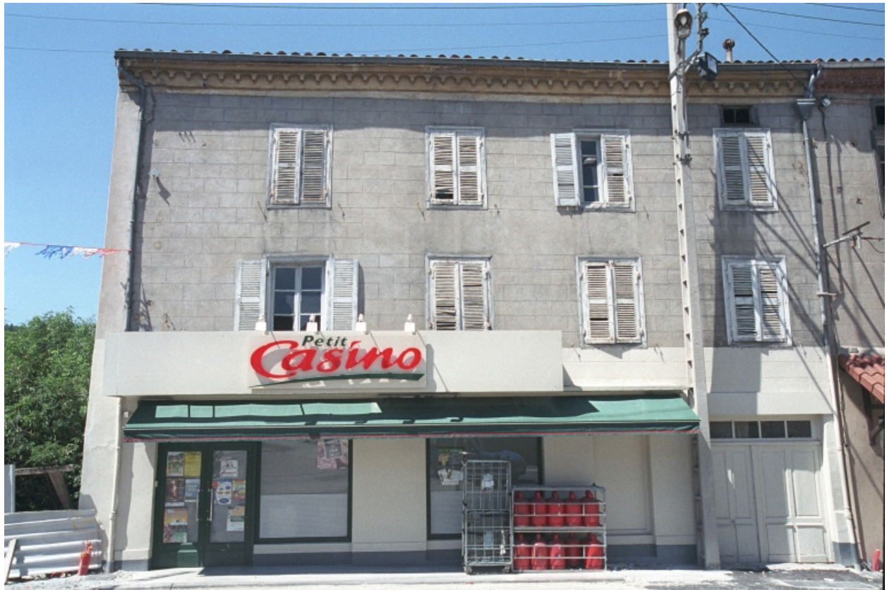
Au Bourg, maison avec commerce (1986 C2 1290). Bâtiment avec enduit à faux appareillage et génoise. Vue d'ensemble de face donnant sur la place de l'église.