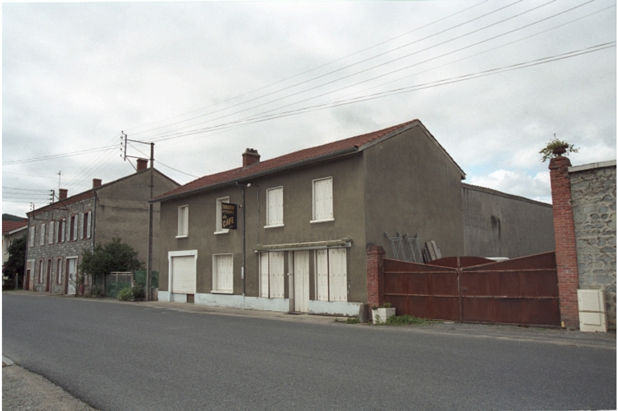
A la Gare, commerce à encadrements en bois, vue d'ensemble de trois-quarts (1986 A 1049).