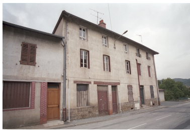
Croix Besson, maison et commerce (1986 B2 1012, 1013). Bâtiment en pisé enduit ; rez-de-chaussée modifié. Vue d'ensemble de trois-quarts latérale gauche. IVR82_20034200783ZE