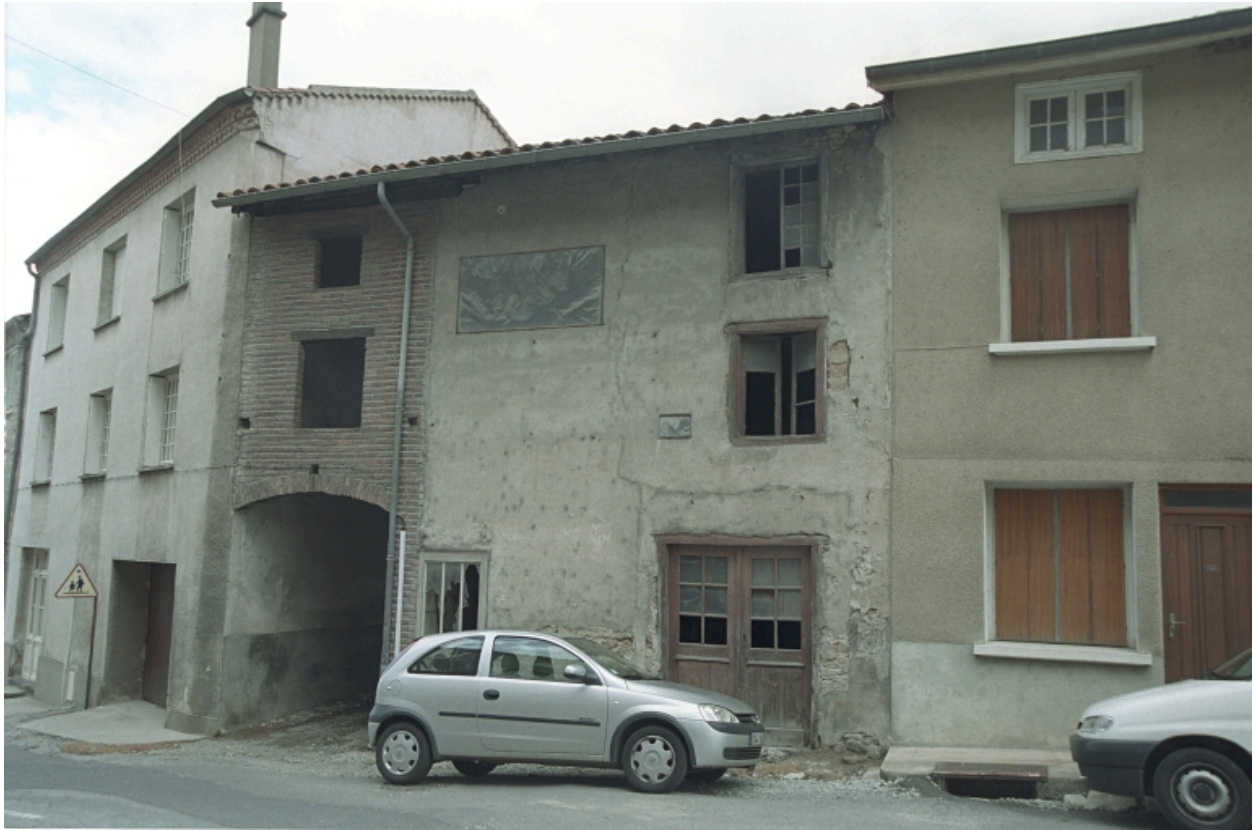
Au Bourg, maison et commerce (1986 C2 1227). Bâtiment en pisé à encadrements et devanture en bois ; ancien atelier d'artisan (?).