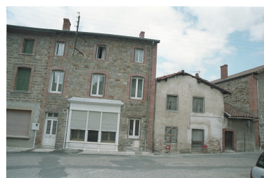
Au Bourg, maison et commerce (1986 C2 746). Vue d'ensemble de la façade principale.

Phot. Thierry Monnet IVR82_20034200778ZE