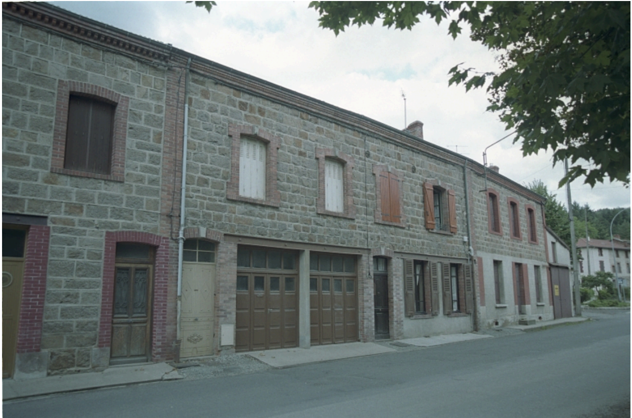
Vue d'ensemble de la façade principale depuis la route.