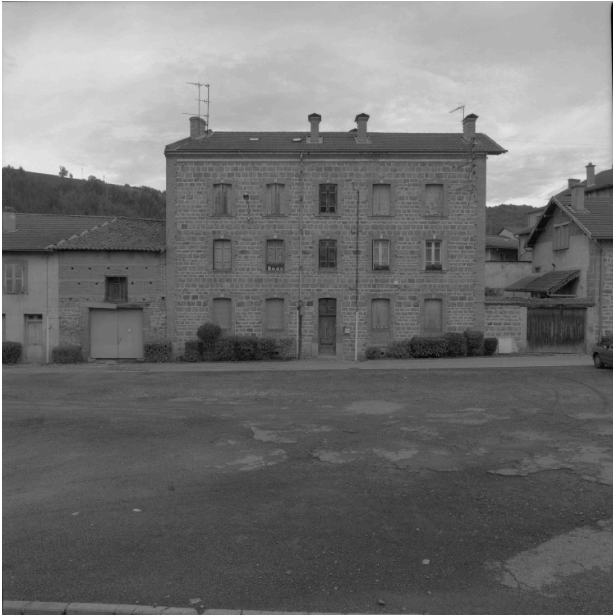
Vue d'ensemble de l'immeuble (1986 C2 1504).