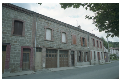
Vue d'ensemble de la façade principale depuis la route.

Phot. Thierry Monnet IVR82_20034200740ZE