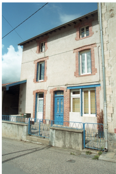
Au Bourg, maison (1986 C2 959, 1202). Vue d'ensemble de la façade principale. IVR82_20034200757ZE