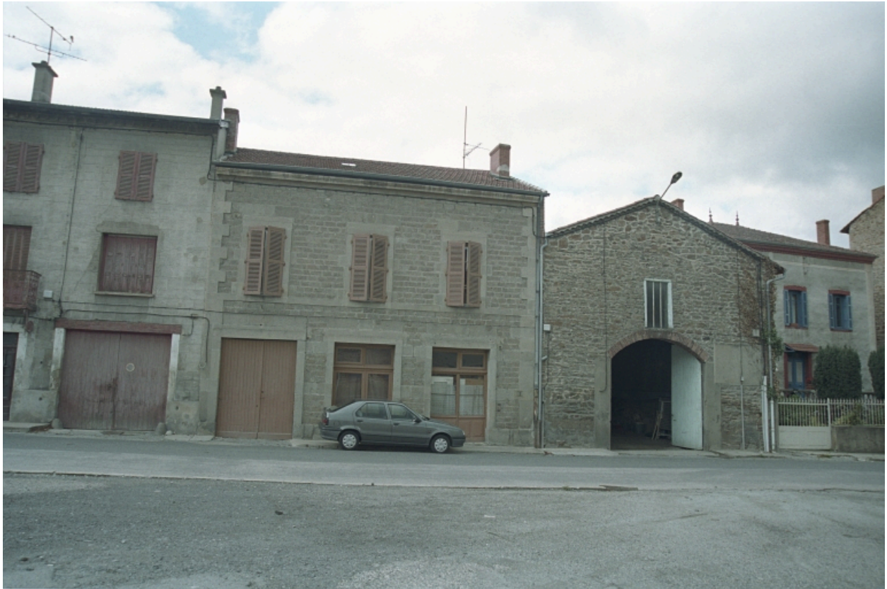
Aux Promenades, maison avec commerce (1986 B2 950). Bâtiment en moellons avec chaîne d'angle en pierre de taille, corniche en brique enduite. Vue d'ensemble de face.