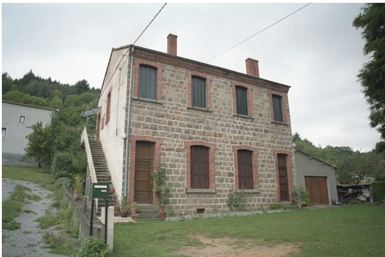
Goutard, maison à double logis (1986 C2 1035). Bâtiment en moellons, avec encadrements, corniche et chaînage d'angle en brique. Vue d'ensemble de trois-quarts avant gauche.