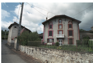
Aux Genettes, maison d'industriel (?) (1986 A 217, 218). Bâtiment en pisé, avec encadrements et