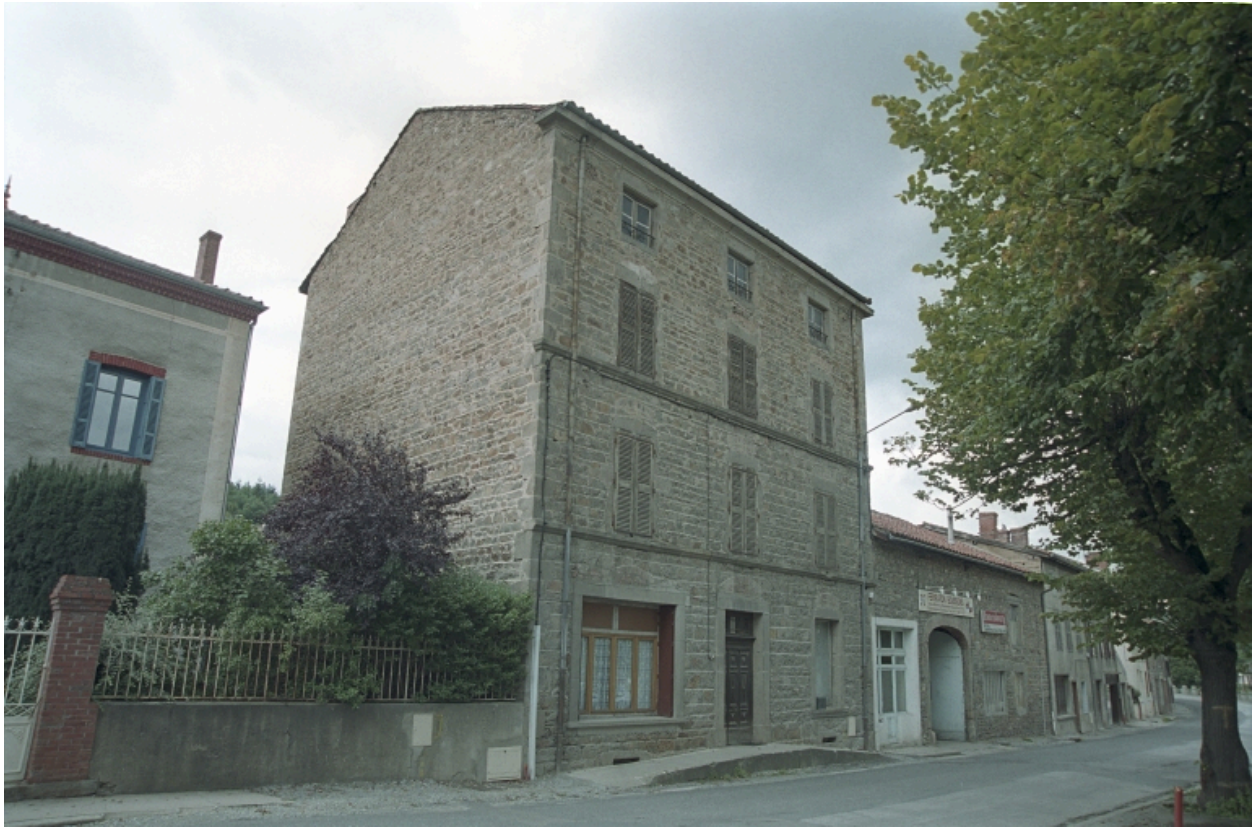
Aux Promenades, immeuble (1986 B2 1183). Bâtiment maçonné, corniche en pierre de taille, façade avec deux cordons en pierre ; baie gauche du rez-de-chaussée remaniée. Vue d'ensemble de trois-quarts gauche.