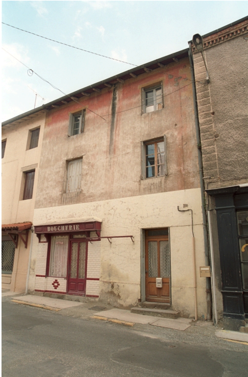
Le Bourg, Maison avec commerce alimentaire (1986 C2 709), vue d'ensemble.