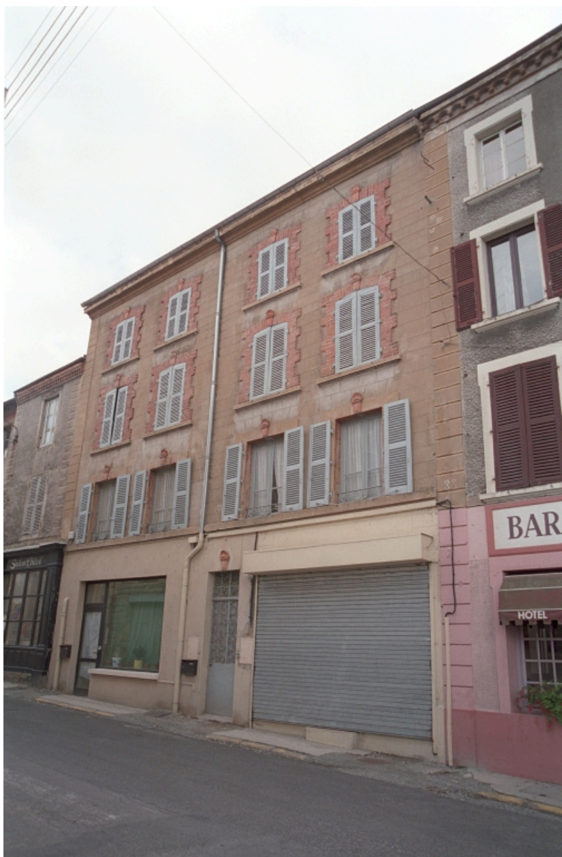
Maison du bourg avec commerce au rez-de-chaussée (1986 C2 697). Vue d'ensemble de la façade sur rue.