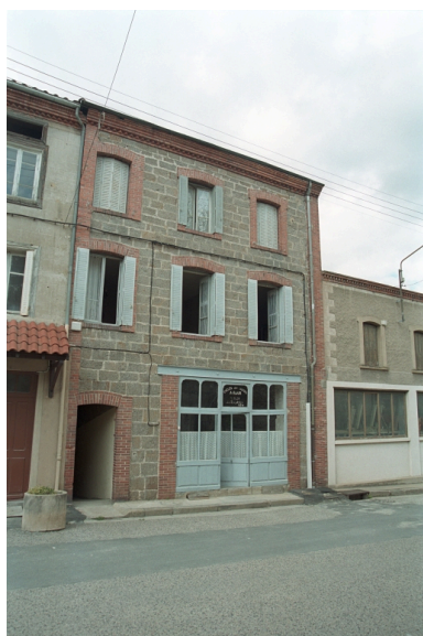
Au Bourg, maison avec commerce (1986 C2 725). Bâtiment en moellons avec chaîne d'angle et corniche en brique. Vue d'ensemble de face.

IVR82_20034200873ZE