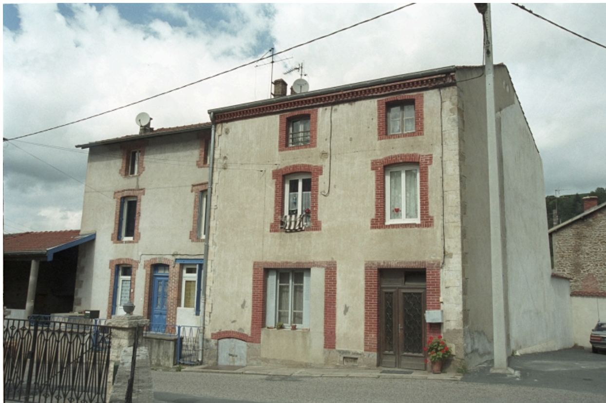
Au Bourg, maison (1986 C2 956). Bâtiment en moellons avec fausse chaîne d'angle à redants peints en trompe-l'oeil, encadrements en brique, rez-de-chaussée remanié. Vue d'ensemble de trois-quarts latérale droite.