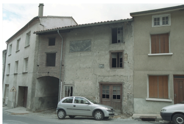
Au Bourg, maison et commerce (1986 C2 1227). Bâtiment en pisé à encadrements et devanture en bois ; ancien atelier d'artisan (?).