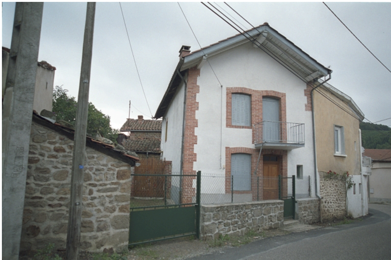
Goutard, maison (1986C2 1052). Bâtiment à encadrements et chaîne d'angle en brique. Vue d'ensemble de trois-quarts.