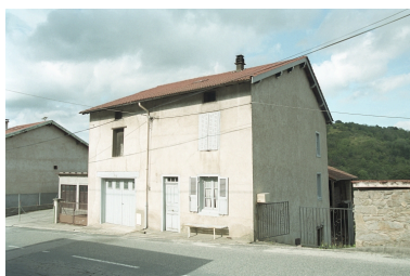
Le Bourg, maison (1986 C2 914), vue d'ensemble avant droite de trois-quarts.