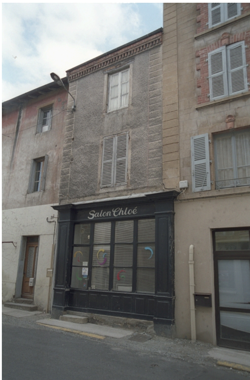
Au Bourg, maison et commerce (1986 C2 710). Bâtiment à encadrements et devanture en bois ; enduit ciment gravé d'une fausse chaîne d'angle.