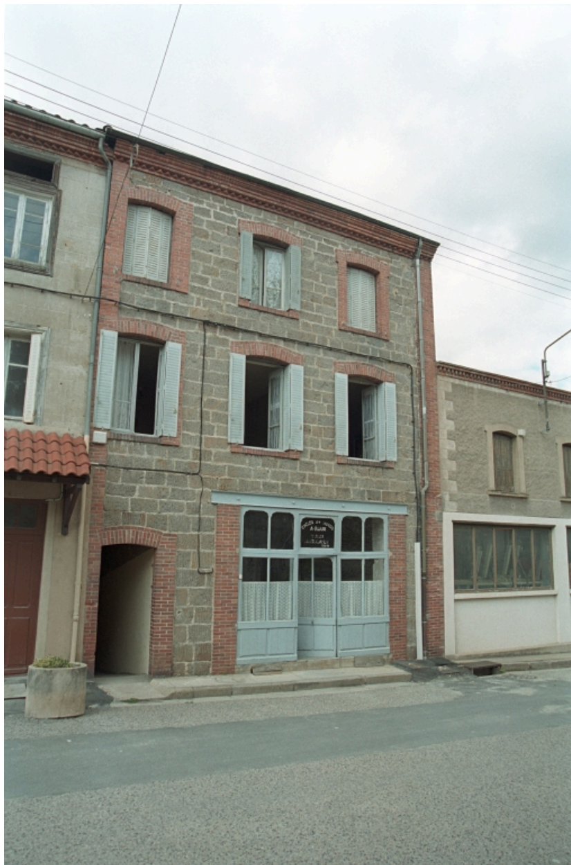
Au Bourg, maison avec commerce (1986 C2 725). Bâtiment en moellons avec chaîne d'angle et corniche en brique. Vue d'ensemble de face.