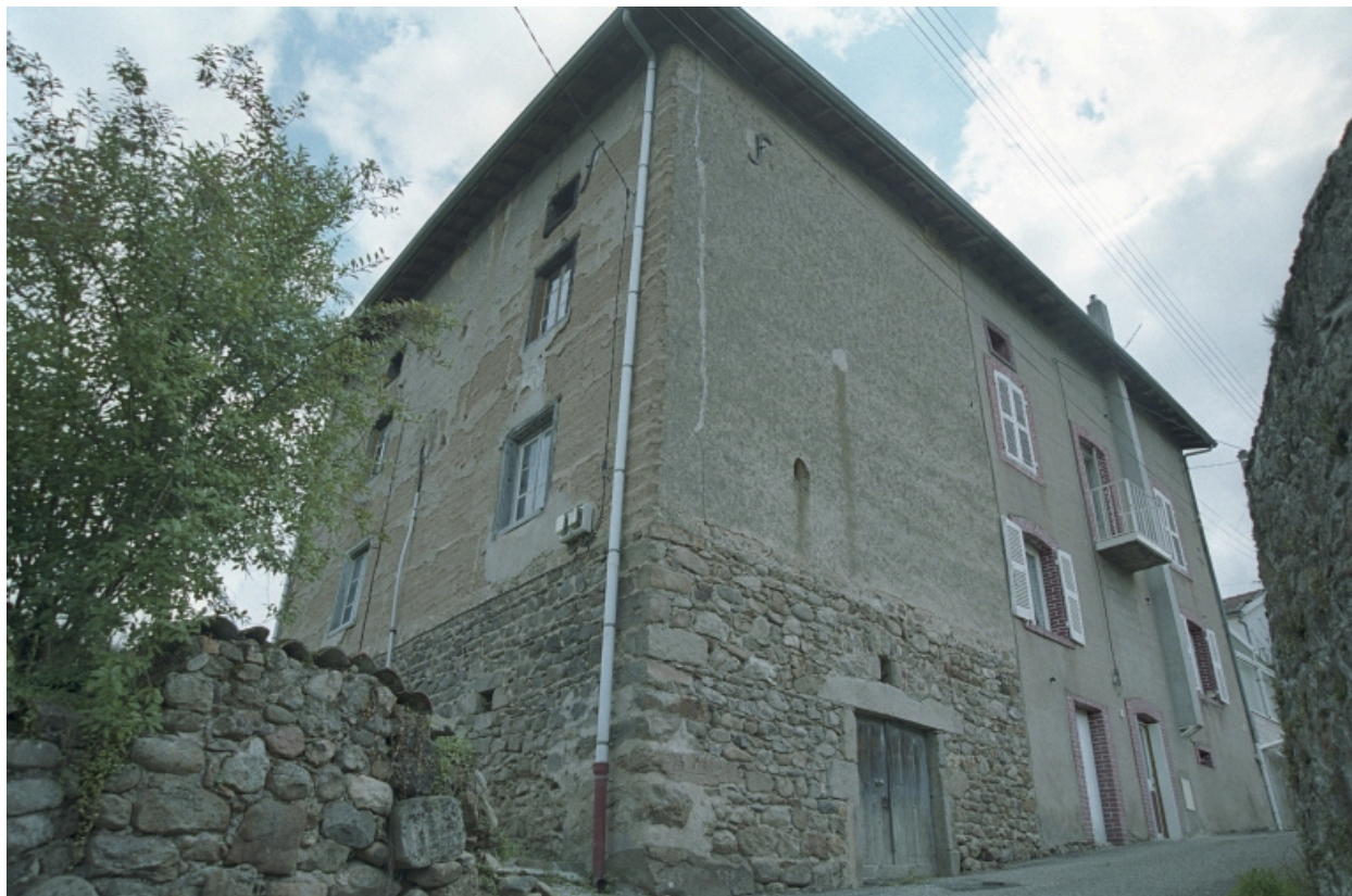
Au Trève, ferme, vue d'ensemble arrière droite de trois-quart (1986 C2 962 à 964).