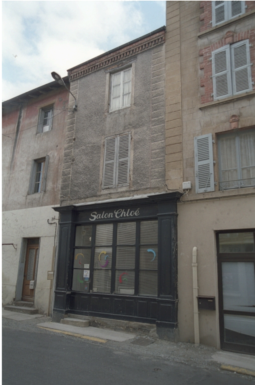
Au Bourg, maison et commerce (1986 C2 710). Bâtiment à encadrements et devanture en bois ; enduit ciment gravé d'une fausse chaîne d'angle.