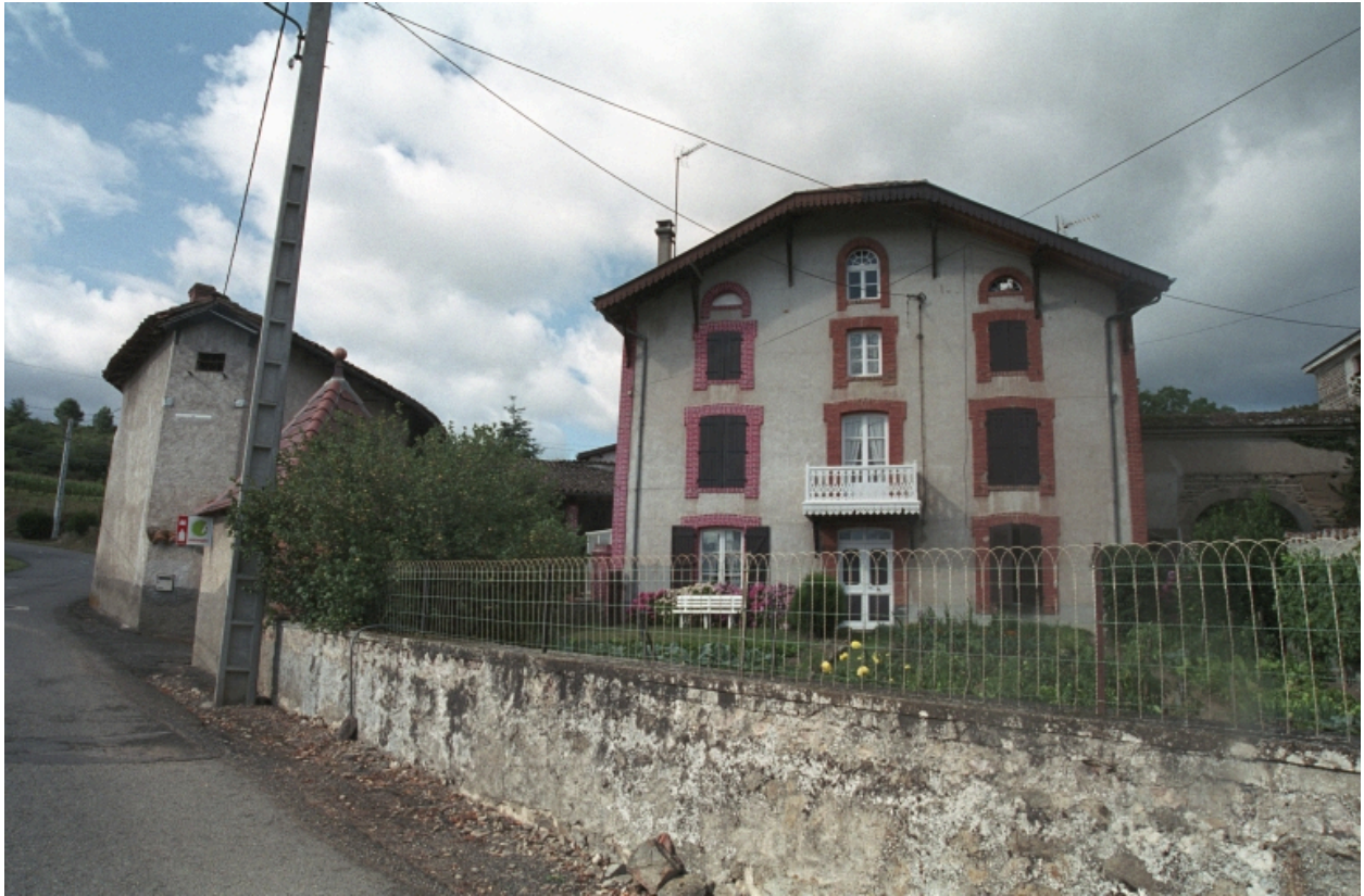
Aux Genettes, maison d'industriel (?) (1986 A 217, 218). Bâtiment en pisé, avec encadrements et chaînage d'angle en brique, toit à croupe. Vue d'ensemble de face.