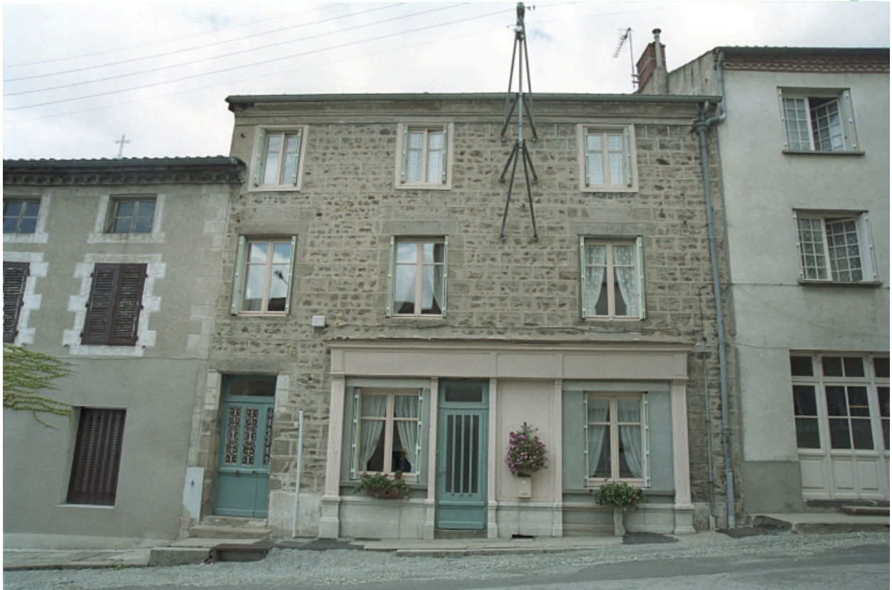
Au Bourg, maison avec ancien commerce au rez-de-chaussée, devanture en bois (1986 C2 701). Bâtiment maçonné non enduit, encadrements en pierre et bois à l'étage de combles, corniche en brique enduite. Vue d'ensemble de l'élévation sur rue.