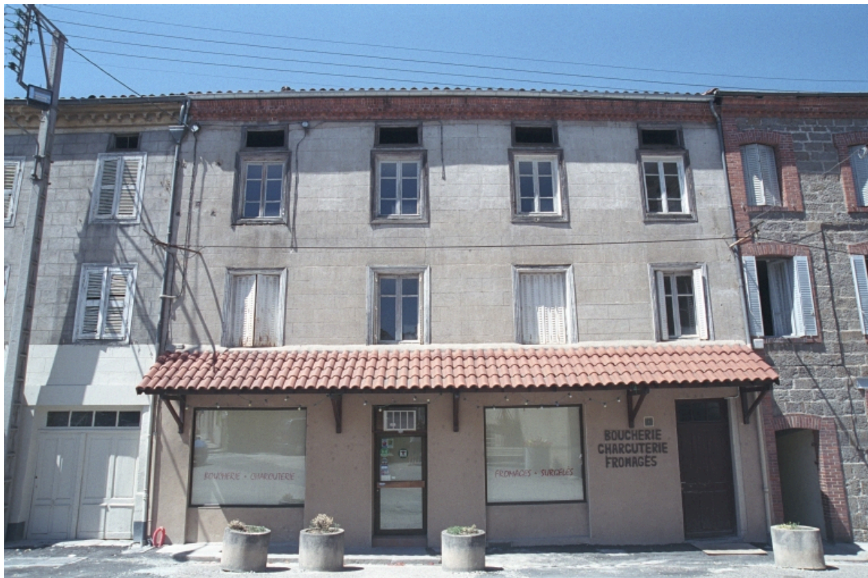
Au Bourg, maison avec commerce (1986 C2 724). Bâtiment avec enduit à faux appareillage et génoise. Vue d'ensemble de face donnant sur la place de l'église.