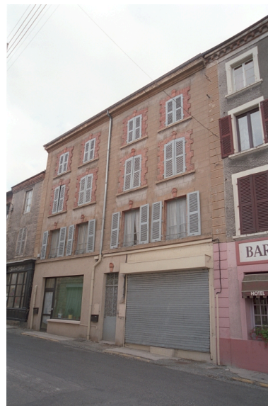
Maison du bourg avec commerce au rez-de-chaussée (1986 C2 697). Vue d'ensemble de la façade sur rue.

Phot. Thierry Monnet IVR82_20034200883ZE