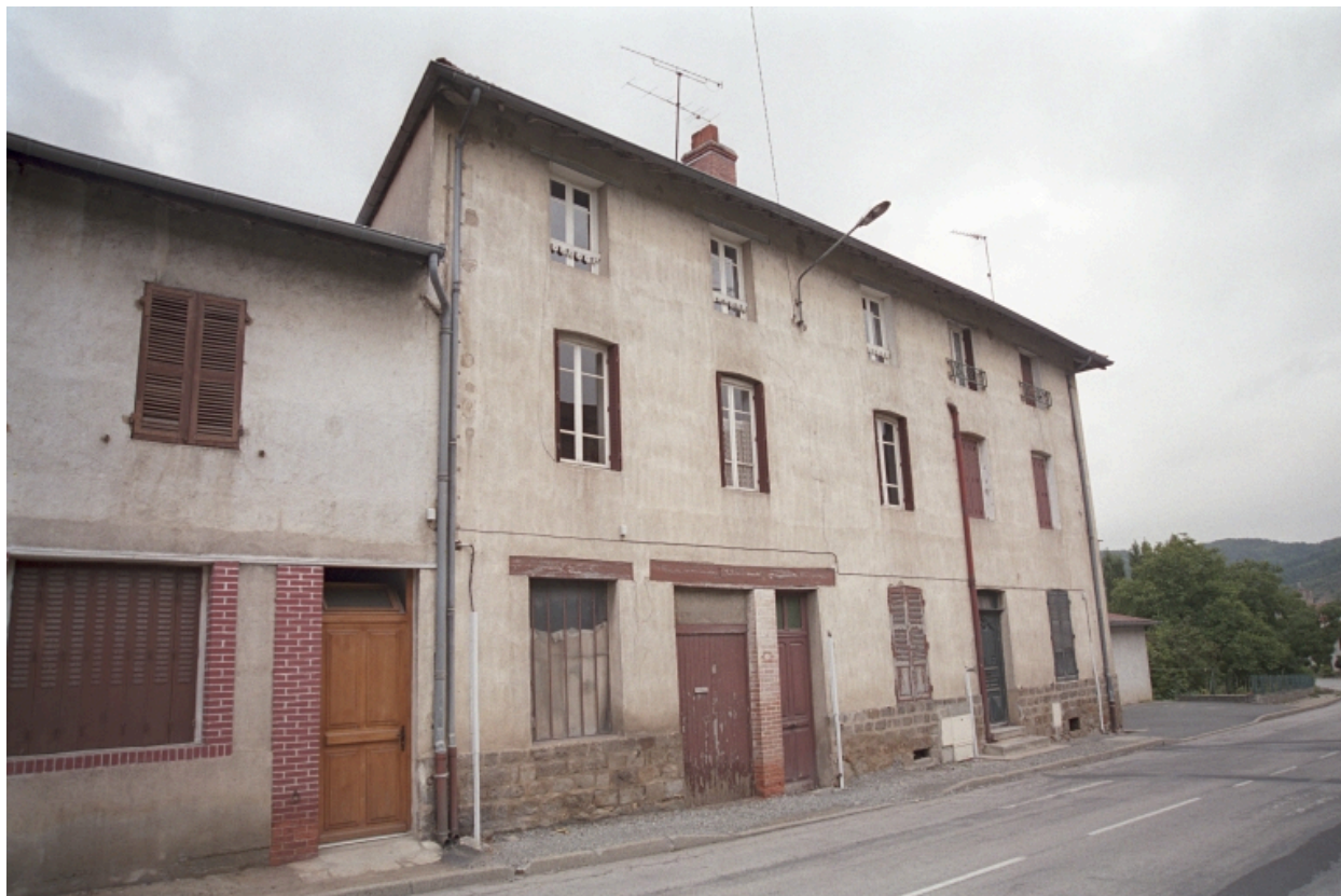
Croix Besson, maison et commerce (1986 B2 1012, 1013). Bâtiment en pisé enduit ; rez-de-chaussée modifié. Vue d'ensemble de trois-quarts latérale gauche.