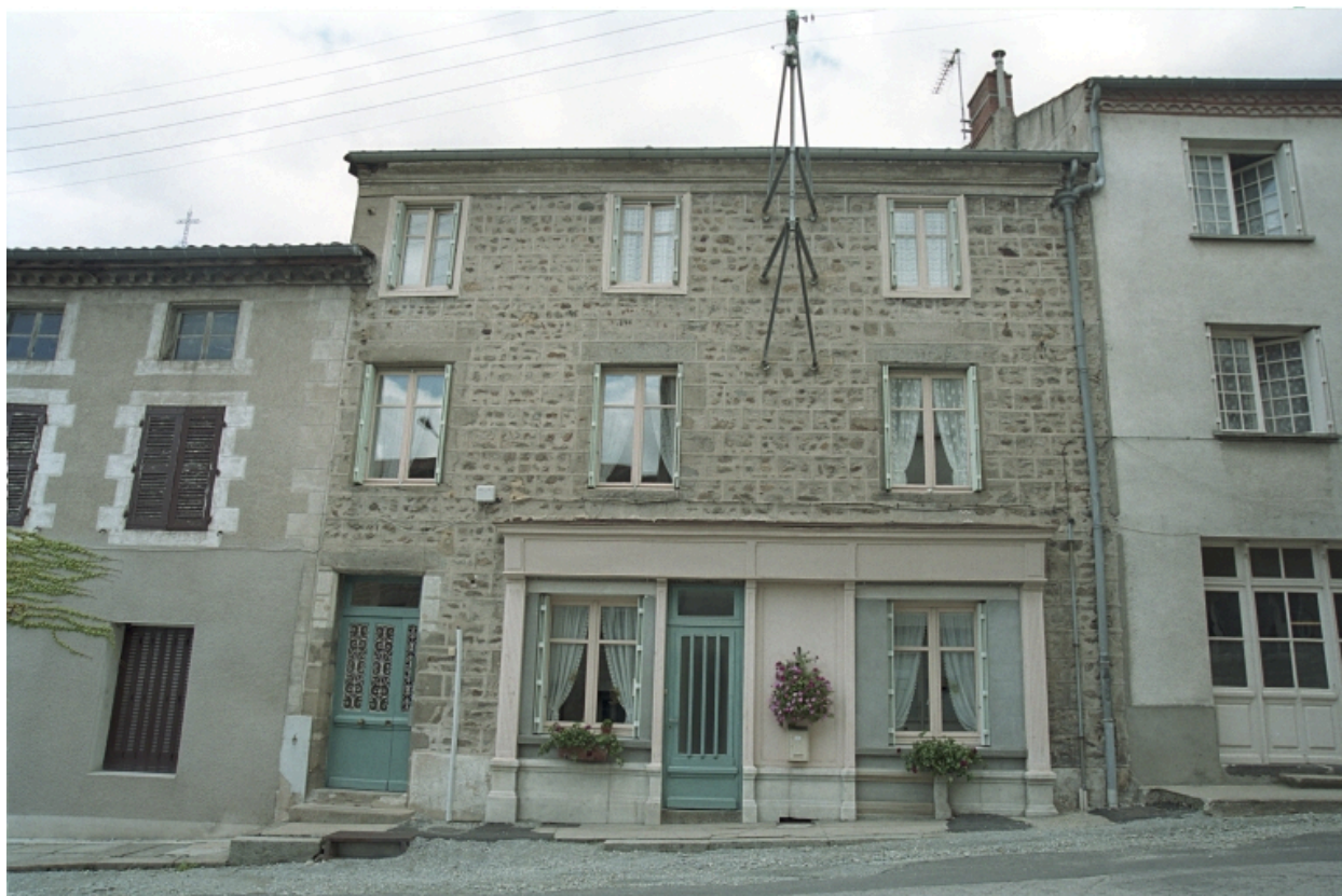
Au Bourg, maison avec ancien commerce au rez-de-chaussée, devanture en bois (1986 C2 701). Bâtiment maçonné non enduit, encadrements en pierre et bois à l'étage de combles, corniche en brique enduite. Vue d'ensemble de l'élévation sur rue.