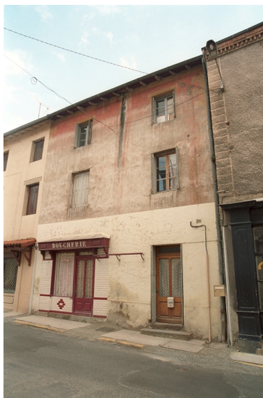
Le Bourg, Maison avec commerce alimentaire (1986 C2 709), vue d'ensemble. IVR82_20034200920ZE