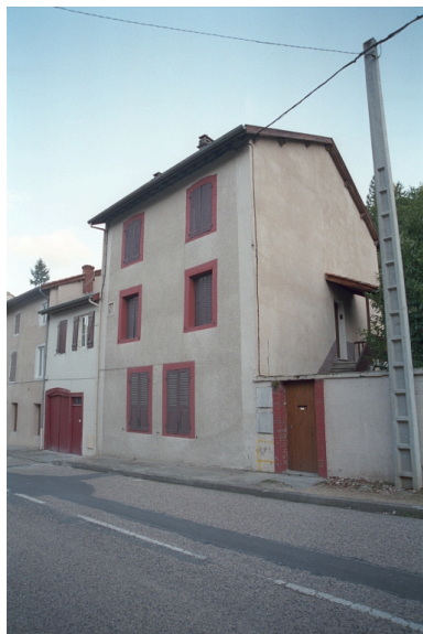
La Font Fort, maison (1986 C2 1386). Bâtiment à encadrements en brique. Vue d'ensemble de trois-quarts droit. IVR82_20034200788ZE