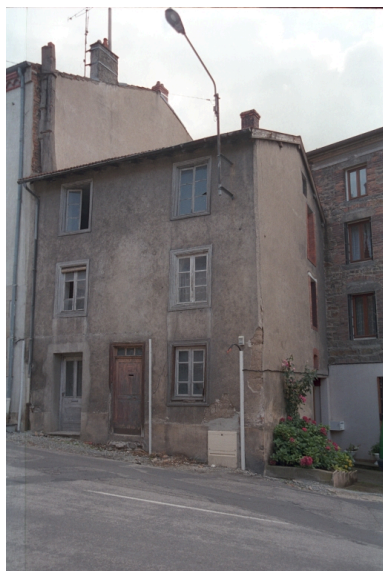
Le Bourg, maison (1986 C2 702), vue d'ensemble de trois-quarts. IVR82_20034200919ZE