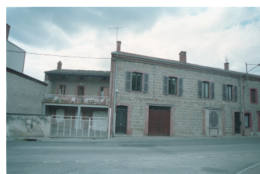
Vue d'ensemble de la façade de la maison depuis la route.

IVR82_20034200739ZE