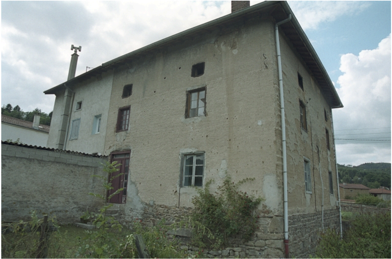
Au Trève, ferme, vue d'ensemble avant droite de trois-quart (1986 C2 962 à 964).