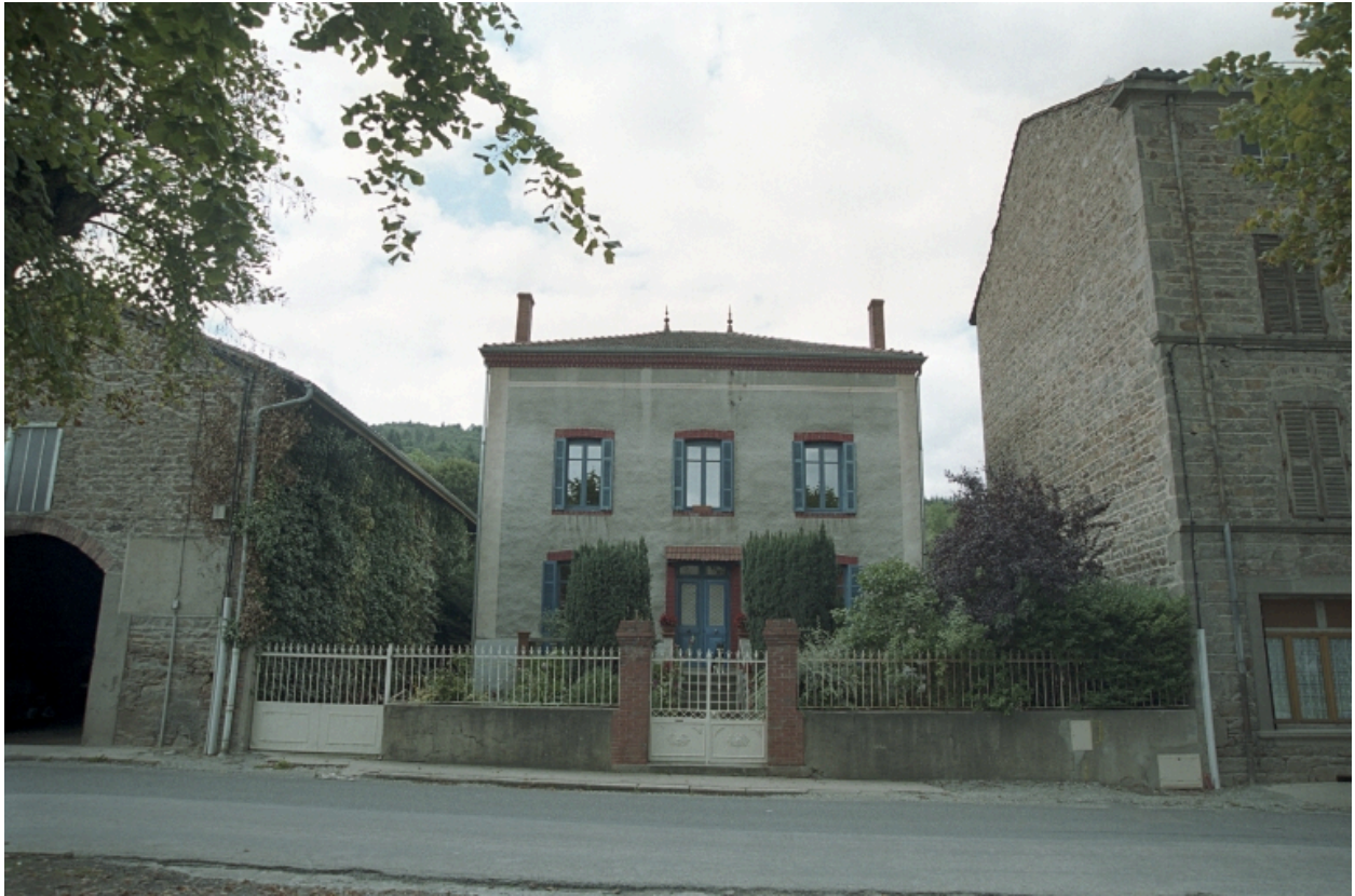
Maison d'industriel au Bourg (1986 B2 945). Vue d'ensemble de face.