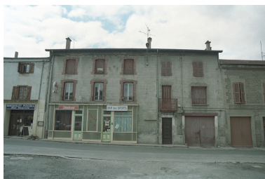
Aux Promenades, maison et commerce (1986 B2 953). Bâtiment à encadrements de brique dans sa partie gauche, enduite ciment avec faux appareillage gravé, partie droite de l'édifice plus récente. Vue d'ensemble de face.

IVR82_20034200871ZE