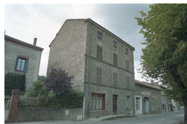
Aux Promenades, immeuble (1986 B2 1183). Bâtiment maçonné, corniche en pierre de taille, façade avec deux cordons en pierre ; baie gauche du rez-de-chaussée remaniée. Vue d'ensemble de trois-quarts gauche.

IVR82_20034200885ZE