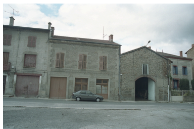
Aux Promenades, maison avec commerce (1986 B2 950). Bâtiment en moellons avec chaîne d'angle en pierre de taille, corniche en brique enduite. Vue d'ensemble de face.

IVR82_20034200791ZE