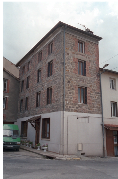
Au Bourg, immeuble (1986 C2 703, 704). Bâtiment en moellons avec baie à encadrements en brique et pierre de taille, arc de décharge, corniche en brique enduite, chaîne d'angle en brique. Vue d'ensemble de trois-quart.

IVR82_20034200888ZE