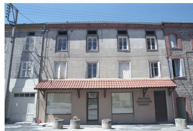
Au Bourg, maison avec commerce (1986 C2 724). Bâtiment avec enduit à faux appareillage et génoise. Vue d'ensemble de face donnant sur la place de l'église. IVR82_20034201946ZE