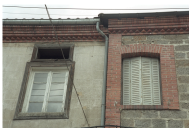
Au Bourg, maison avec commerce (1986 C2 725). Bâtiment en moellons avec chaîne d'angle et corniche en brique. Détail des baies et corniches.

IVR82_20034200777ZE