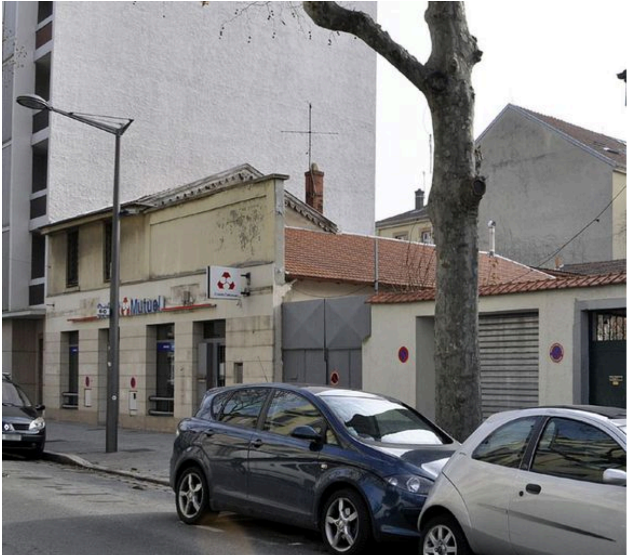
Vue sur les façades latérales