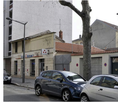
Vue sur les façades latérales IVR82_20106900862NUCA