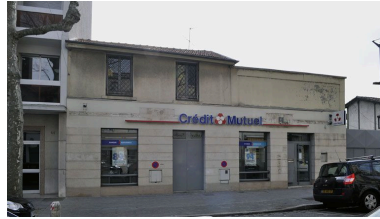
Vue générale IVR82_20106900860NUCA