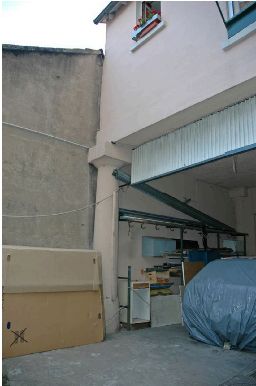
Loge de concierge. Angle sud-ouest reposant sur une colonne en pierre