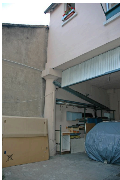
Loge de concierge. Angle sud-ouest reposant sur une colonne en pierre IVR82_20076900305NUCA