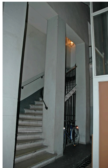
Départ de l'escalier IVR82_20076900309NUCA