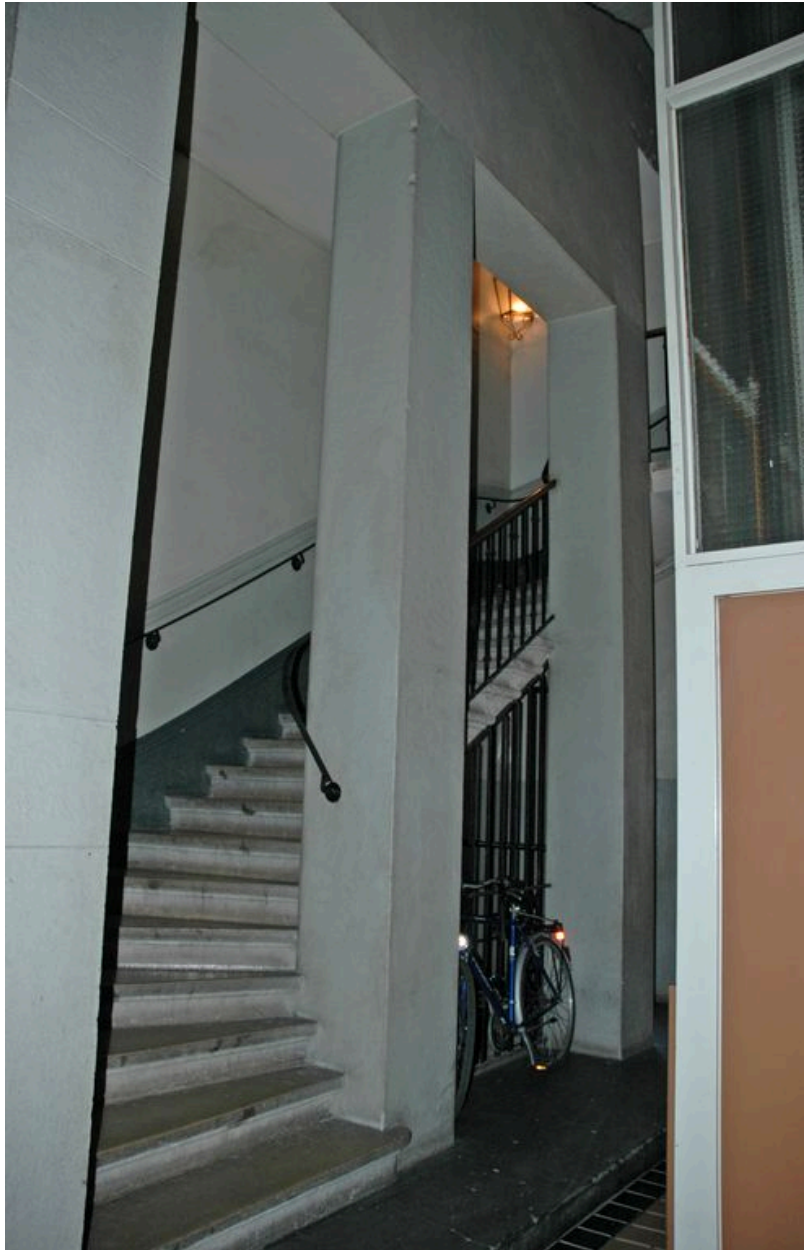
Départ de l'escalier