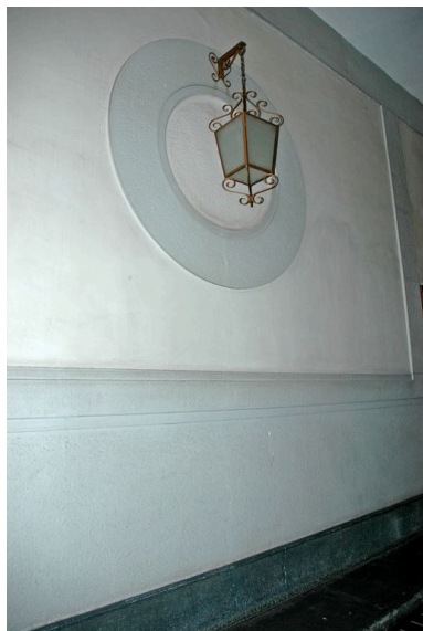
Détail de l'applique du passage d'entrée