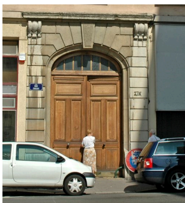
Portail d'entrée IVR82_20076900304NUCA