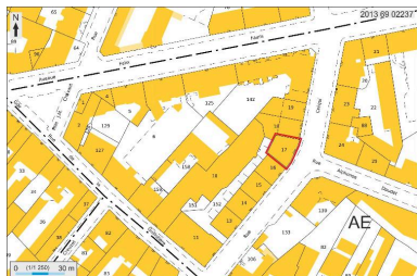
Plan masse et de situation, extrait de http://cadastre.gouv.fr IVR82_20136902237NUDA