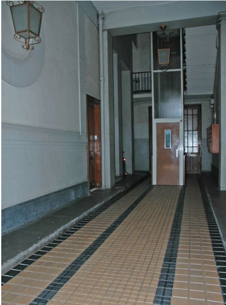
Passage d'entrée. Vue vers la cour