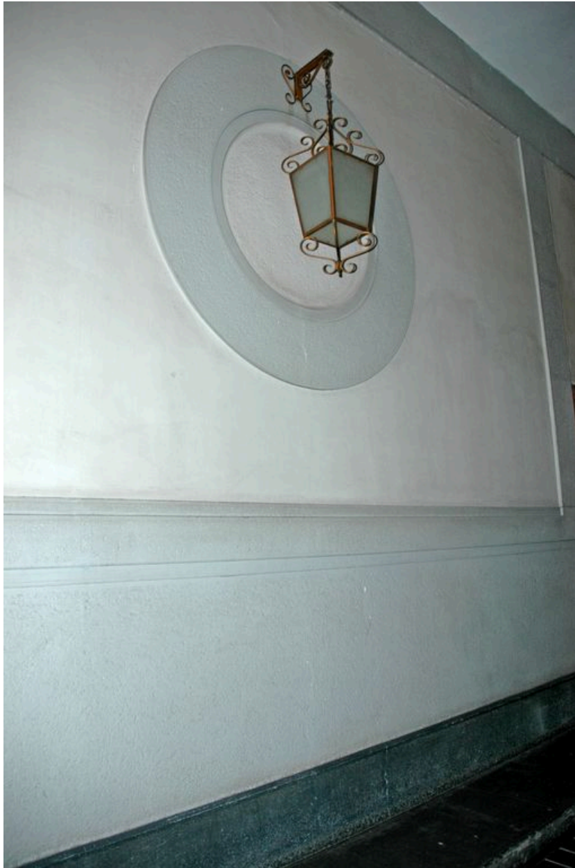
Détail de l'applique du passage d'entrée