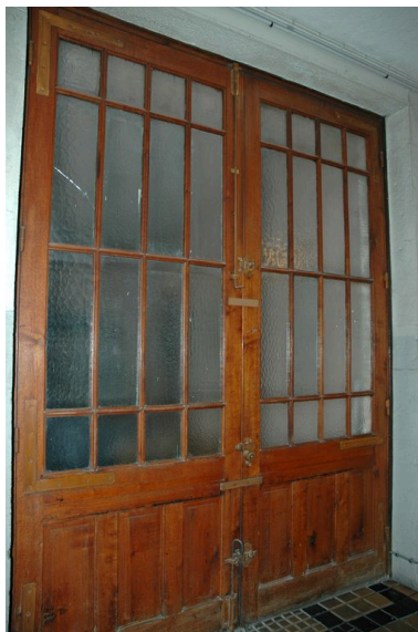
Porte ouvrant sur la cour IVR82_20076900308NUCA