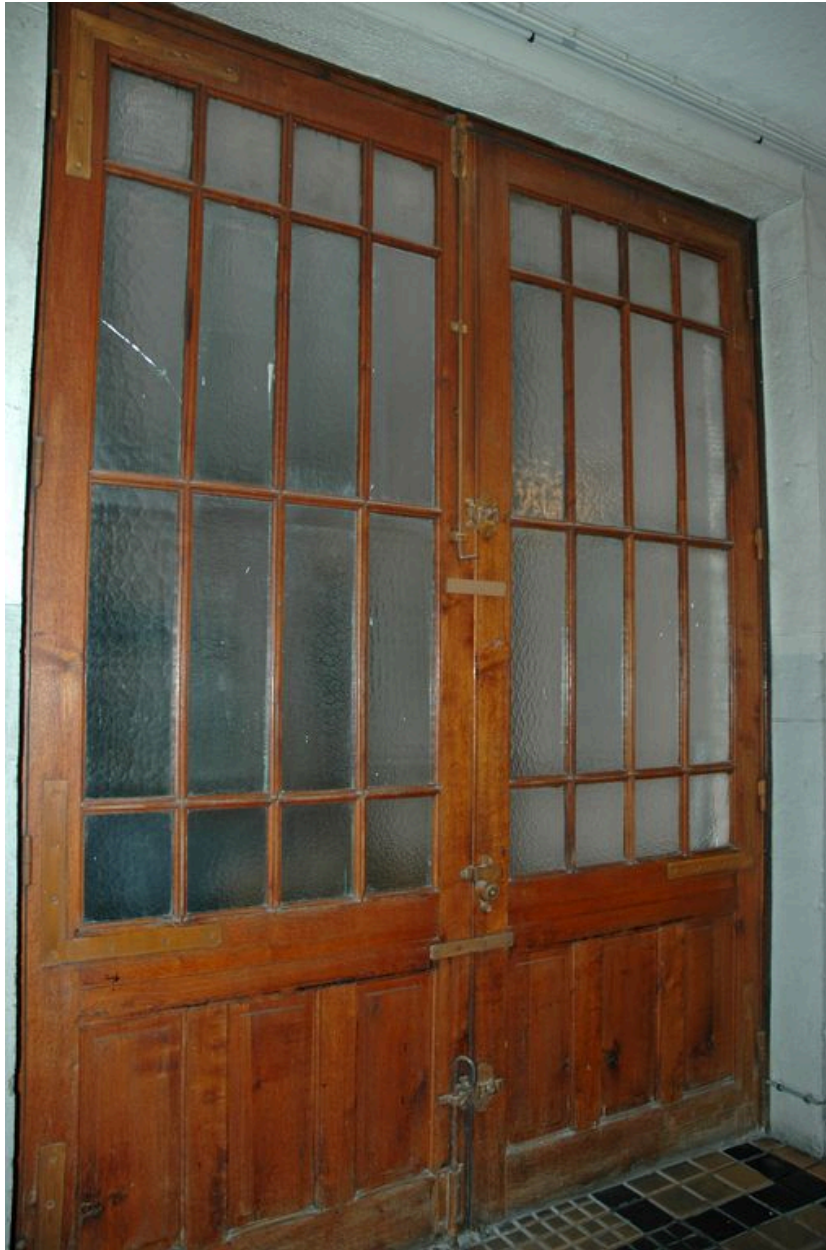
Porte ouvrant sur la cour