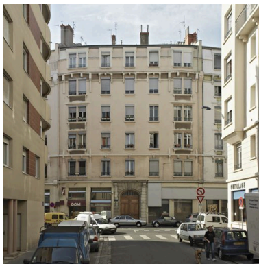
Vue générale IVR82_20076901358NUCA