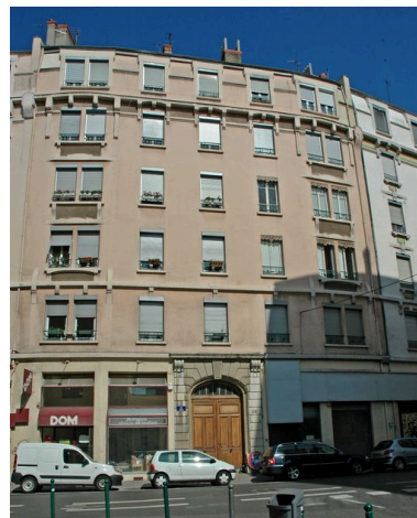
Elévation principale IVR82_20076900303NUCA