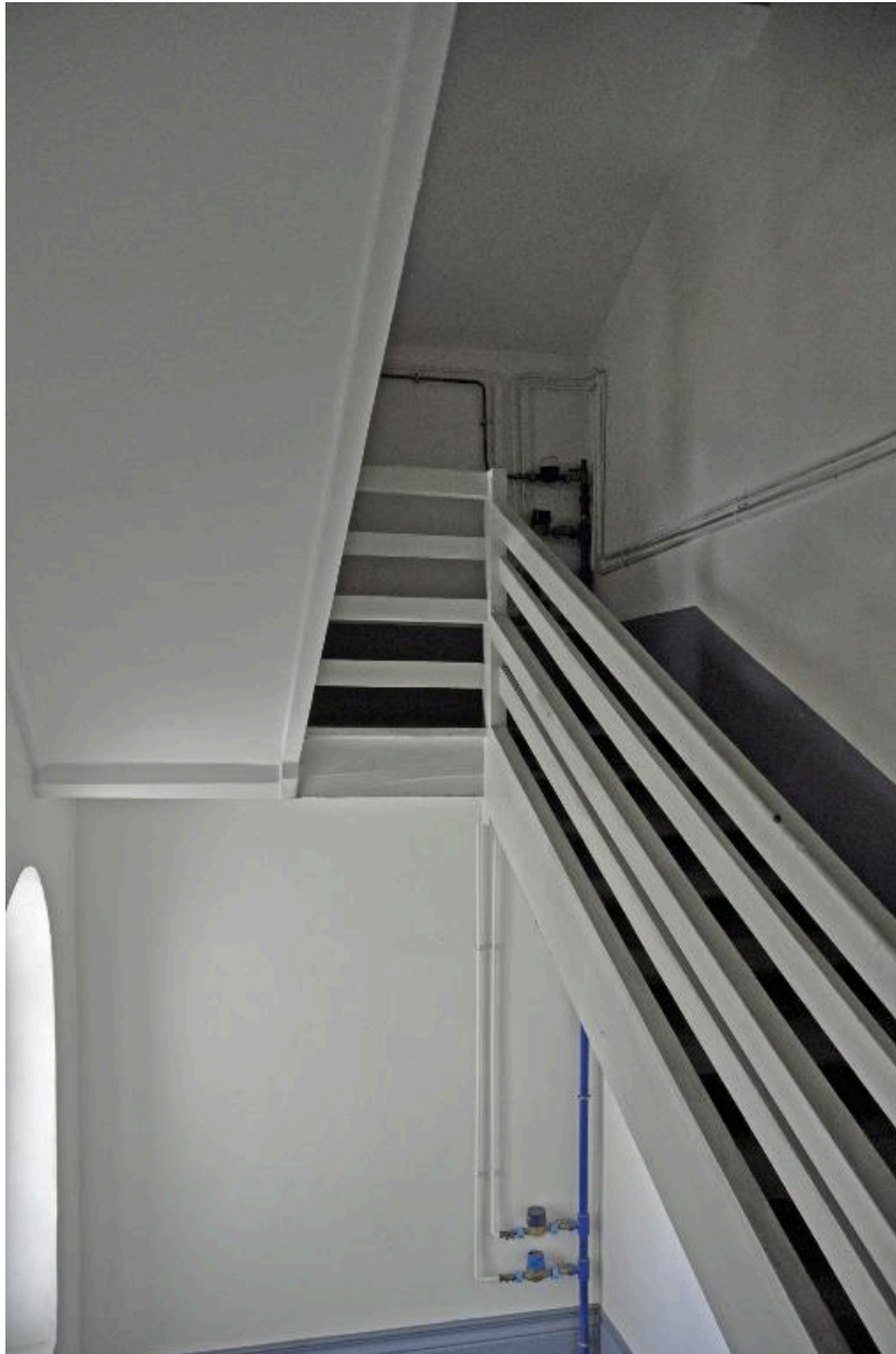
Vue de la dernière volée de l'escalier