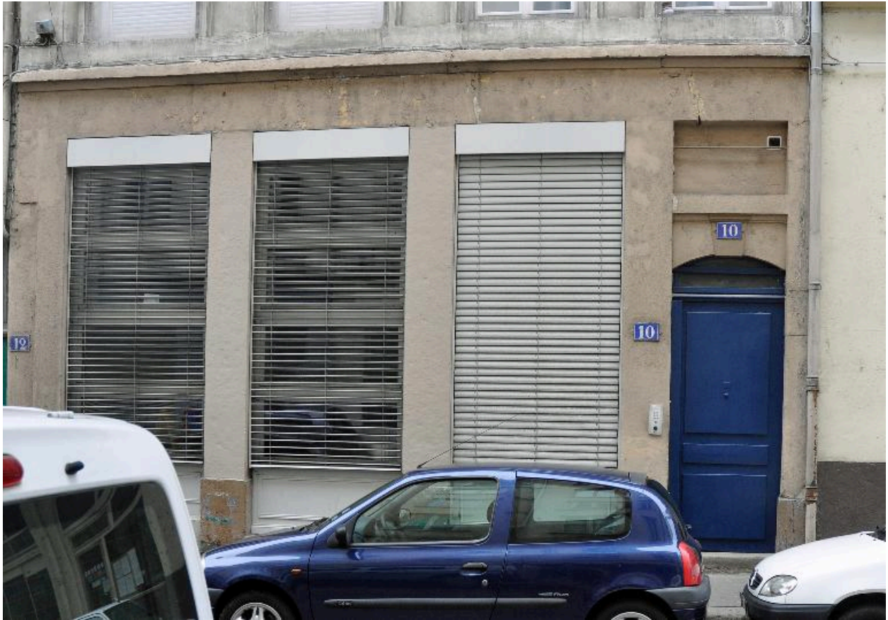
Vue rapprochée du rez-de-chaussée