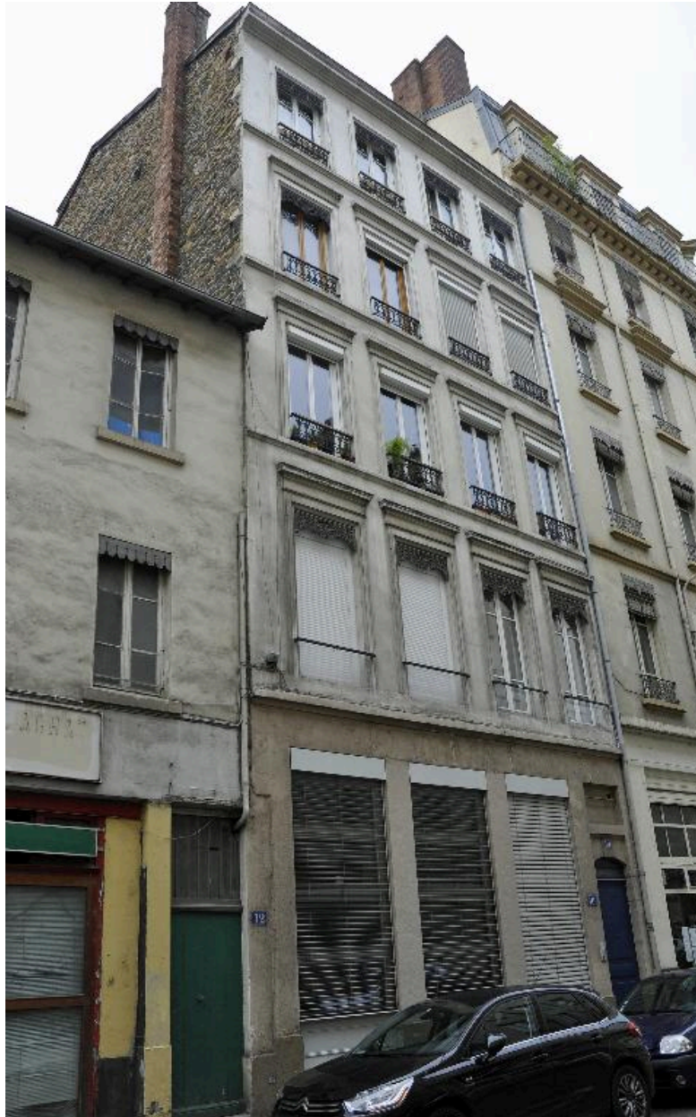
Vue d'ensemble de l'élévation sur rue