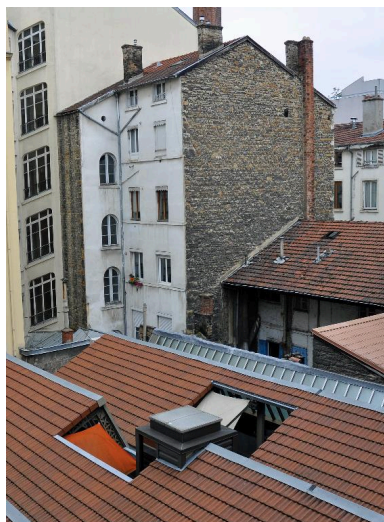
Vue d'ensemble, depuis la cour IVR82_20146902936NUCA