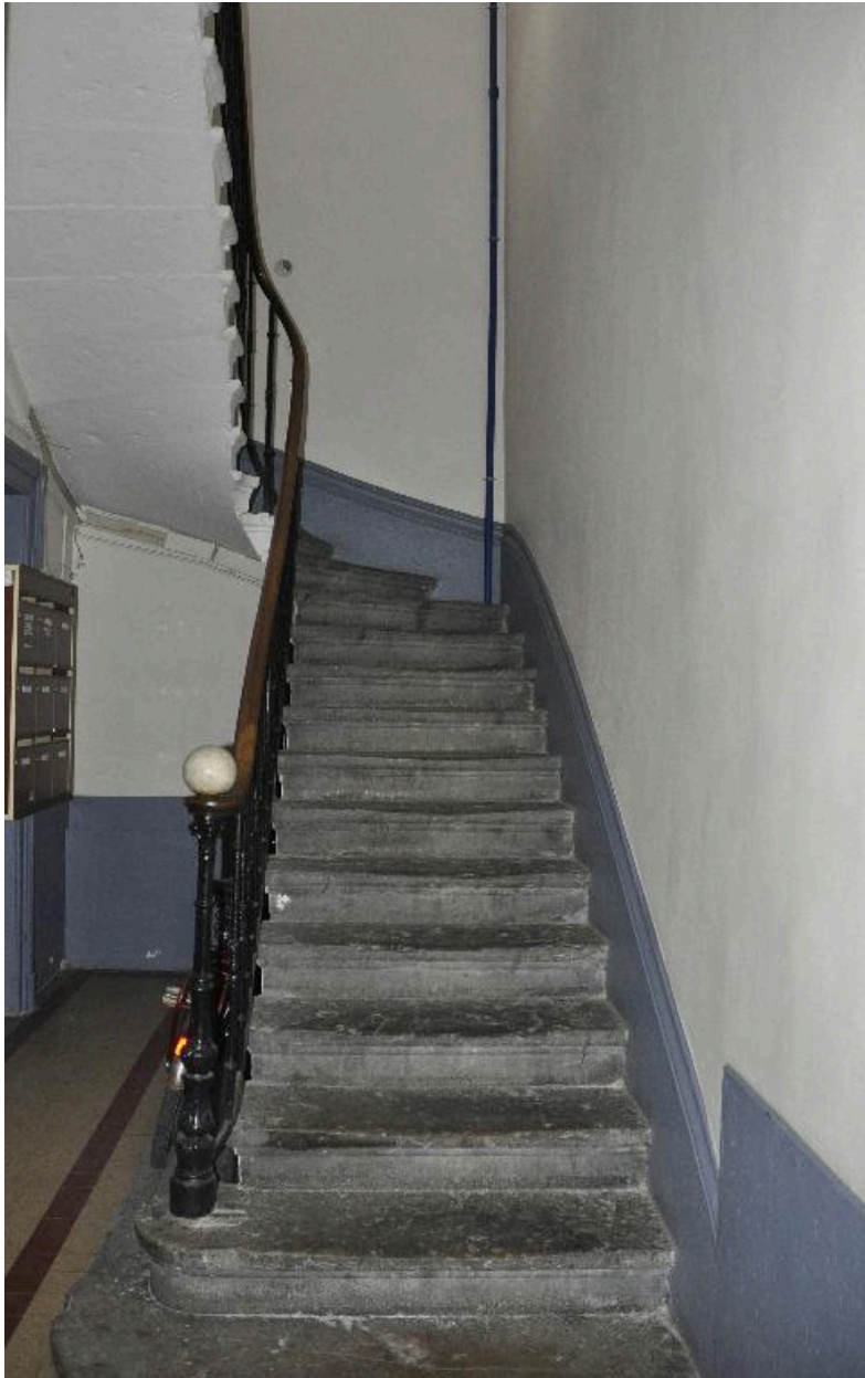
Vue de l'escalier