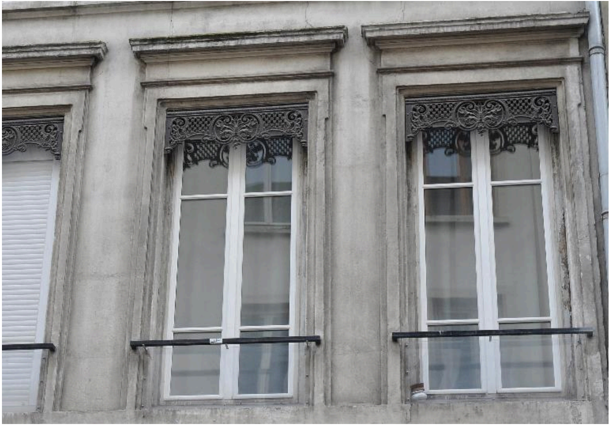
Vue rapprochée des fenêtres