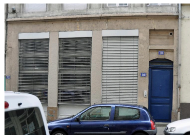
Vue rapprochée du rez-de-chaussée IVR82_20146902938NUCA