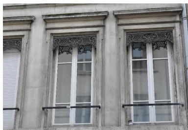
Vue rapprochée des fenêtres IVR82_20146902939NUCA