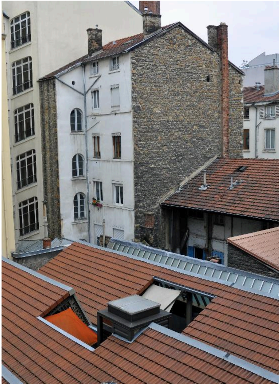
Vue d'ensemble, depuis la cour