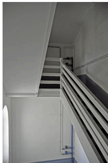
Vue de la dernière volée de l'escalier IVR82_20146902941NUCA