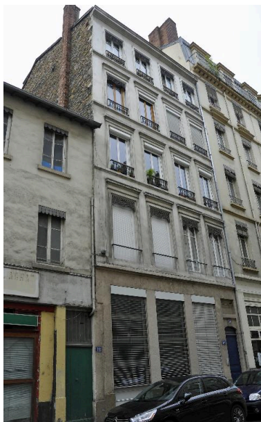
Vue d'ensemble de l'élévation sur rue IVR82_20146902937NUCA