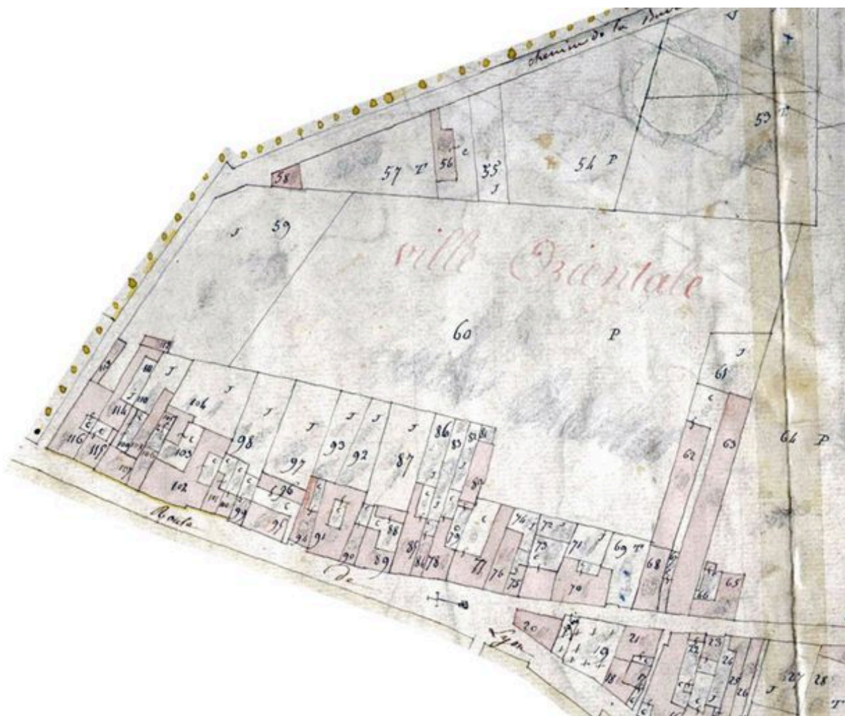
Plan cadastral de 1824. Extrait