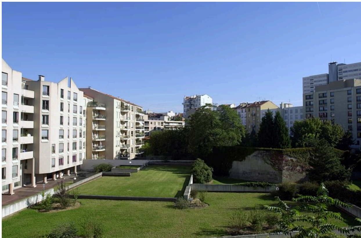
Vue du jardin