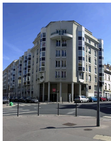
Vue générale IVR82_20096901105NUCA