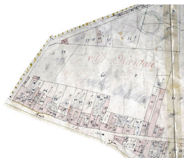
Plan cadastral de 1824. Extrait