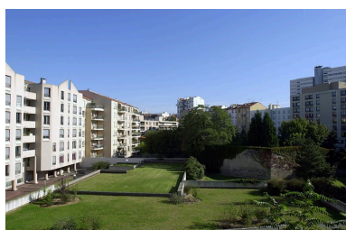
Vue du jardin IVR82_20116904918NUCA