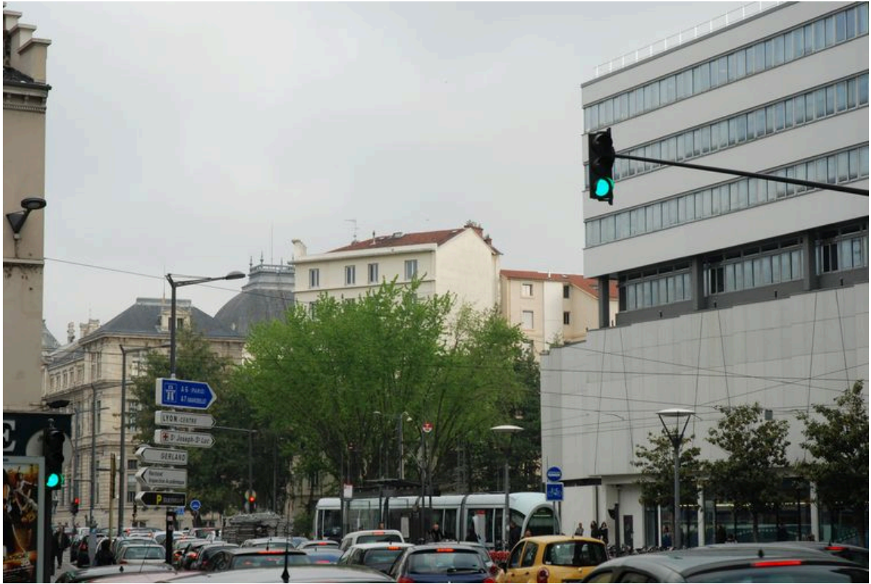
Vue du départ de la rue de l'Université (place Depéret), montrant la circulation et le tramway