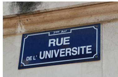
Plaque de la rue de l'Université, à l'angle nord-ouest du croisement avec la rue Cavenne. IVR82_20136903038NUCA