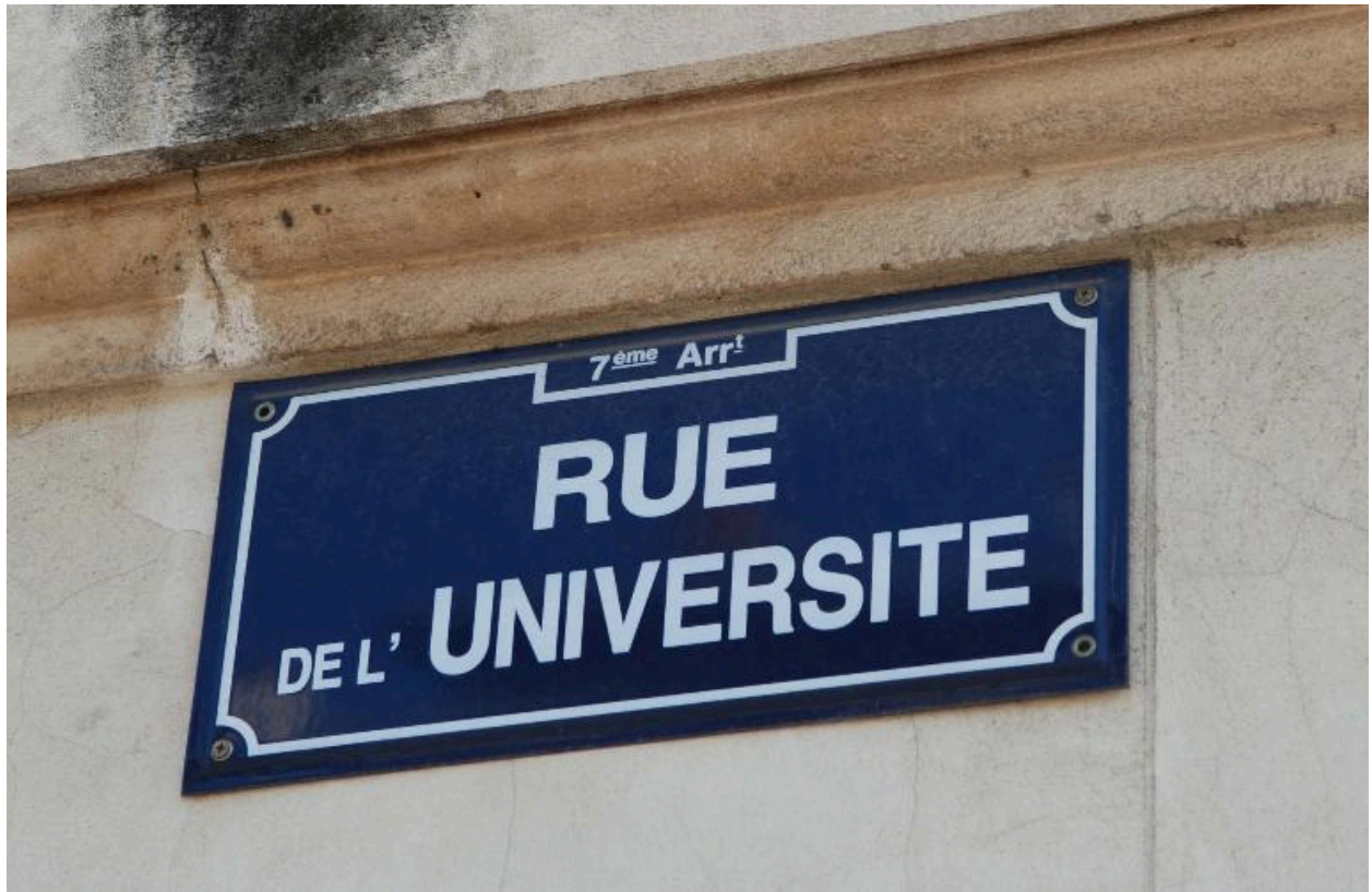
Plaque de la rue de l'Université, à l'angle nord-ouest du croisement avec la rue Cavenne.