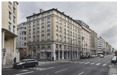
Vue de la rue de l'Université, en direction du nord (au droit du n°43) IVR84_20186901178NUCAQ