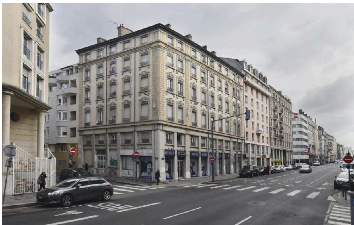
Vue de la rue de l'Université, en direction du nord (au droit du n°43)