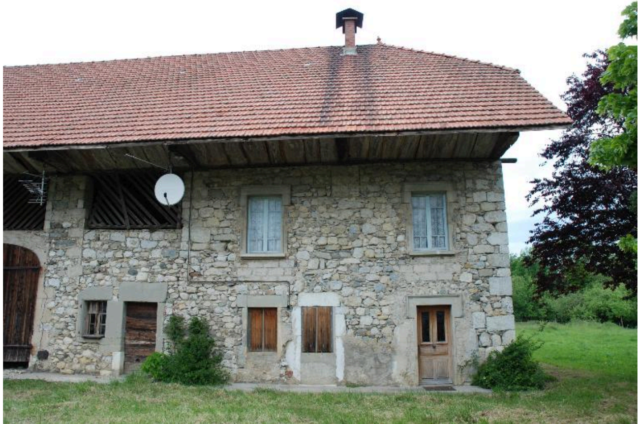
Vue d'ensemble de la partie habitation.