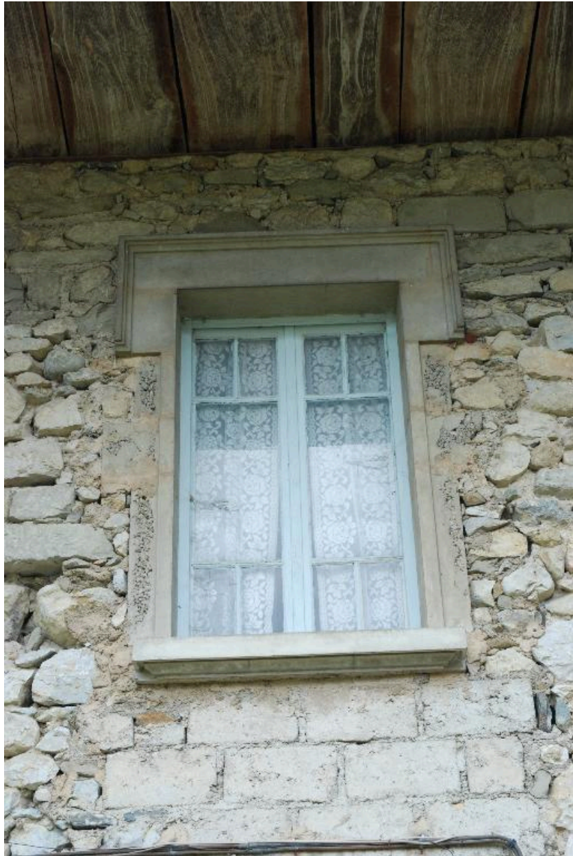
Détail : fenêtre de l'habitation.