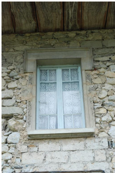
Détail : fenêtre de l'habitation. IVR82_20157303088NUCA