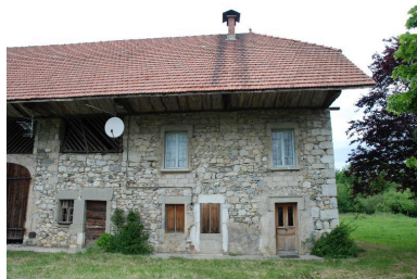
Vue d'ensemble de la partie habitation.