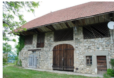
Vue de la partie grange-étable. IVR82_20157303087NUCA