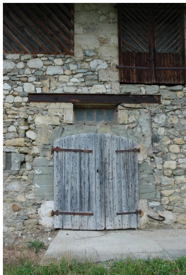
Détail : porte de l'étable.