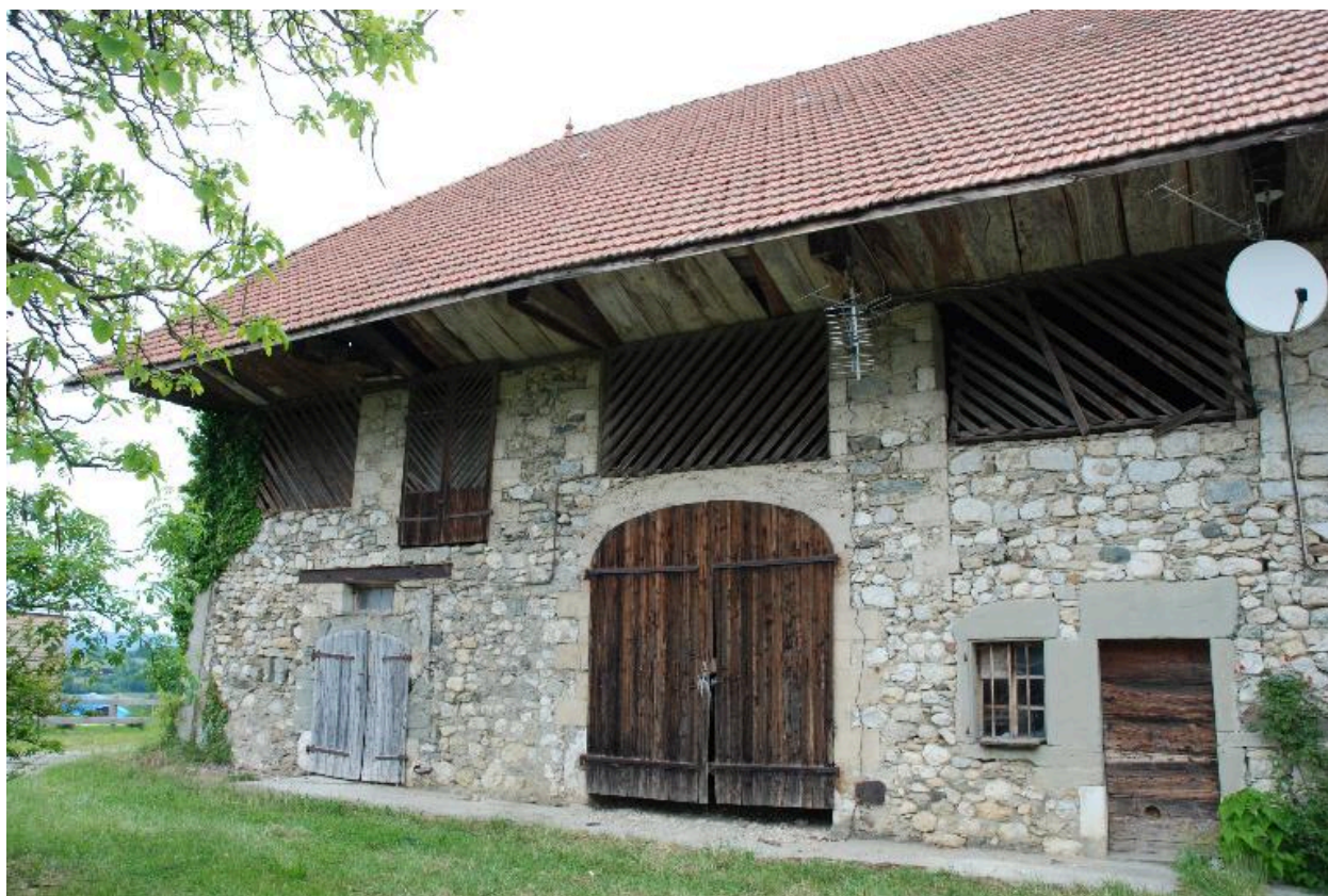
Vue de la partie grange-étable.