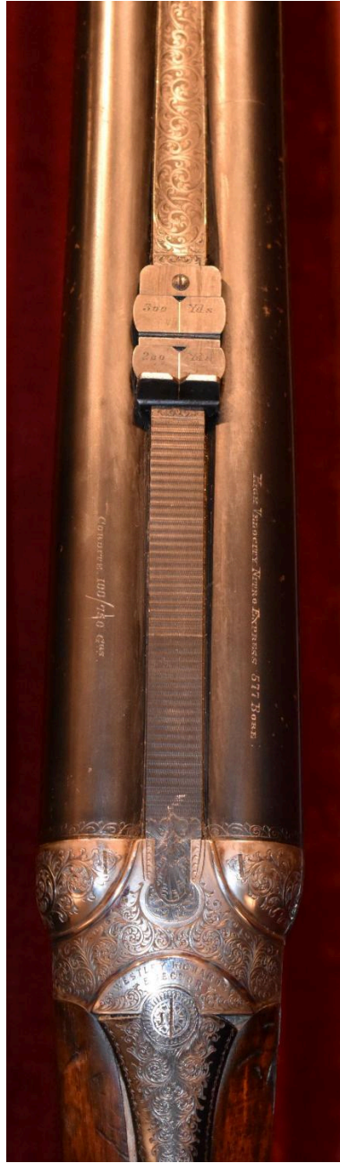
Détail inscriptions