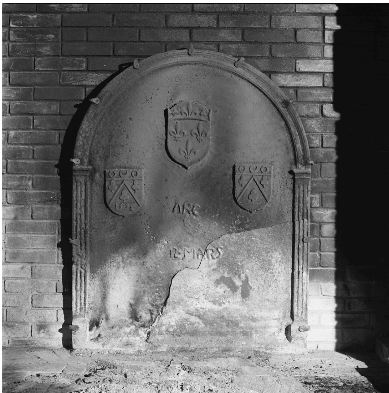
1e étage, plaque de la cheminée de la grande salle.