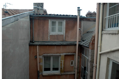
Derniers étages et ciel ouvert sur courette IVR82_20086902962NUCA