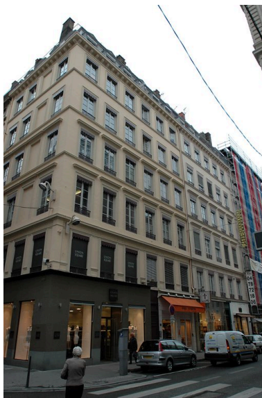
Élévation rue de Brest IVR82_20086902959NUCA