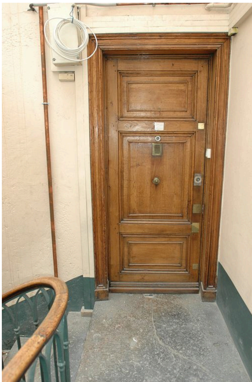
Porte palière du dernier étage