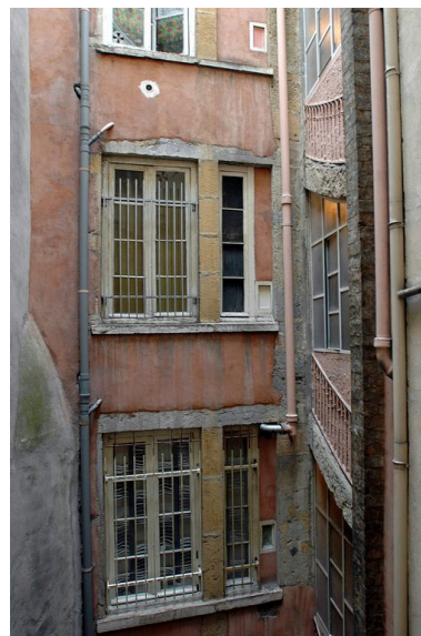
Élévations sur courette IVR82_20086902961NUCA