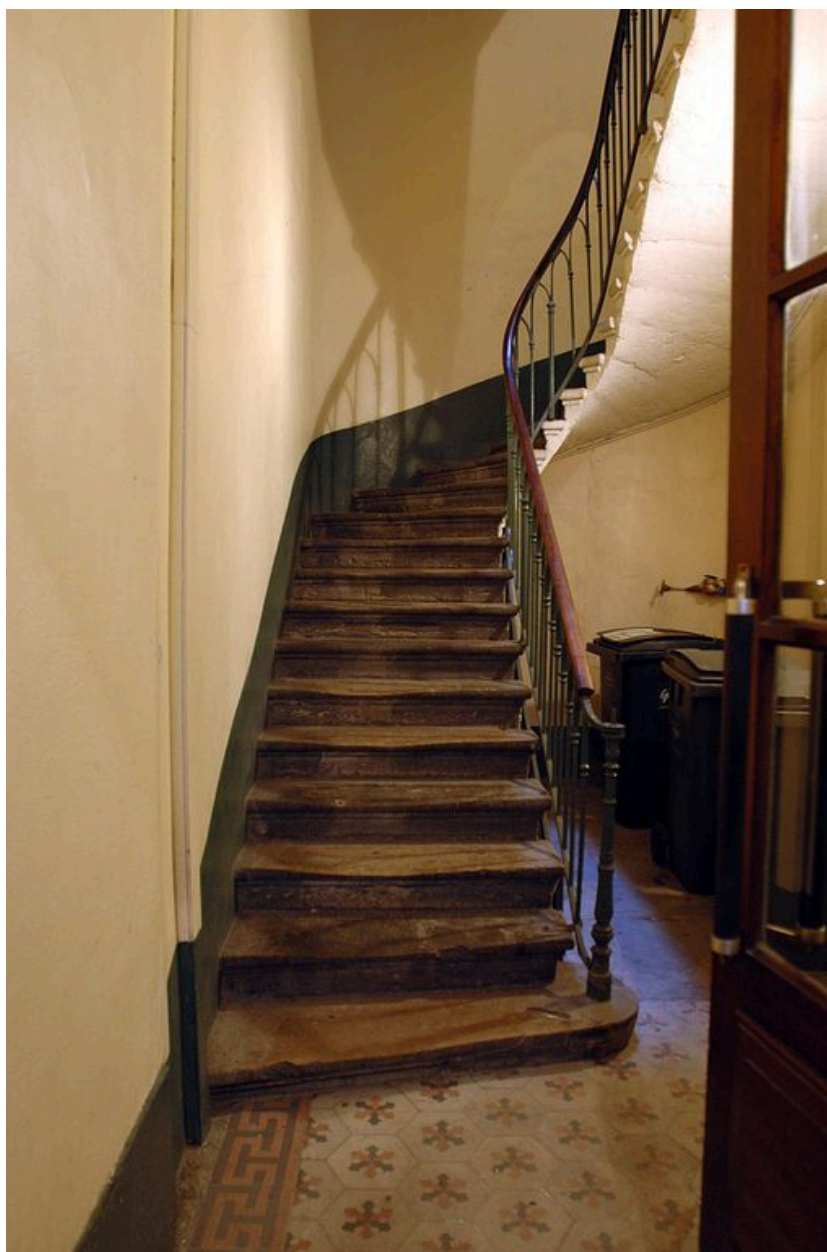
Départ d'escalier et revêtement de sol