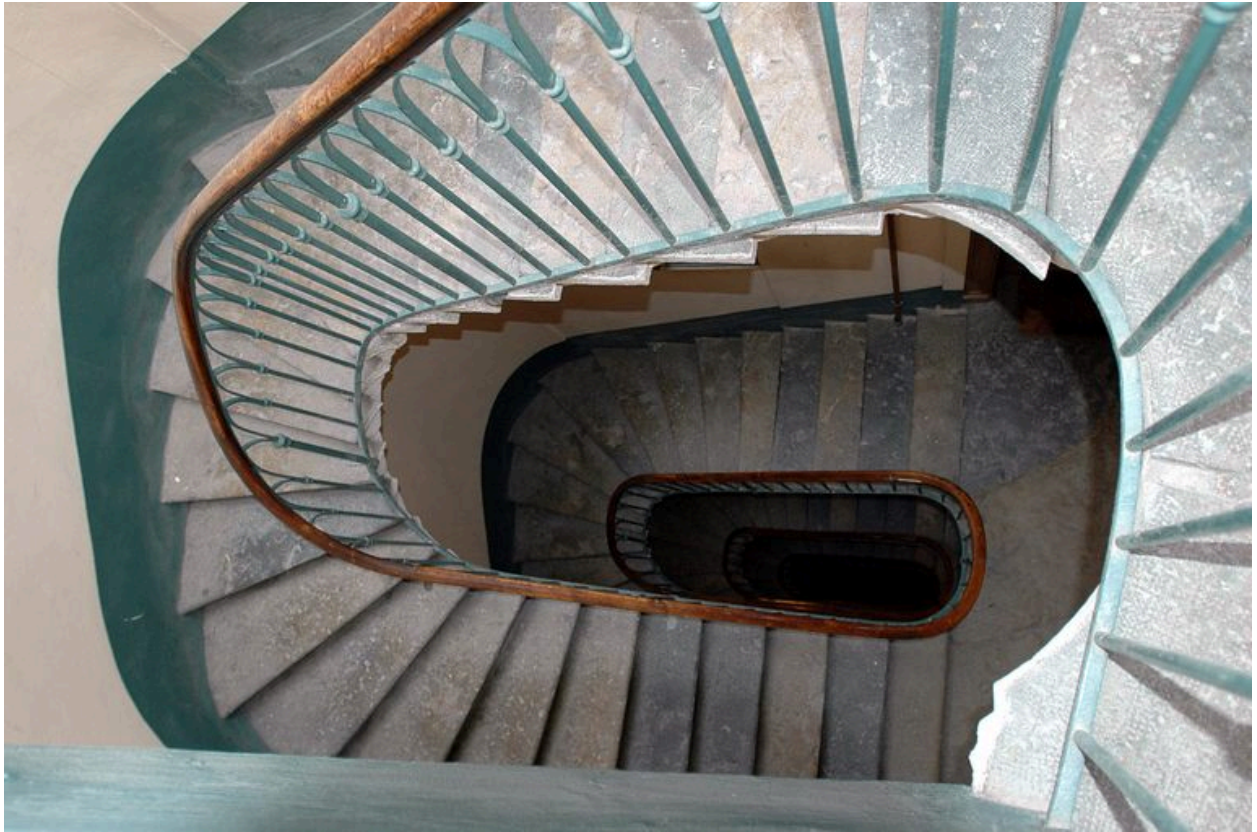
L'escalier en plongée