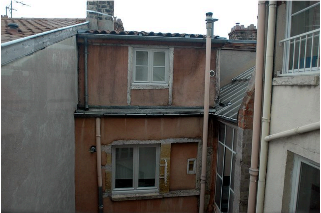
Derniers étages et ciel ouvert sur courette