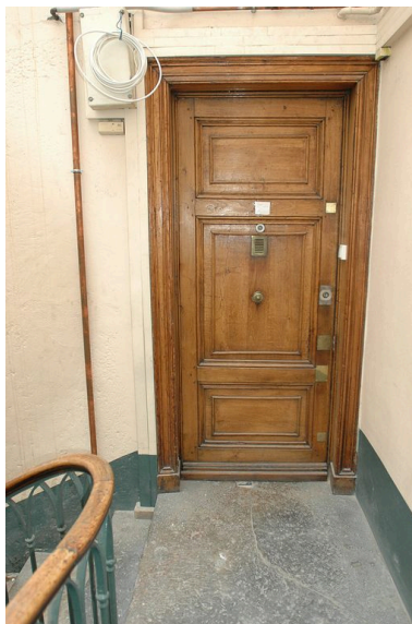
Porte palière du dernier étage IVR82_20086902966NUCA