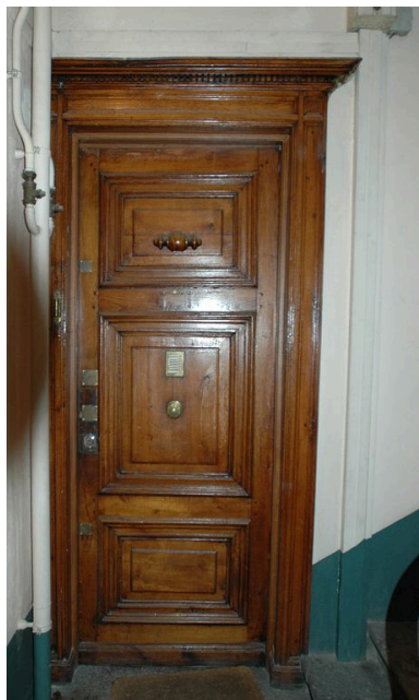
Porte palière