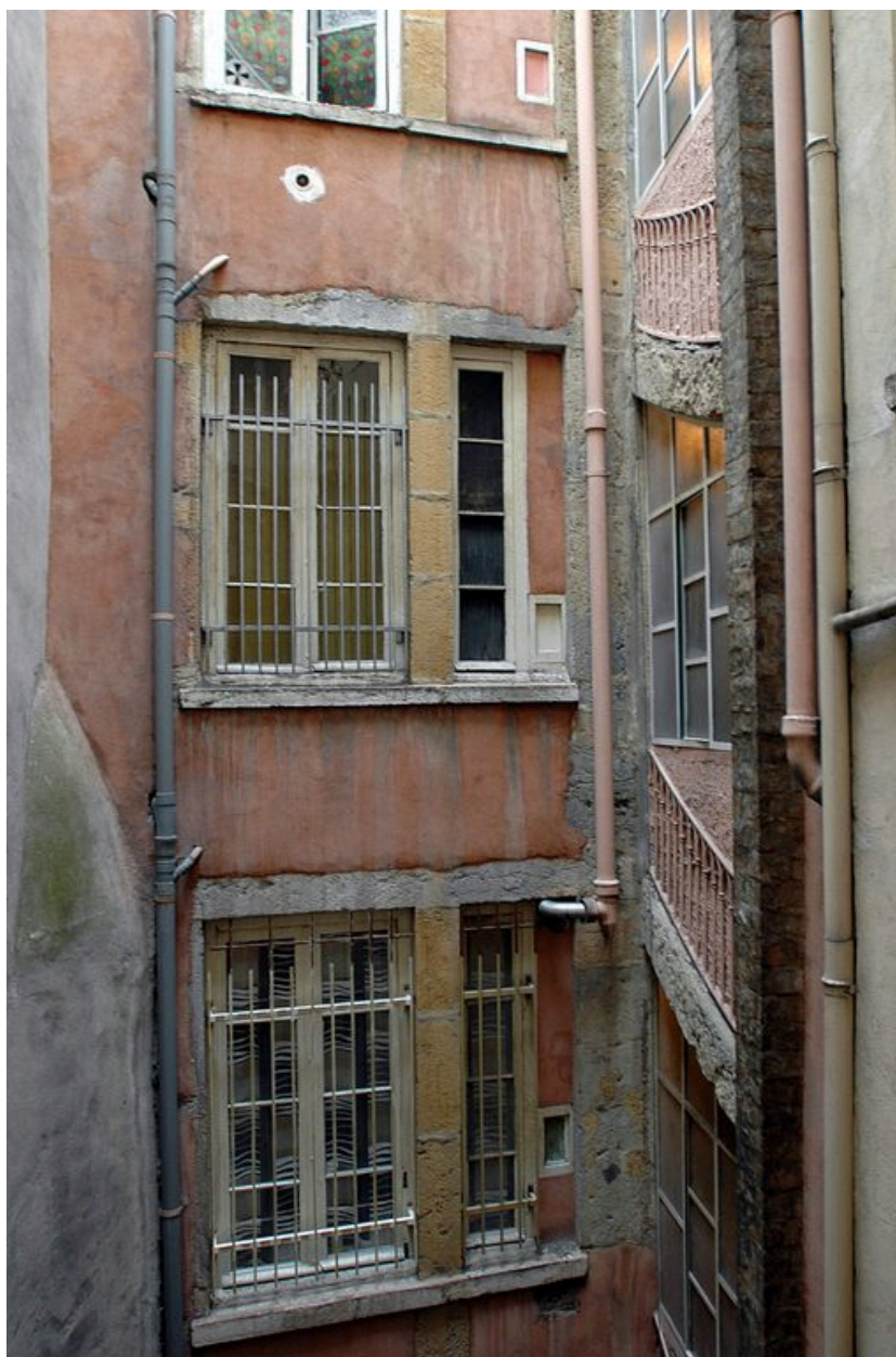
Elévations sur courette