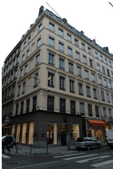
Vue générale IVR82_20086902960NUCA