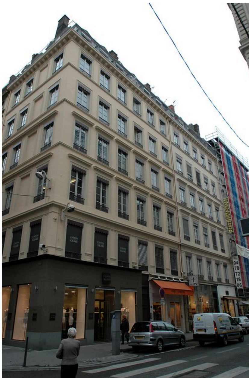
Elévation rue de Brest