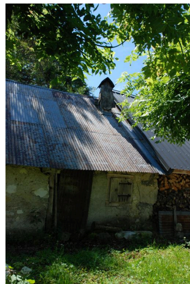
Vue de la façade principale, partie habitation. IVR84_20177301218NUCA