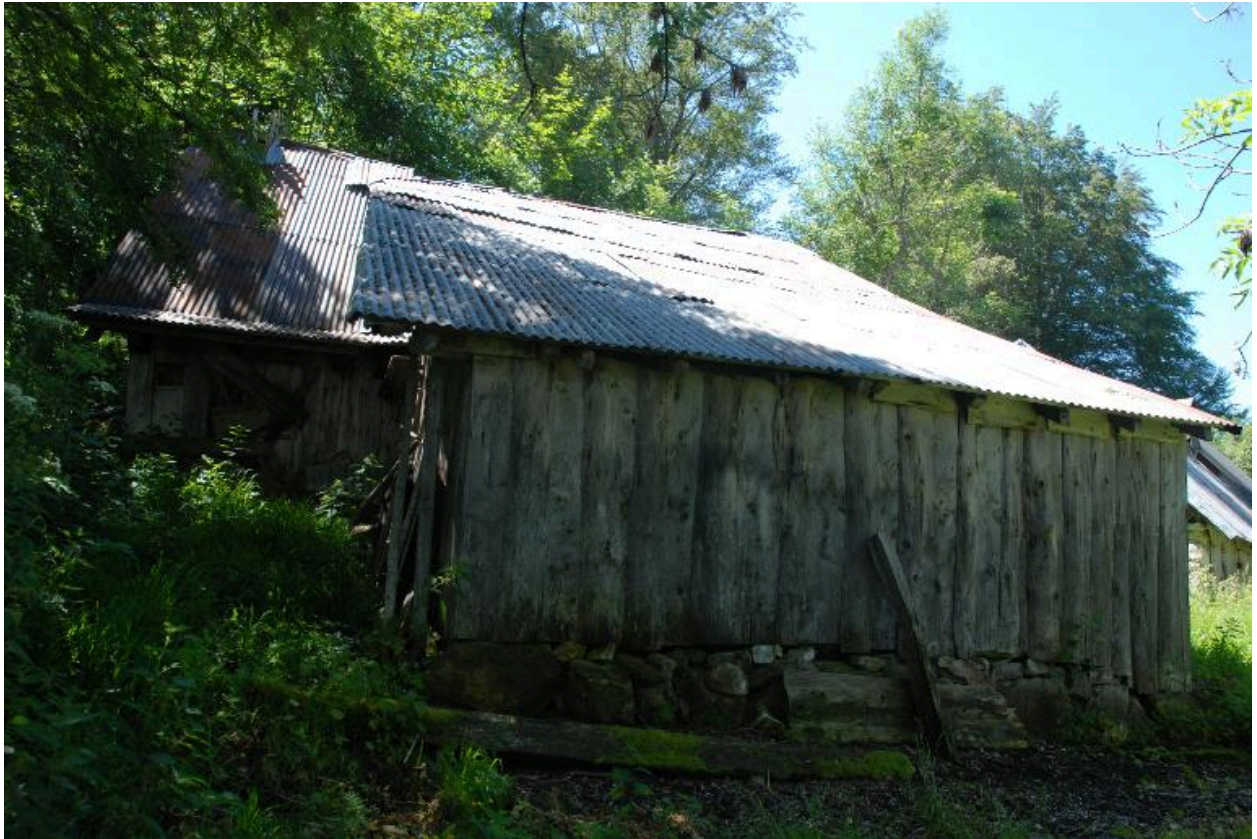
Vue de l'étable ou remise.