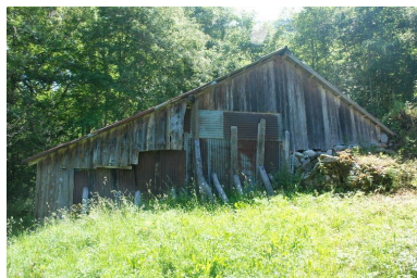
Vue de l'étable ou remise.