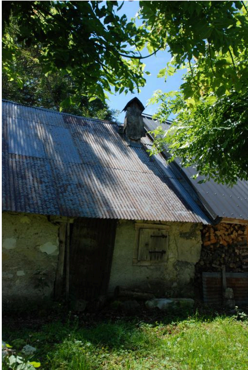
Vue de la façade principale, partie habitation.