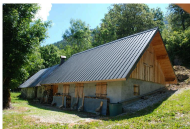
Vue d'ensemble depuis l'est (au premier plan, chalet mitoyen).