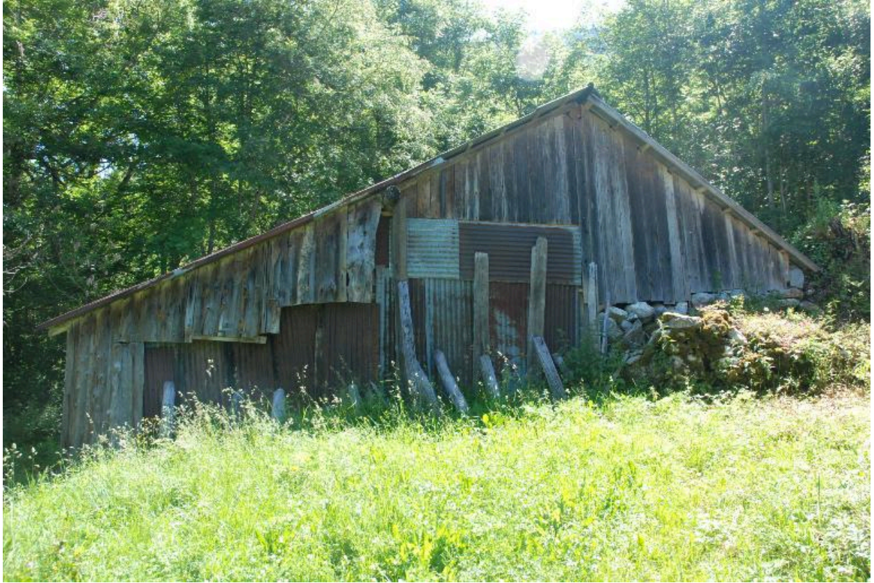
Vue de l'étable ou remise.