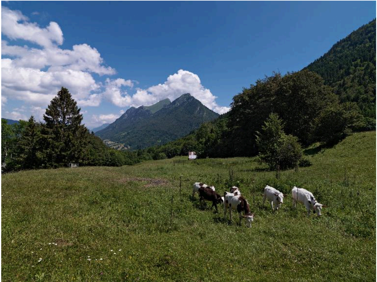
Vue générale de l'alpage du Cernay (on aperçoit un chalet à droite). Au fond, le Colombier.