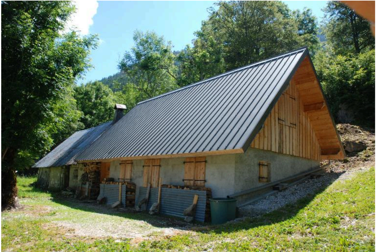
Vue d'ensemble depuis l'est (au premier plan, chalet mitoyen).