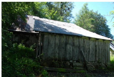
Vue de l'étable ou remise. IVR84_20177301219NUCA