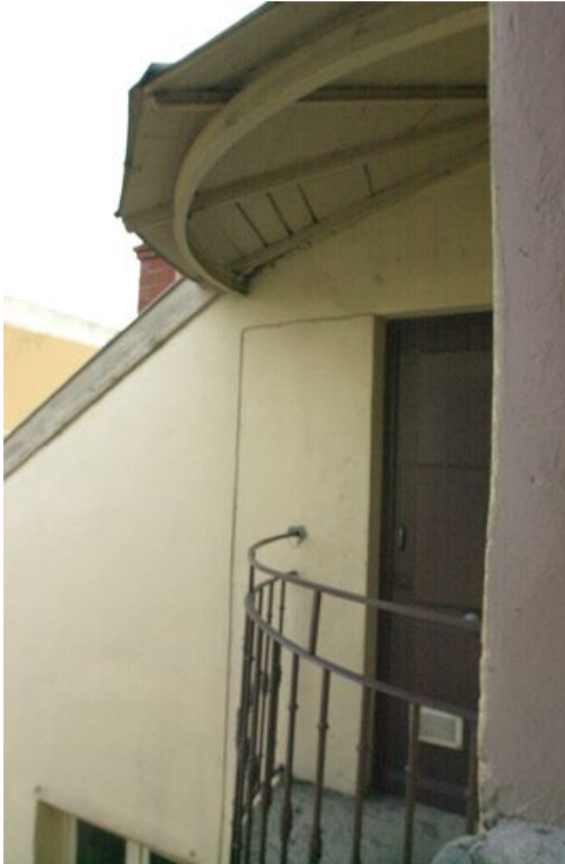
Détail de l'avant-toit au-dessus des balcons