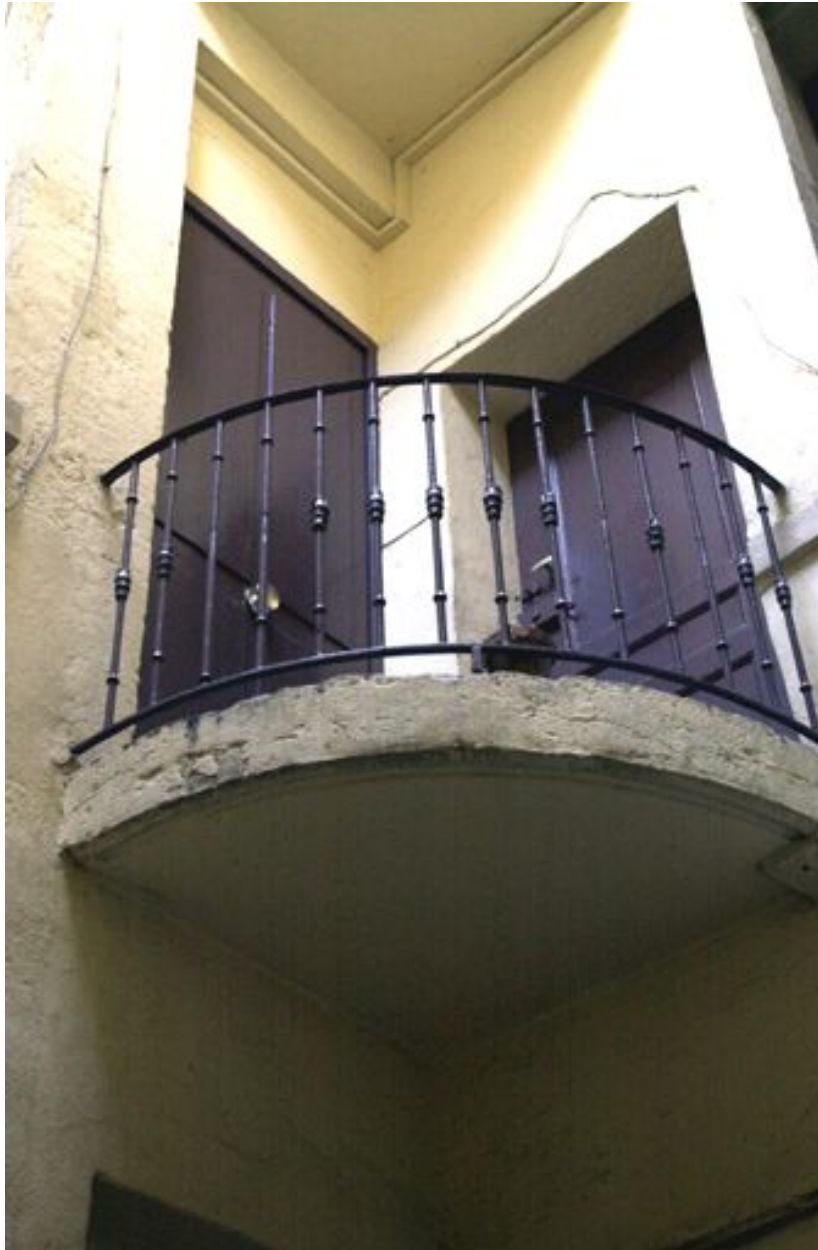
Détail d'un balcon