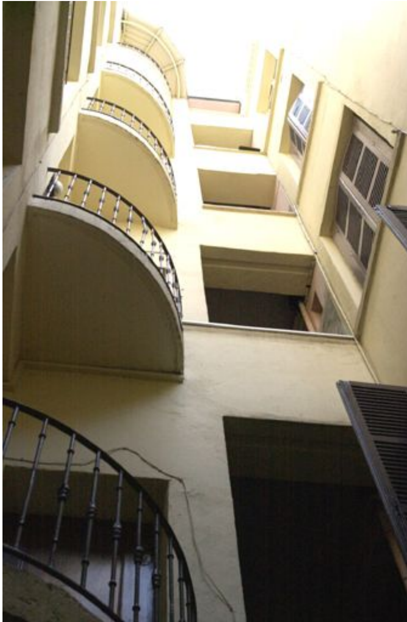
Vue de la cage d'escalier ouverte et des balcons distribuant les deux corps de bâtiment