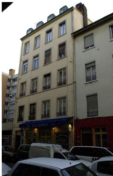
Vue générale IVR82_20016900123NUCA