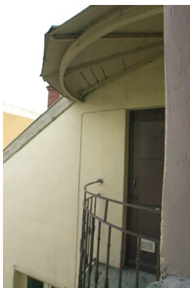
Détail de l'avant-toit au-dessus des balcons IVR82_20016900127NUCA