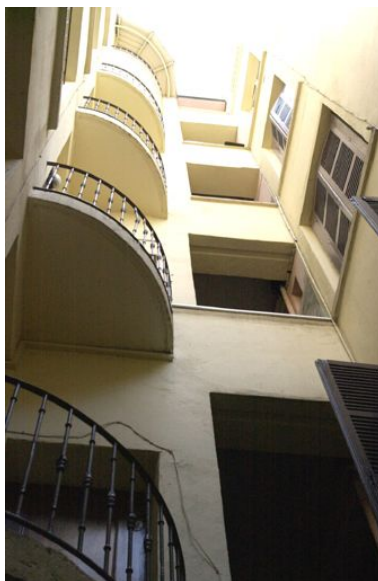
Vue de la cage d'escalier ouverte et des balcons distribués les deux corps de bâtiment IVR82_20016900126NUCA