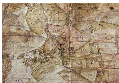
Cadastre de 1728, Châtelard (le), 1732 196, Vue 2 (FR.AD073, C2592). IVR84_20167302715NUCA