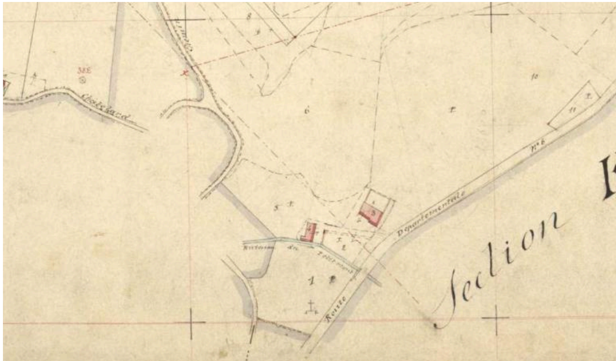
Premier cadastre français, Châtelard (le), 1882 Section F, feuille 2 (FR.AD073, 3P 7086).