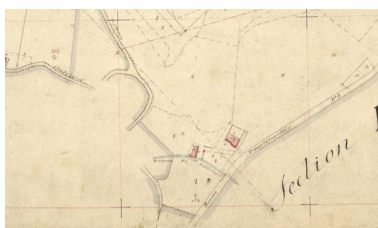
Premier cadastre français, Châtelard (le), 1882 Section F, feuille 2 (FR.AD073, 3P 7086). IVR84_20167302717NUCA