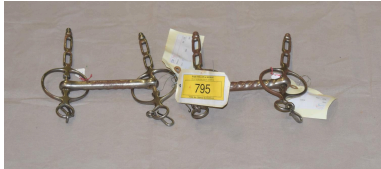
Vue générale IVR84_20226302530NUC4A