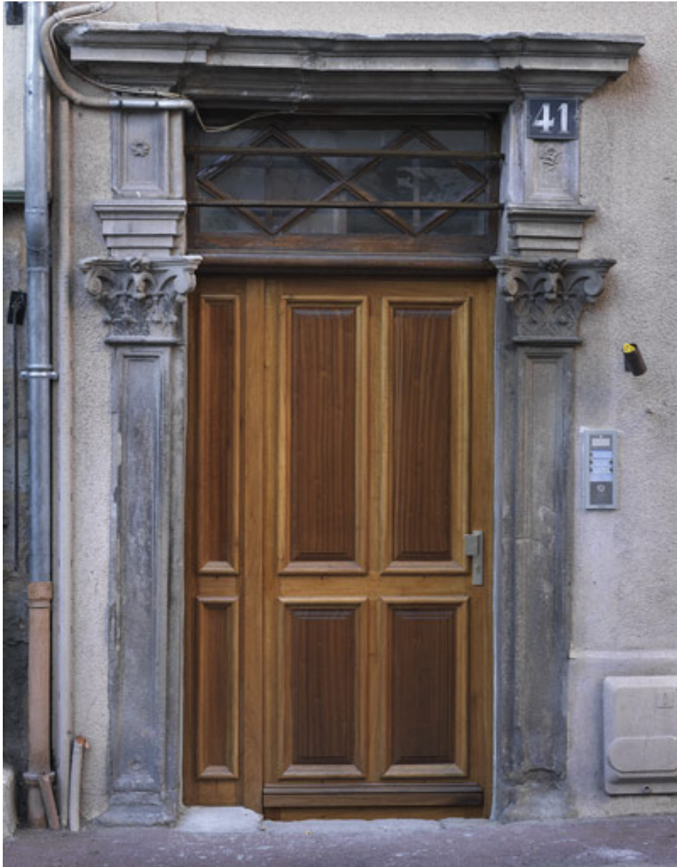
Vue de la porte après travaux exécutés en 2007.