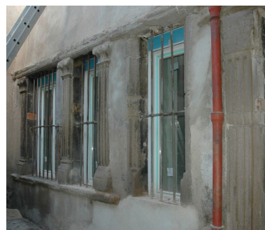
Vue partielle des baies sur cour à pilastres cannelés et chapiteaux ioniques. IVR82_20124202568NUCA