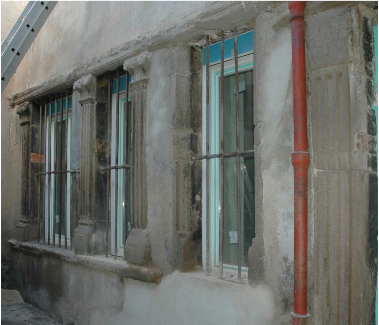
Vue partielle des baies sur cour à pilastres cannelés et chapiteaux ioniques.