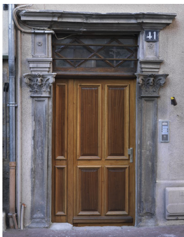
Vue de la porte après travaux exécutés en 2007.