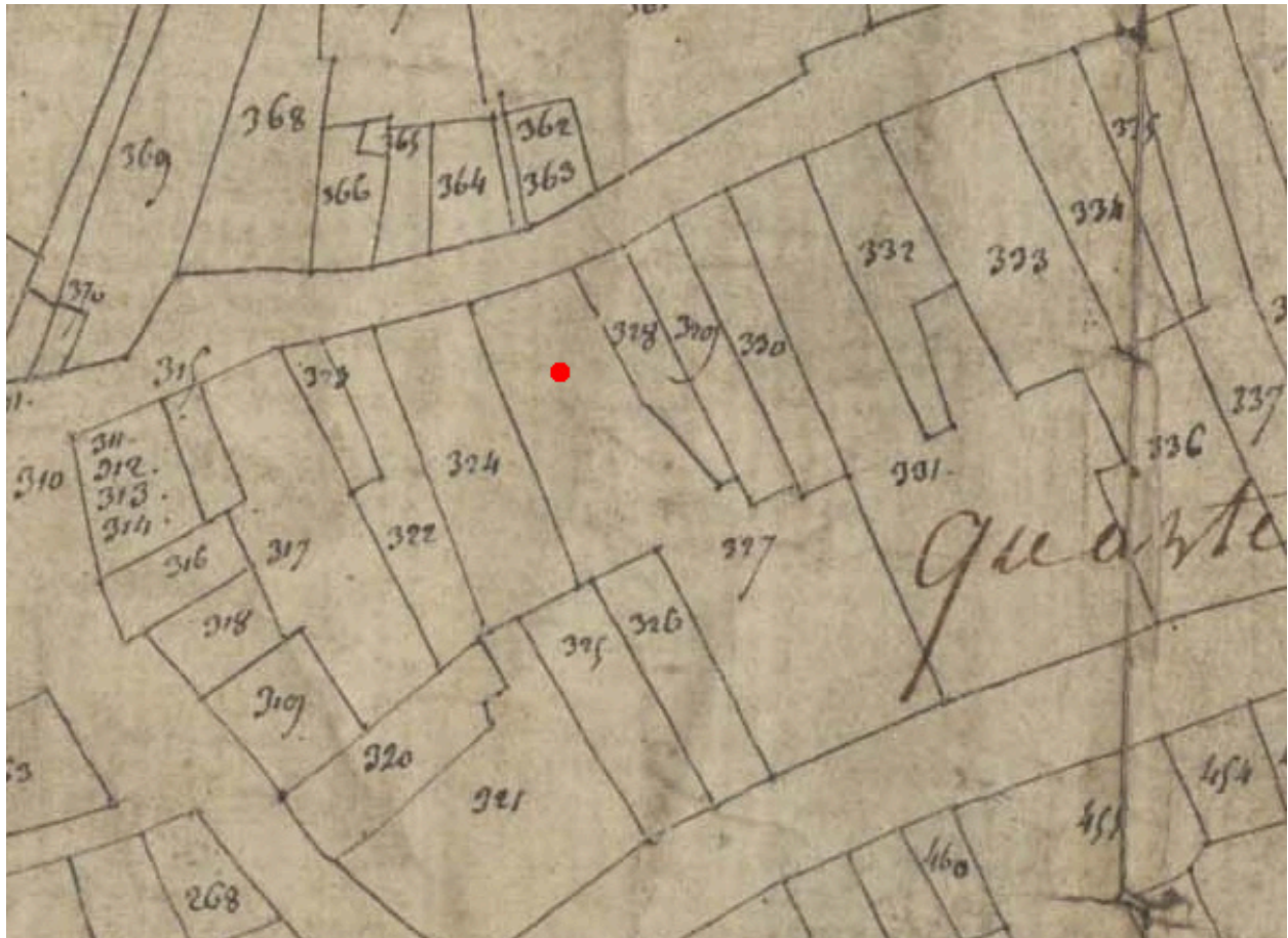
Extrait du plan cadastral de 1809, parcelle E 327 (partie est).