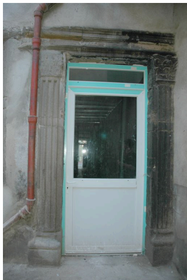
Sur cour, porte piétonne à pilastres cannelés et chapiteaux composites.