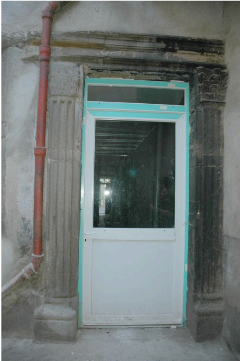
Sur cour, porte piétonne à pilastres cannelés et chapiteaux composites.