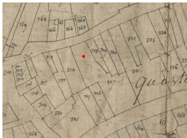
Extrait du plan cadastral de 1809, parcelle E 327 (partie est). IVR82_20124202571NUD