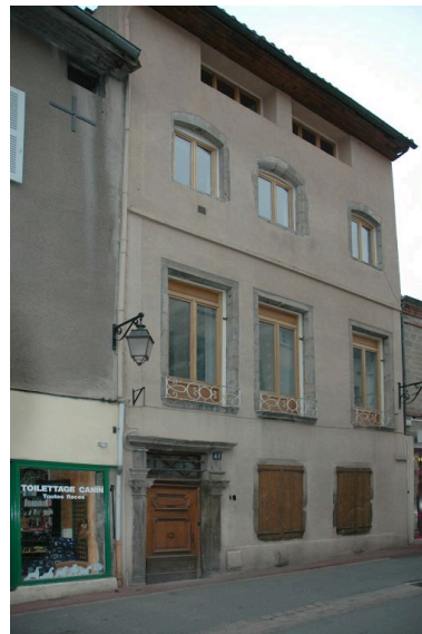
Vue générale. IVR82_20124202566NUCA