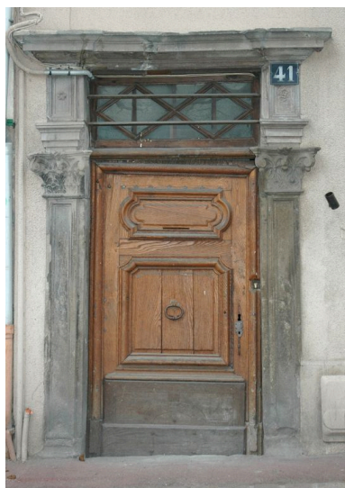
Porte piétonne à pilastres cannelés et chapiteaux composites. Vantail en bois à grands cadres moulurés, 17e siècle.