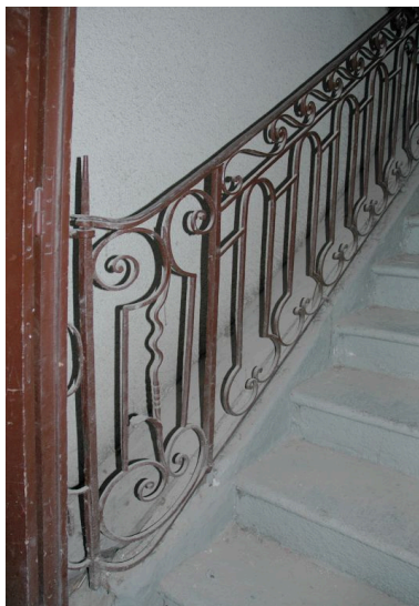
Escalier dans oeuvre : départ de la rampe en fer forgé.