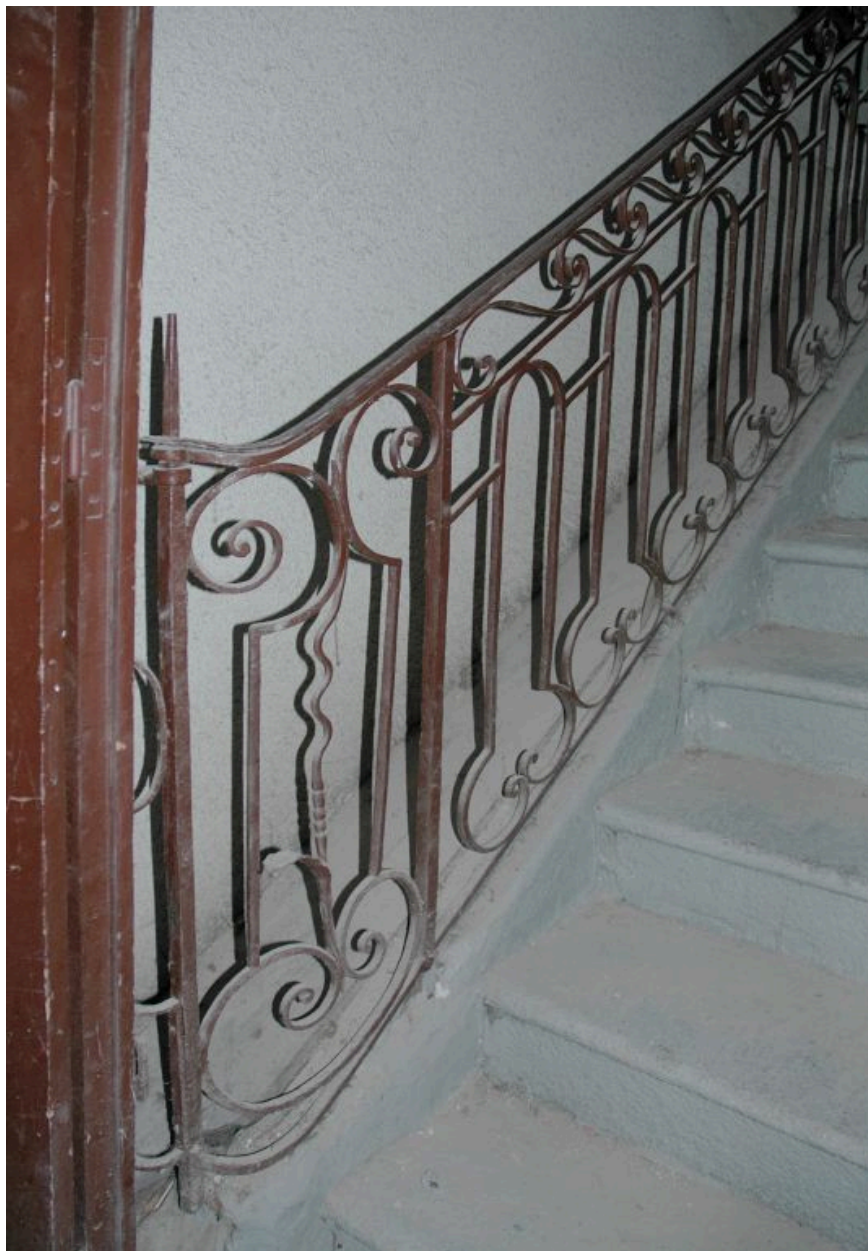
Escalier dans oeuvre : départ de la rampe en fer forgé.