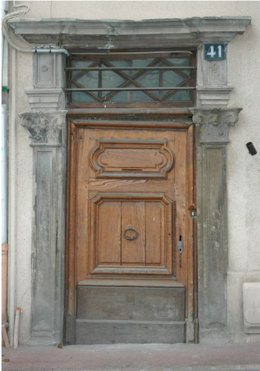
Porte piétonne à pilastres cannelés et chapiteaux composites. Vantail en bois à grands cadres moulurés, 17e siècle.