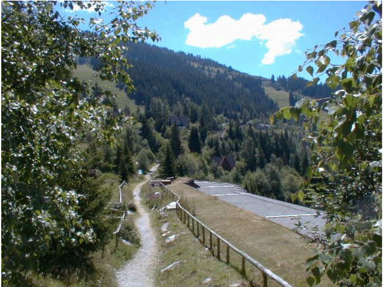
Accès à l'immeuble C3