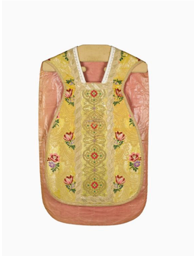
Vue du devant de la chasuble IVR84_20181500026NUC4A