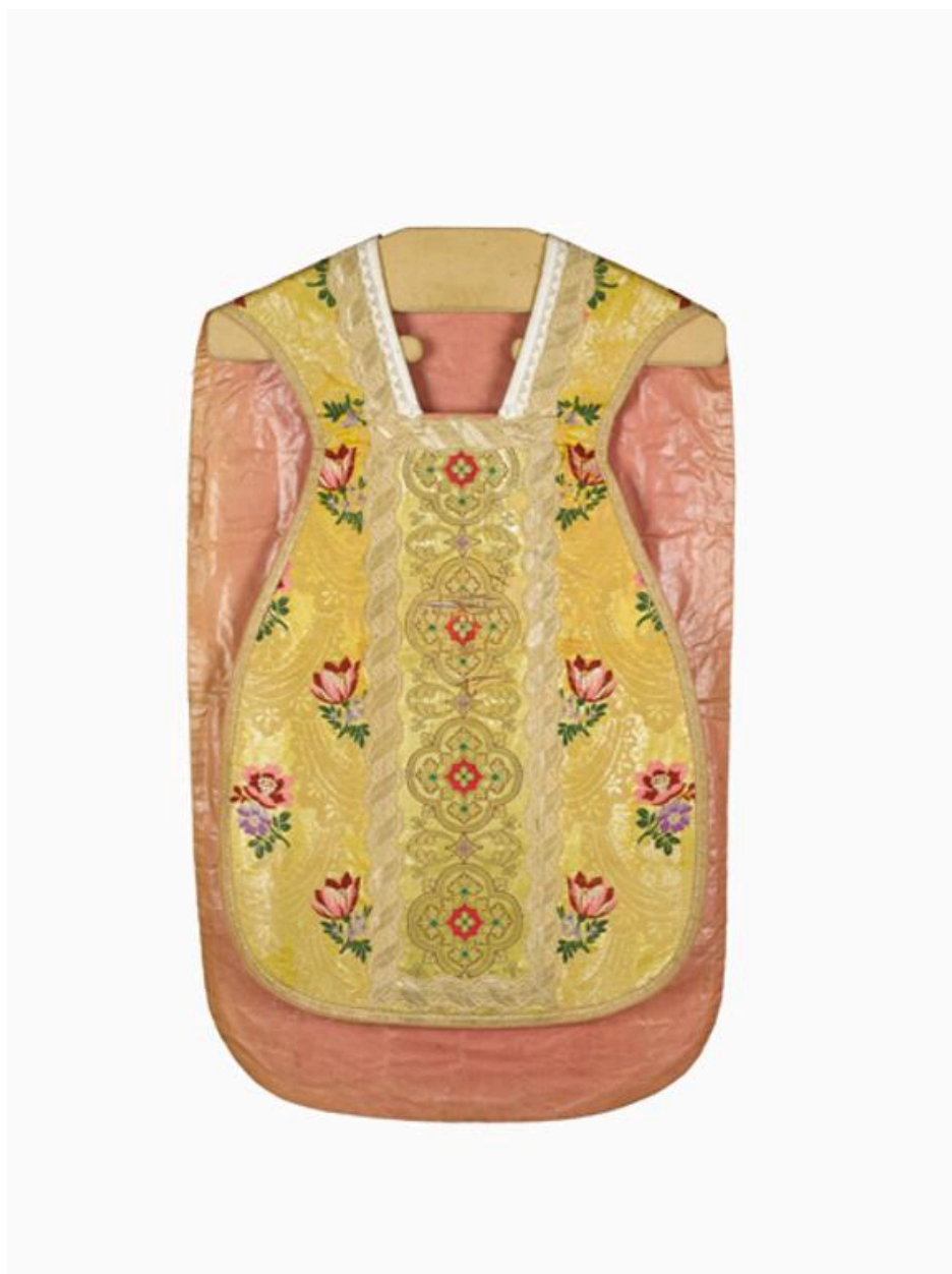
Vue du devant de la chasuble