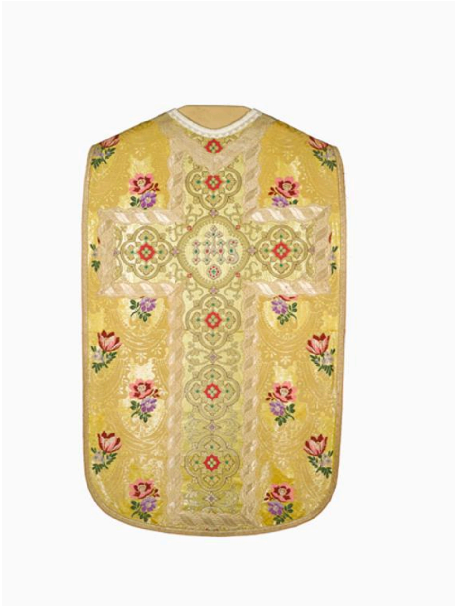
vue du dos de la chasuble