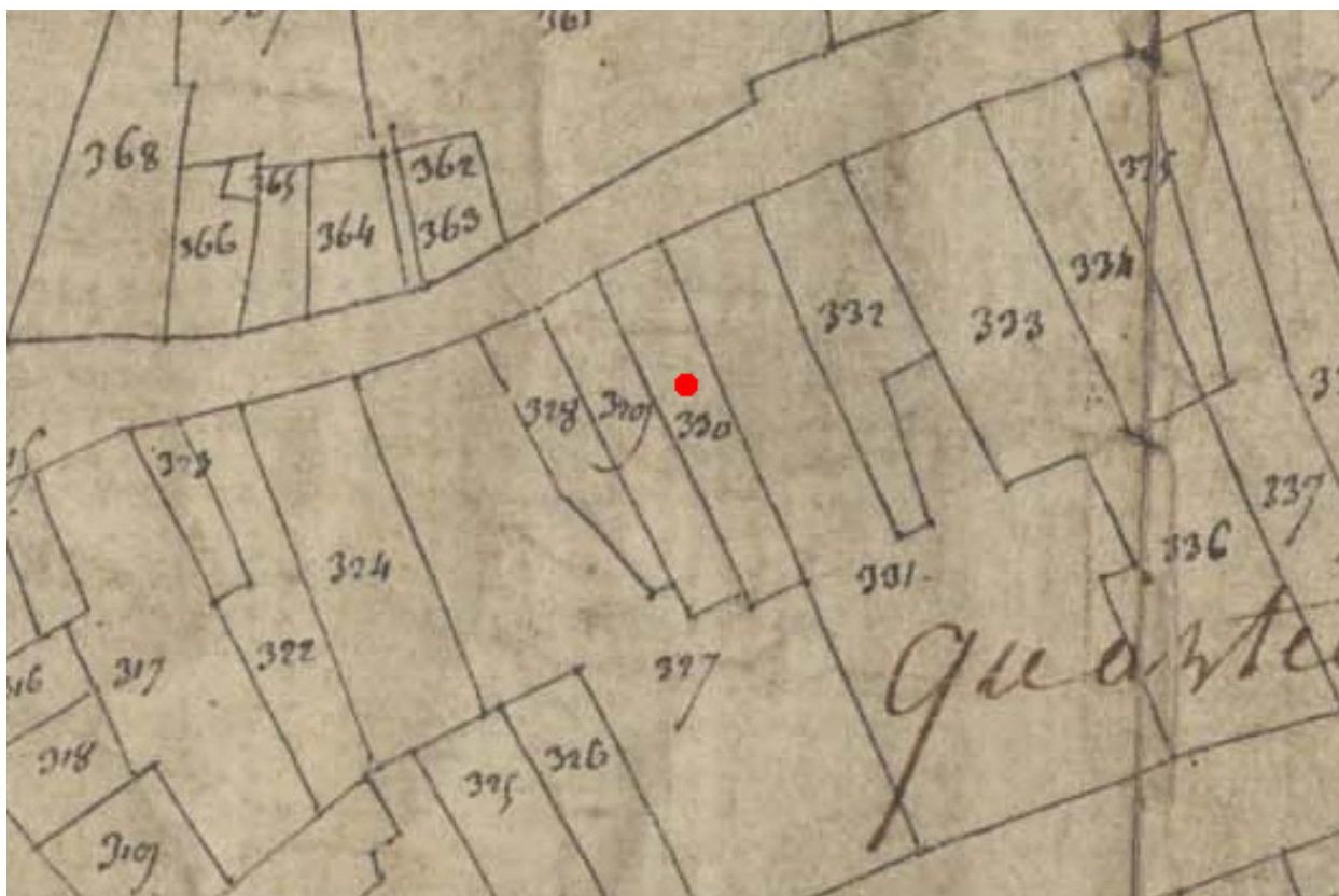
Extrait du plan cadastral de 1809, parcelle E 330.