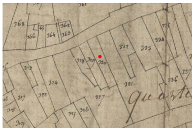
Extrait du plan cadastral de 1809, parcelle E 330. IVR82_20124202574NUD