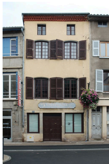
Vue générale IVR82_20124202638NUCA