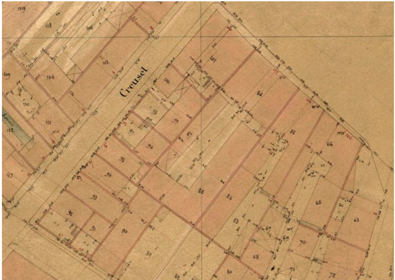
Plan de Lyon. 1886. 1:500. Extrait (AC Lyon. 4S 233)

IVR82_20096901111NUCA