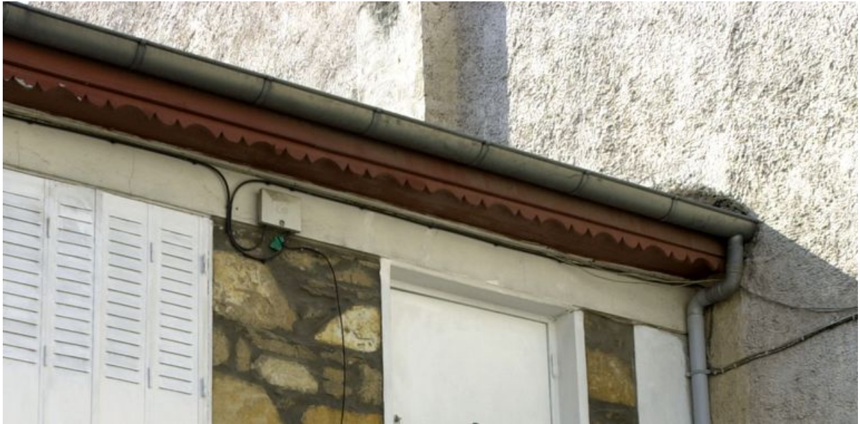
Détail de la corniche et du lambrequin