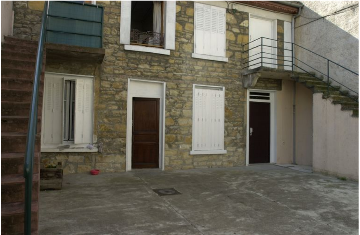
Elévation sur cour